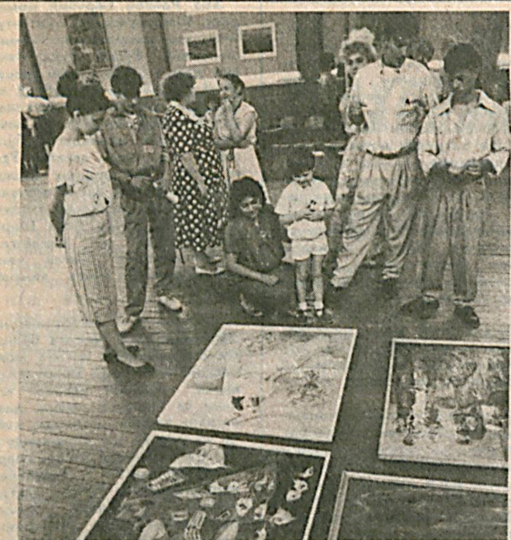
Республика махсус санъат мактаб-интернатда навбатдаги битирув кечаси ўтказилди. Эллинка яқин иқтидорли йигит ва қизлар тасвирини санъат ва мусиқа борасида ўзларининг илк дилломларини муваффақият билан олиб чиқди. Бу даргоҳнинг 35 йиллик фаолияти жамиятимиз учун бир қанча санъаткорларни етказиб берган.