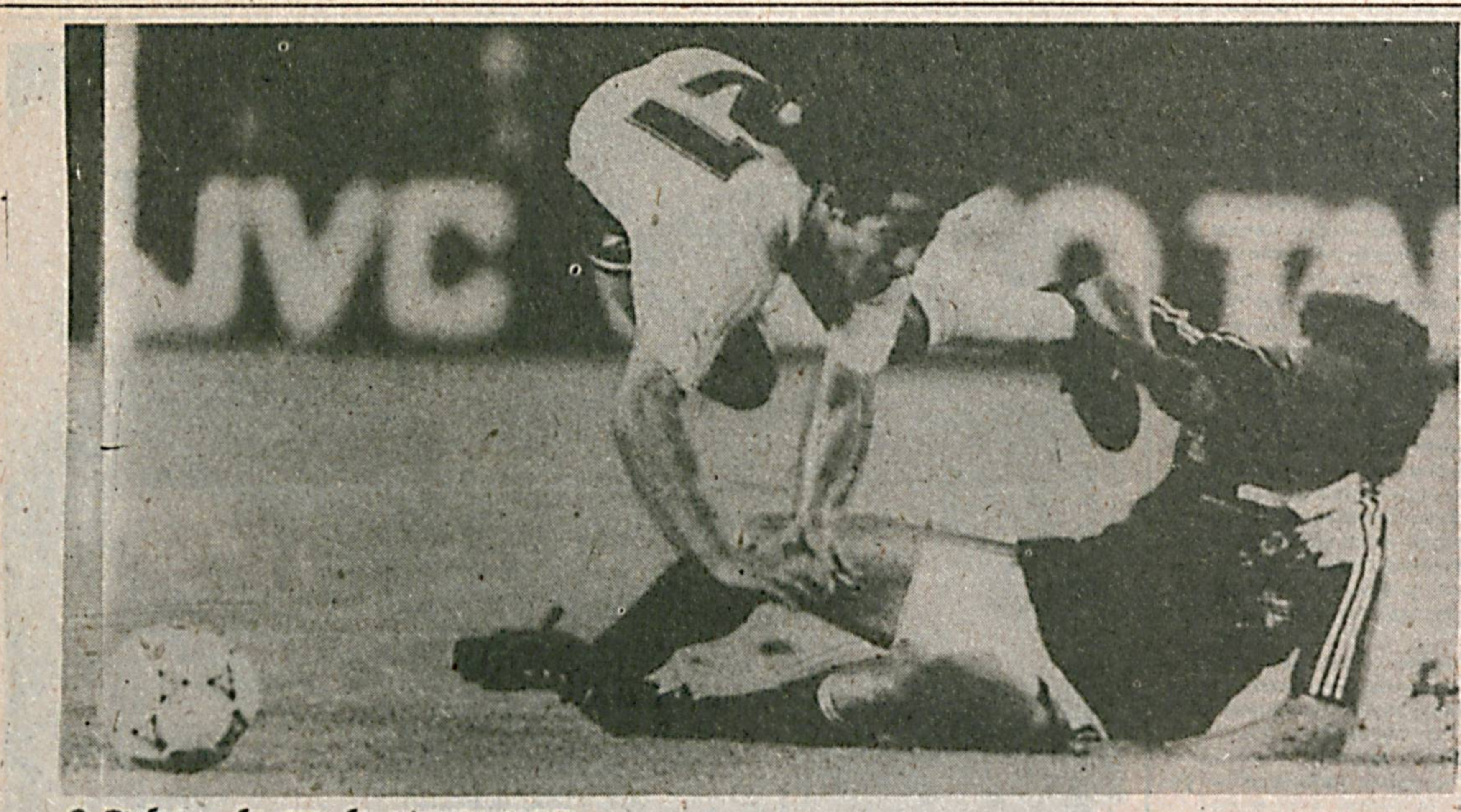
Футбол — бу сехр, бу афсунгарликдир.

МАНА икки ҳафтадан ошқ дээр ичида давом этган VIII Европа футбол биринчилиги ниҳоясига етди. Дунёнинг барча қитъаларидаги миллион-миллионлаб футбол ихлосмандларини икки ҳафта мобайнида ҳисҳажон умонида тутиб турган энҷушон тафти аста-секин босилмоқда.