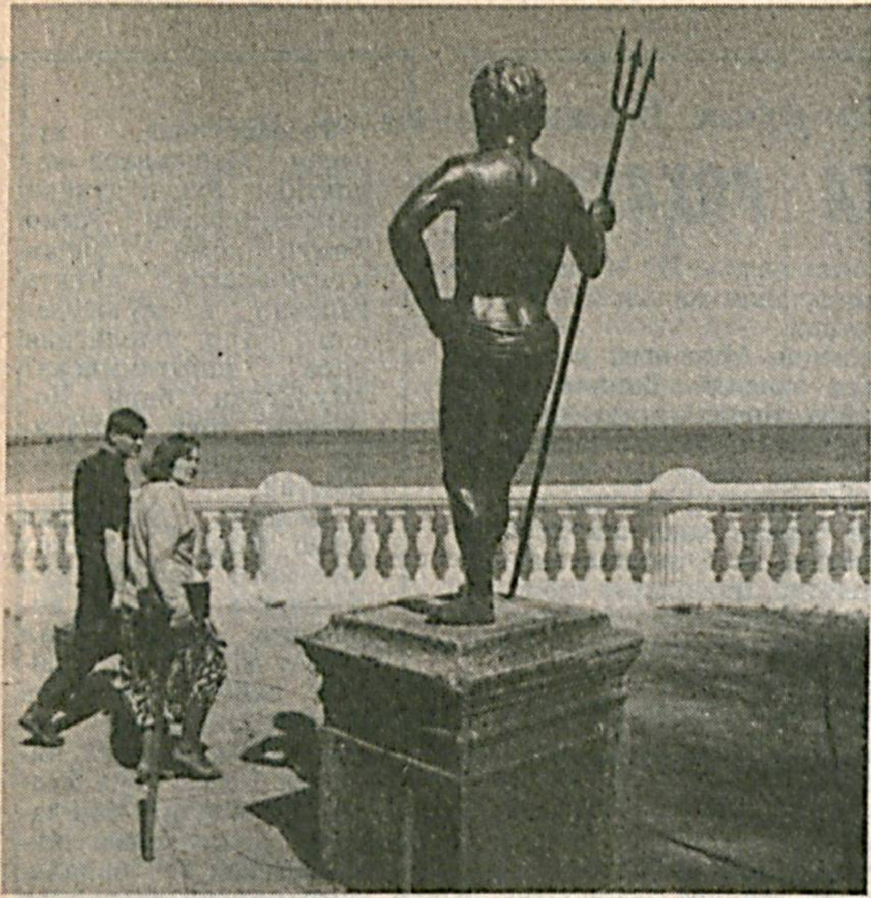
САНКТ-ПЕТЕРБУРГ. Петергоф фаввораларининг навбатдаги ишга туширилишига бағишланган тантанادا аввалгидек минг-лаб одам қатнашмади. Чамаси, бу аънава ўтмишда қоладиганга ўхшайди. Чунки бугунги кунда бу эрда амалга оширилган таъмирлаш ишларининг учдан бир қисминга бажаририлган, холос. Белгиланган вазифаларни ижросига етказишга эса маънавий ёрдам берилди.

СУРАТДА: Петергоф фавворалари.