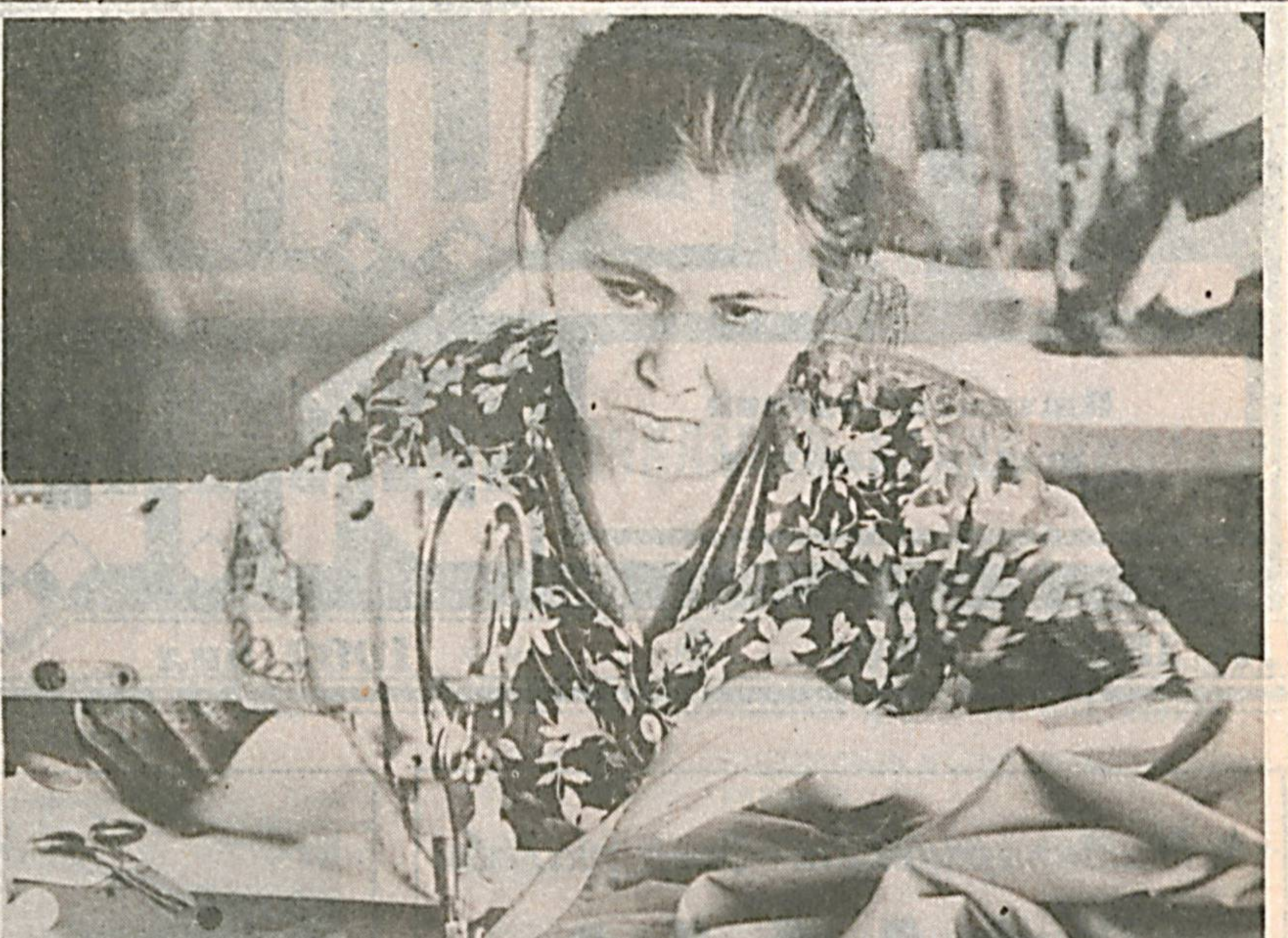
«Чевар» тикувчилик ишлаб чиқариш бирлашмасининг тажриба бўлимида янги андоздаги кийим-кечаклар ишлаб чиқарилади.

Шу билан халқ депутатлари Тошкент ша-ҳар Кенгашининг тўқтинчи сессияси ўз ишини тугаллади.