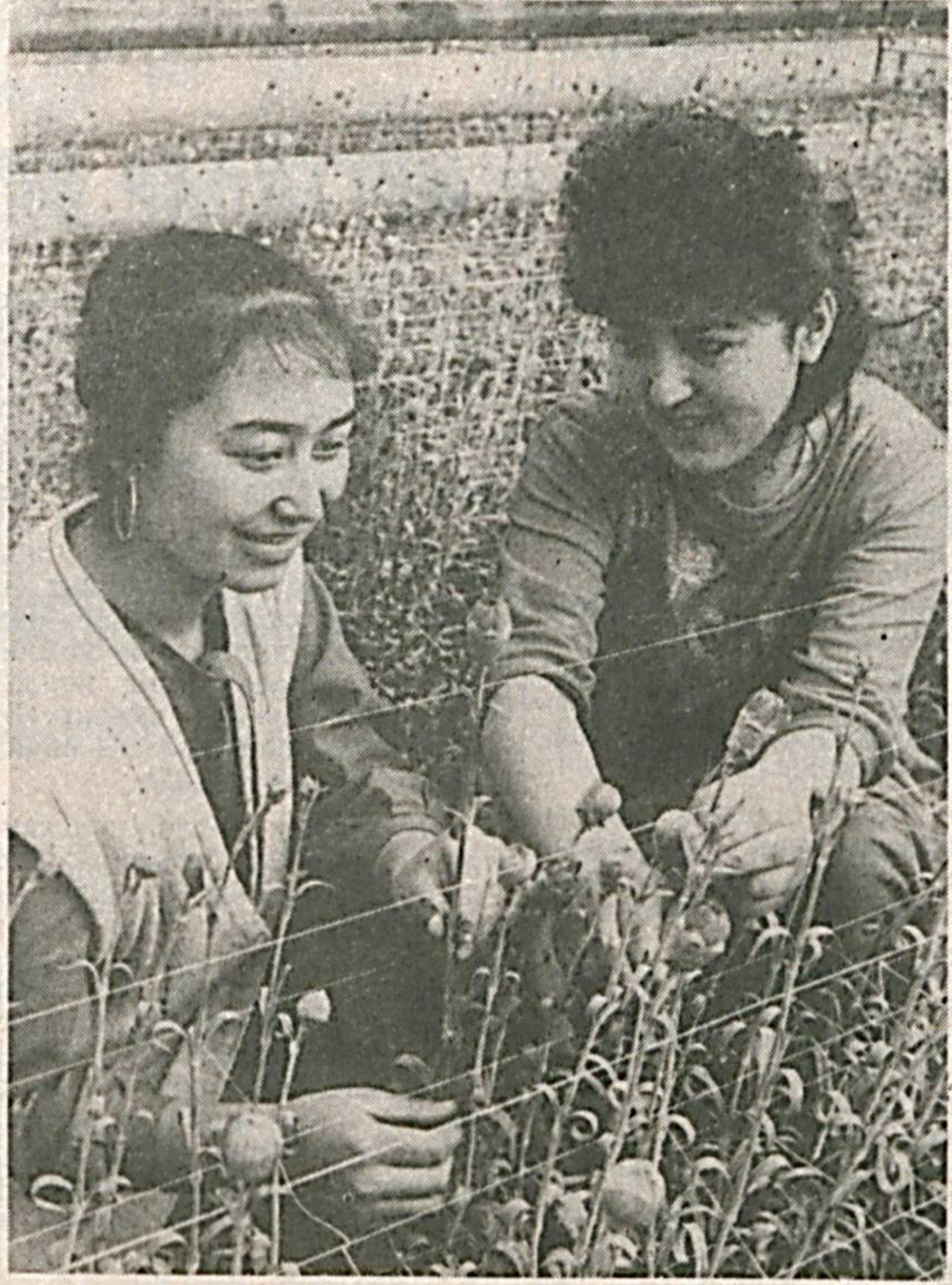
Тошкент районидagi «Ўзбекистон 50 йиллиги» жамоа тўжасини қўшида очилган «Нодир» кичик корхонаси иш бошлаганига ҳали кўп бўлгани йўқ...