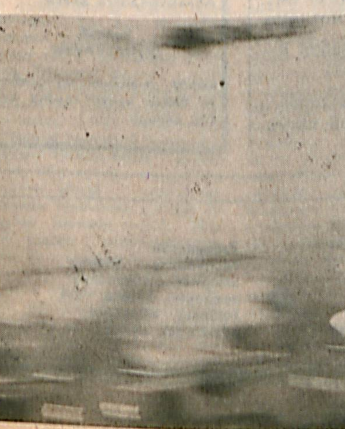
БОЛА дунёга келиб, бозор афзалликларини кўриш имкониятига эга бўлади. Агарда онаси учун ҳақ тўлаган бўлса, алоҳида, у ҳақ кириб ўқитувчи билан инглиз тилини ўргатиш мумкин, агарда онасининг ҳақига кўчарса, мусулмон ҳам эгаллаш имкониятилари бор. Алоҳида бир мамлакатда тенгсизлик эришиш ҳақидаги ўқитиш алоҳида, агар аъсофнага айланса, ўқитиш алоҳида қайнаган қозонга унутинган масалликлар — пул ташланди ва ҳаёт янги там, янги ўлчамга эга бўлди.