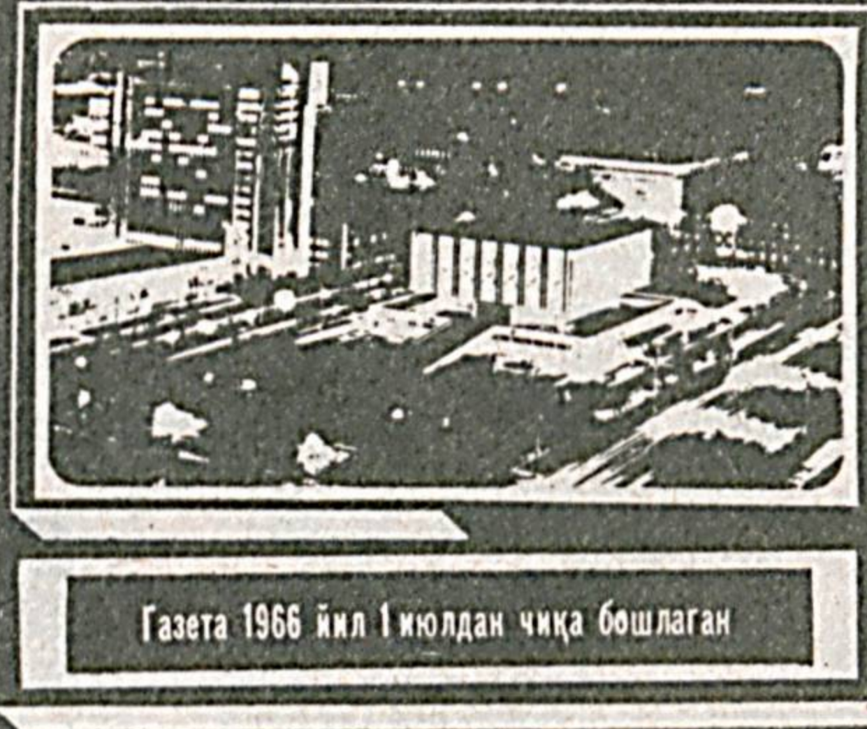
Газета 1966 йил 1 июлдан чиқа бошлаган

№ 143 (8. 085) 1992 йил 22 июль, чоршанба Нархи 2 сўм.