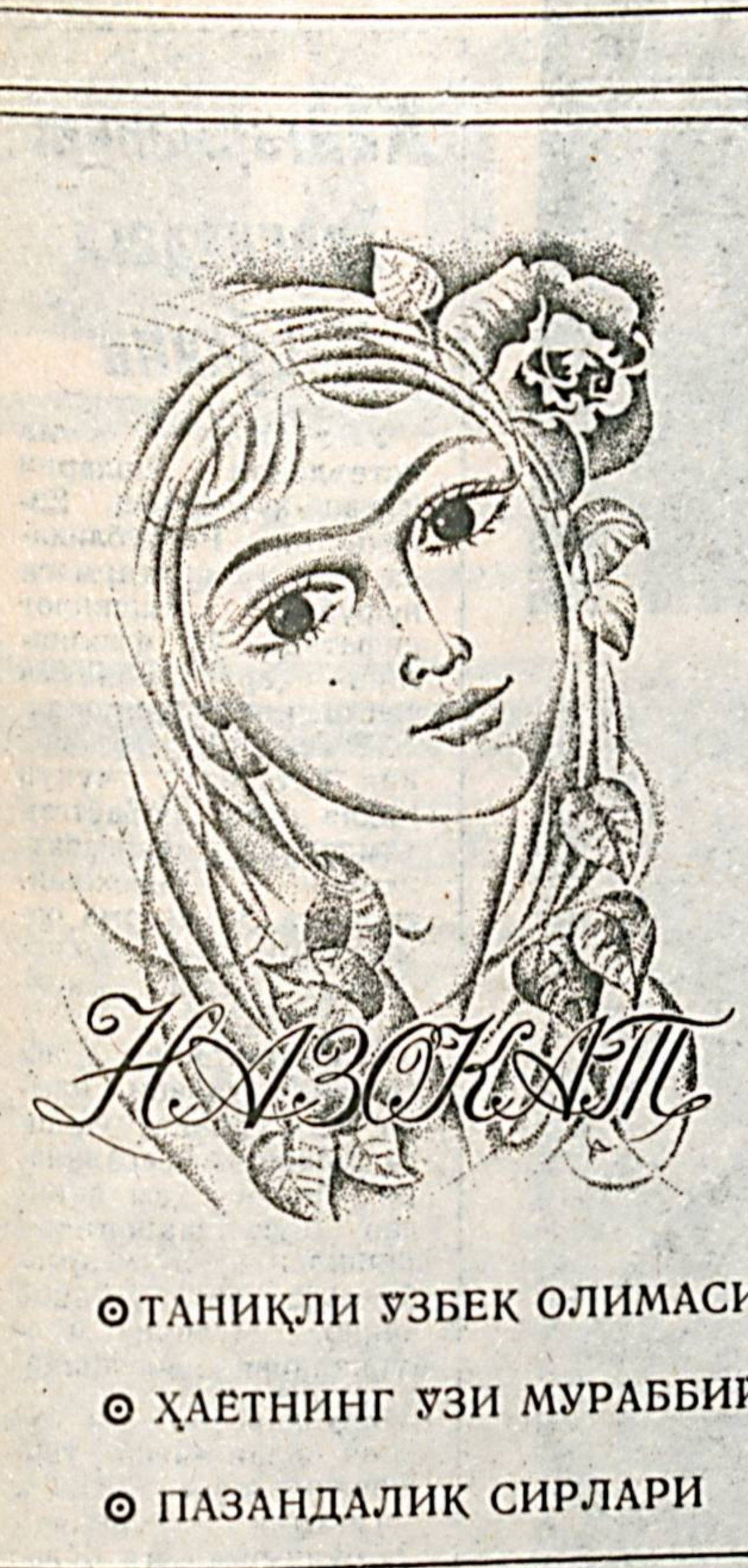
○ ТАНИҚЛИ ЎЗБЕК ОЛИМАСИ ○ ҲАЁТНИНГ ҶУЗИ МУРАББИИ ○ ПАЗАНДАЛИК СИРЛАРИ

Кейинги пайтда мавзеларда маҳаллалар ташкил этилиб, кўп қаватли уйларида истиқомат қилувчилар билан маҳаллалар ўрганишда фарқлиқ йўқлигига ҳаракат қилинаётган. Мазкур маҳаллалардаги ишларнинг кўп қисmini аёллар босқаришмоқда. Хотин-қизлар кенгаши эса уларга бош-қош. Биз бу борада Чилонзор районидан олиб бориладиган ишлар билан ақидан танишдик.