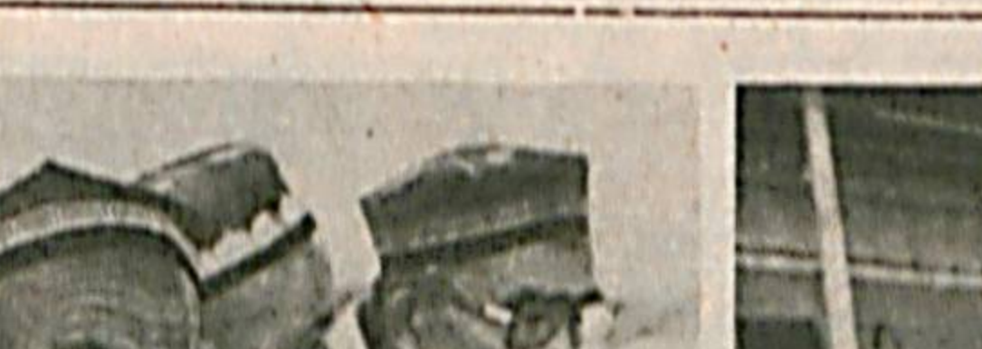
БИР ЛУҚМА ОШ

ДУНЕГА машҳур ўзбек тақли азал-азалдан кўн-кўнчиликнинг, маҳалла-кўнчиликнинг иқдодда қадр-мақдани, ҳурмат қилдиган ақолиб диллат ҳисобланади. Бирвадан бир бурда нонини ширмайди, бирвадан бир лўқма ошини қизганмайди, аксичка, қўлдан келганча яхшилик ва муруват кўрсатади. Сабаби ҳам маълум: ўзбек тақли ақдоқларимизнинг эмг яқин аяна, урф-одатларига эгал қилиб, бир тану бир жон — ақин ва иноқ бўлиб яшашни кстади. Оша-Ватанга бўлган меҳру муҳаббатлари ҳам бўлакча. Айниқса бу меҳру оқибатларни ўзи кичкинаю ташвишлари катта бўлган маҳаллар, шаҳримиздаги катта-кичик идоралар мисолида ҳам аққол кўриш мумкин.