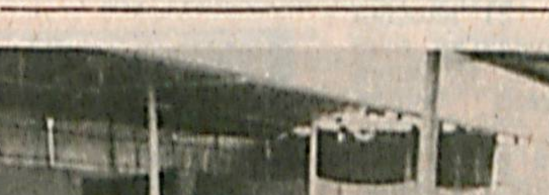
БИР ЛУҚМА ОШ

Сиз сўратда Собир Раҳимов районда бўлиб ўтган маросимлардан нақчалар кўриб турибсиз. Дастурдонга тортилган ош меҳмонлар, қўнқўшини, маҳалла-кўй, қариндош-уруғ билан биргаллида баҳам кўрилади. Ошпаз ошини танерлашда янглишма-гаденк, сузшда, уни тақсимлашда ҳам аниқ ҳисобин олиб туради, негаки ош ҳаммага етши керак. Ош баҳона кишилар бйр-бирлари билан яқиндан танишадилар, алоқаларин йўлга қўядилар.