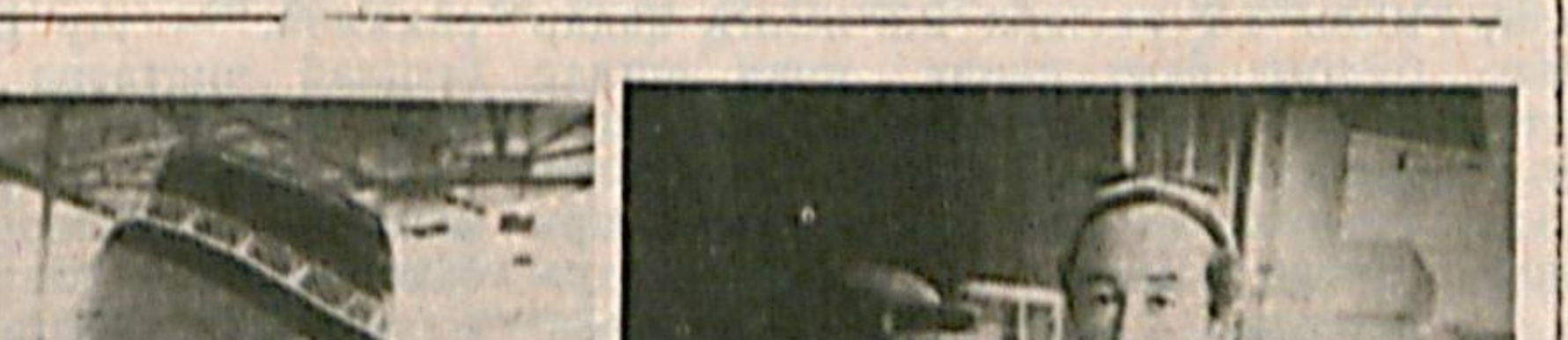
БИР ЛУҚМА ОШ

Рустам Шарипов суратлари. Собир БОЗОРБОВ.