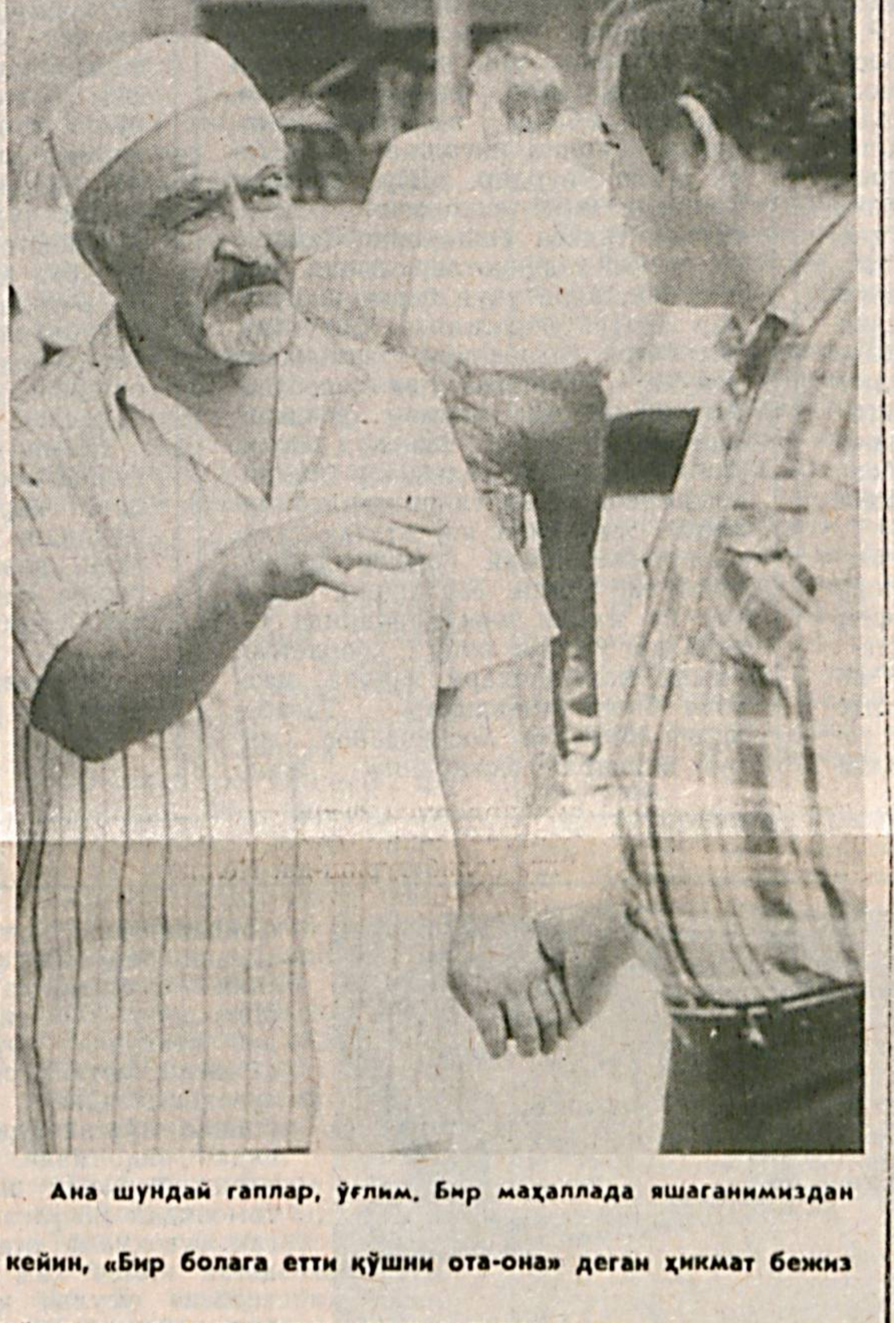
Ана шундай гаплар, уғлим, Бир маҳалада яшаганимиздан кейин, «Бир болага етти қўшин ота-она» деган ҳикмат бежиз айтилмаганлигига ишонч ҳосил қиласиз.