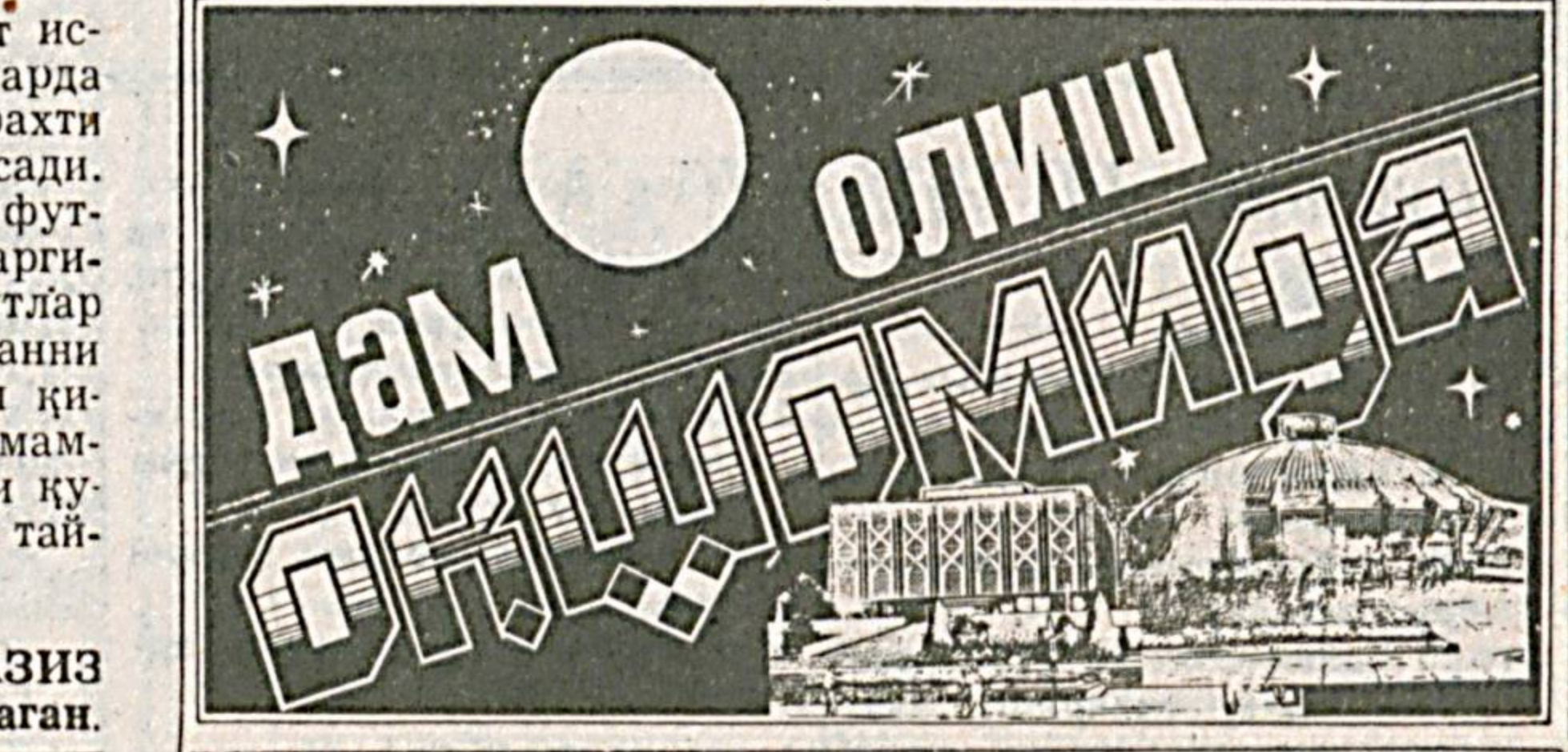
Санд АЗИЗ тайёрлаган.

— Апельсин дарахтининг бўйи 12 фут (бир фут —