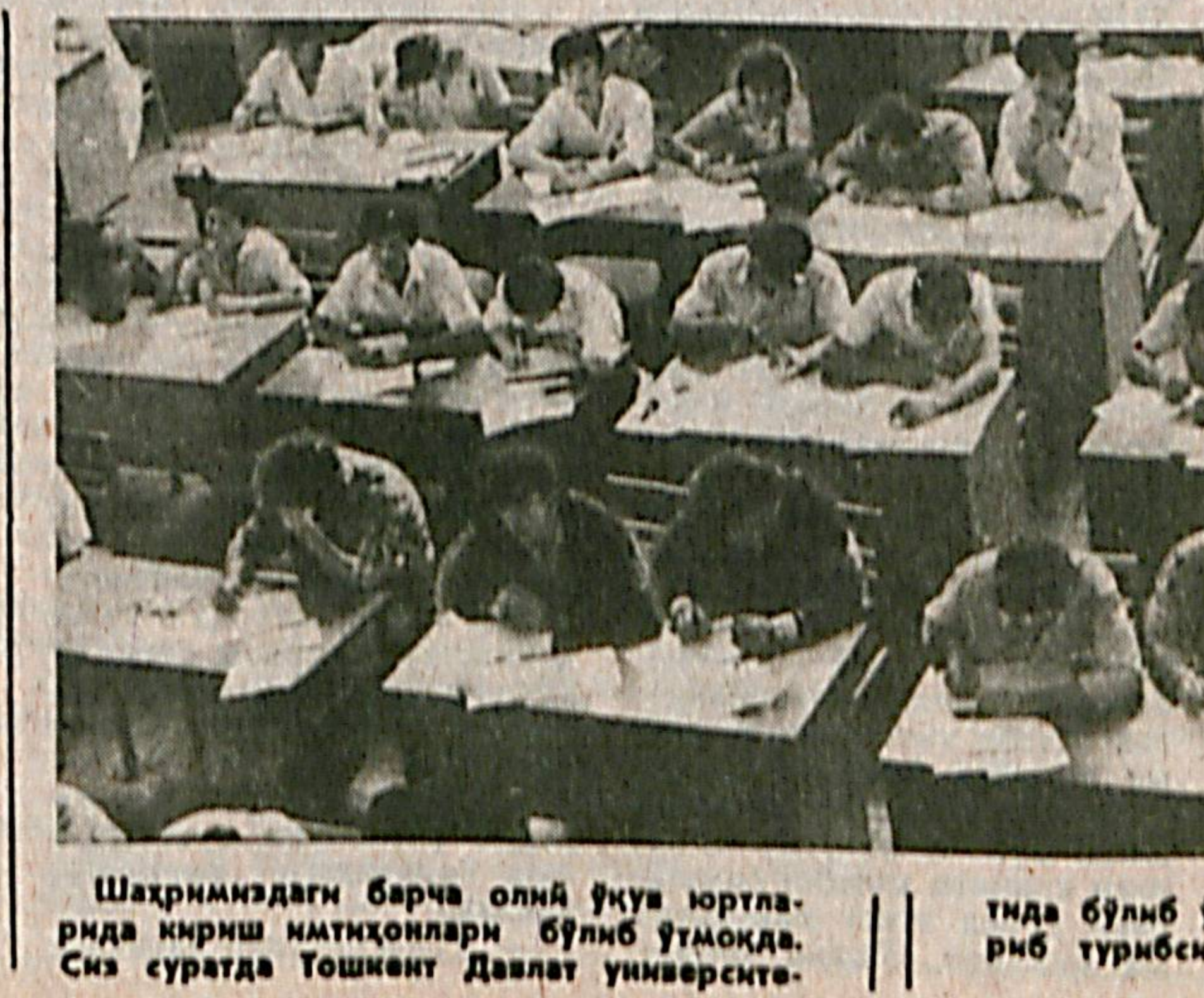
Шаҳримиздаги барча олий ўқув юрти-ларида кирши имтиҳонлари бўлиб ўтмоқда. Сиз суратда Тошкент Давлат университети-нда бўлиб ўтаётган имтиҳондан лавҳа кўриб турибсиз.

Талабалар айни бунда палеонтологик ихтисосликни амалиётда қўллаш кўникмасига эга бўладилар. Воҳид ВАЛИЕВ.