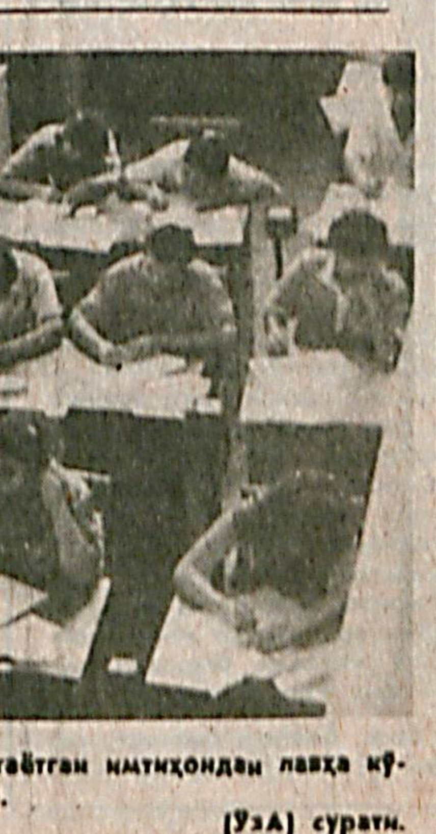
Шаҳримиздаги барча олий ўқув юрти-ларида кирши имтиҳонлари бўлиб ўтмоқда. Сиз суратда Тошкент Давлат университети-нда бўлиб ўтаётган имтиҳондан лавҳа кўриб турибсиз.

Кеча маҳаллий вақт билан соат 17.02 минут ўтганда Тошкентда икки бал билан ер силқиниши рўй берди. Ер қимирлашининг асосий маркази қўшни Тожикистондадир.