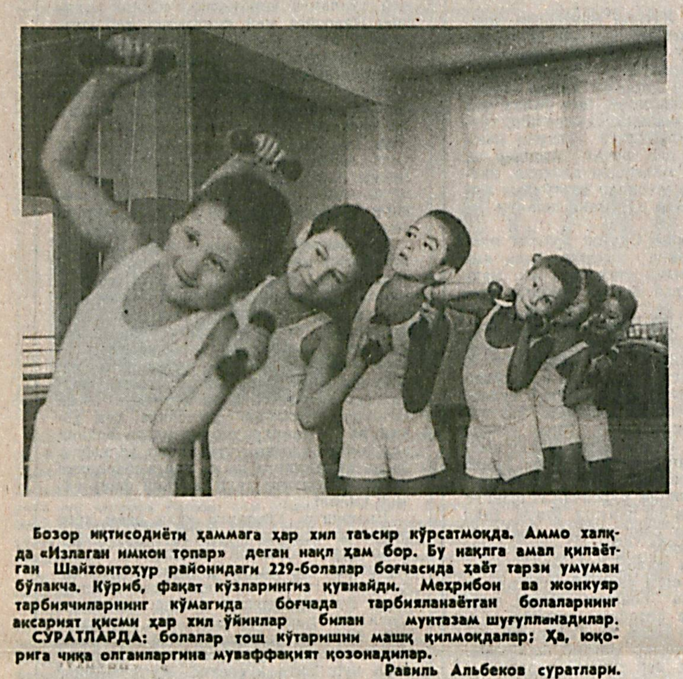
Бозор иқтисодиёти ҳаммага ҳар хил таъсир кўрсатмоқда. Аммо халқда «Излаган имкон топар» деган нақл ҳам бор. Бу нақлга амал қилаётган Шайхонтоҳур районидagi 229-болалар боғчасида ҳаёт тарзи умуман бўлмади. Кўриб, фақат кўзларингиз қувнайди. Меҳрибон ва жонқуяр тарбиячиларнинг кўмагида боғчада тарбияланётган болаларнинг аксарият қисми ҳар хил ўйинлар билан мунтазам шугулланишди.

жойда бирдек бўлса дейсан киши. Албатта, бундай одамгарчилик ҳиммат, саховат бор жойда бўлади. Инсоннинг бошига иш тушгандагина одамларнинг саховати намоён бўлади. Бундай инсонлар юқоридagi ҳикоятда ҳам мадҳ этилади. Юртимиз оқиб бўлиб бормоқда. Қаровисз жойлар гузарларга айланмоқда. Ана шундай тадбирларни ҳар томонлама қўллаб-қувватлашимиз лозим. Ҳаётда серсаховат кишилар туфайлигина товулгимиз, ўзбекилимиз, одамгарчилигимиз янада ёрқинроқ жойланади. Шундангина қўн-қўнглилар, қариндош-уруғлар, дўст-биродарлар меҳр-муруватли бўладилар. Жанжал, фисқу-фасод, ғийбат, кўрломаслик каби ёт тушунчалардан узоқроқ бўламиз. Сўзини ҳазратнинг «Ҳайратул-аброр» асаридagi шундай ҳикоят билан тугатмоқчи эдим. «Кимки Қорун хазинасига эга бўлиб, Жамийд мамлакатни, Фаридун (қадим Эрон минфиқ подшоҳи) тоғи уники бўлиб, хайр учун бутун бир ҳазинасининг эшигини очмаса, фойдасиз дуру-ғавҳарлар сочмаса, ўринсиз қарам кўрсатмаса, битта хайрга юз минглаб дирҳам бермаса, очта овнат берса, яланғочга тўн, юз сўм сураганга ўн сўм берса, янча бойлиги бўлса, шунга қаноат қилса, тангри олдида ҳам, халқ олдида ҳам унинг айблари доим нечирилади».