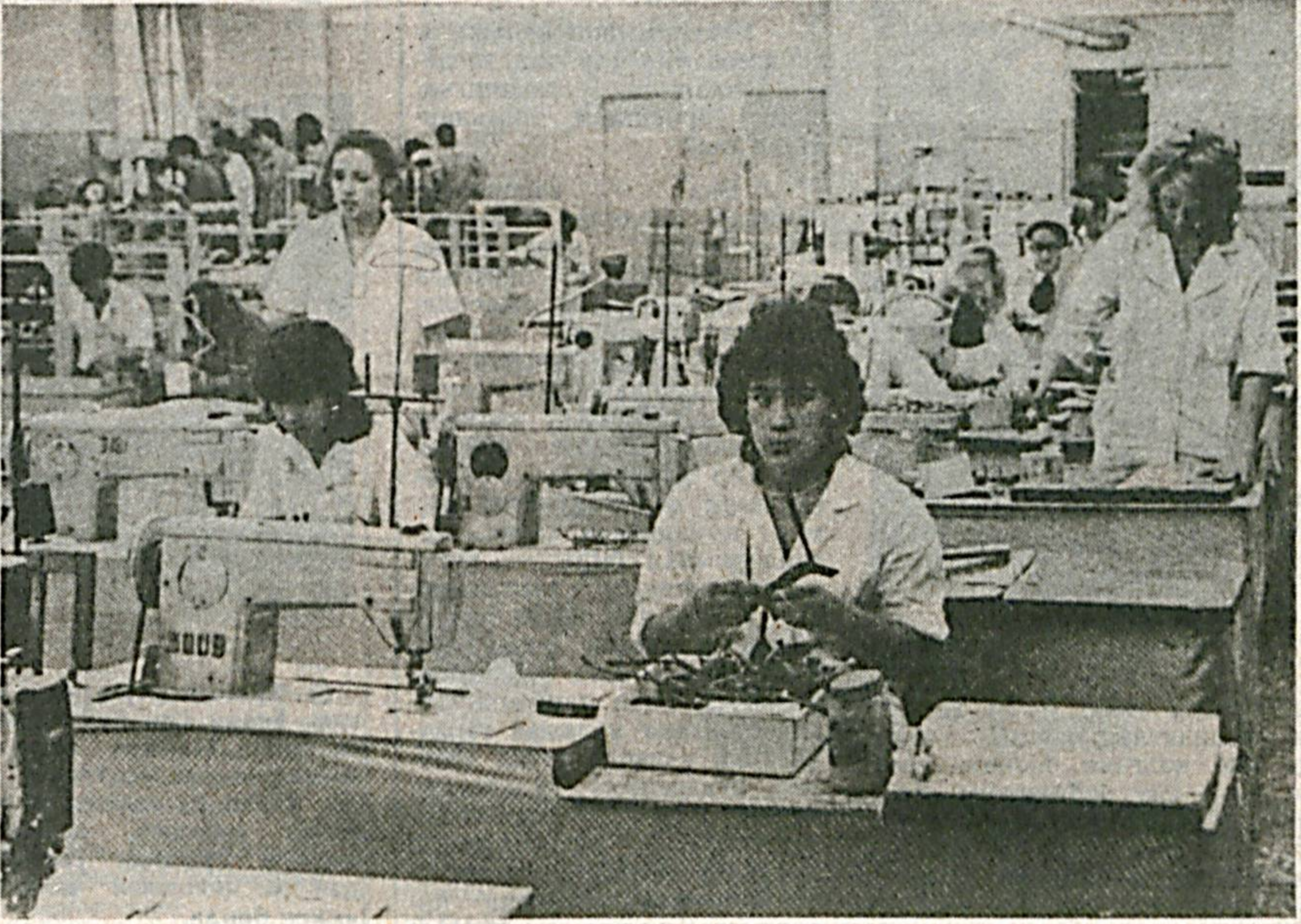
Ф. Ҳўжаев номидagi 1-ойабзад фабрикаси меҳнаткашлари томонидан тайёрланаётган оёқ-кичимлар ҳамшаҳарларинизга маълум бўлмоқда. Сиз суратда ана шу фабриканиннг янги тайёрлов