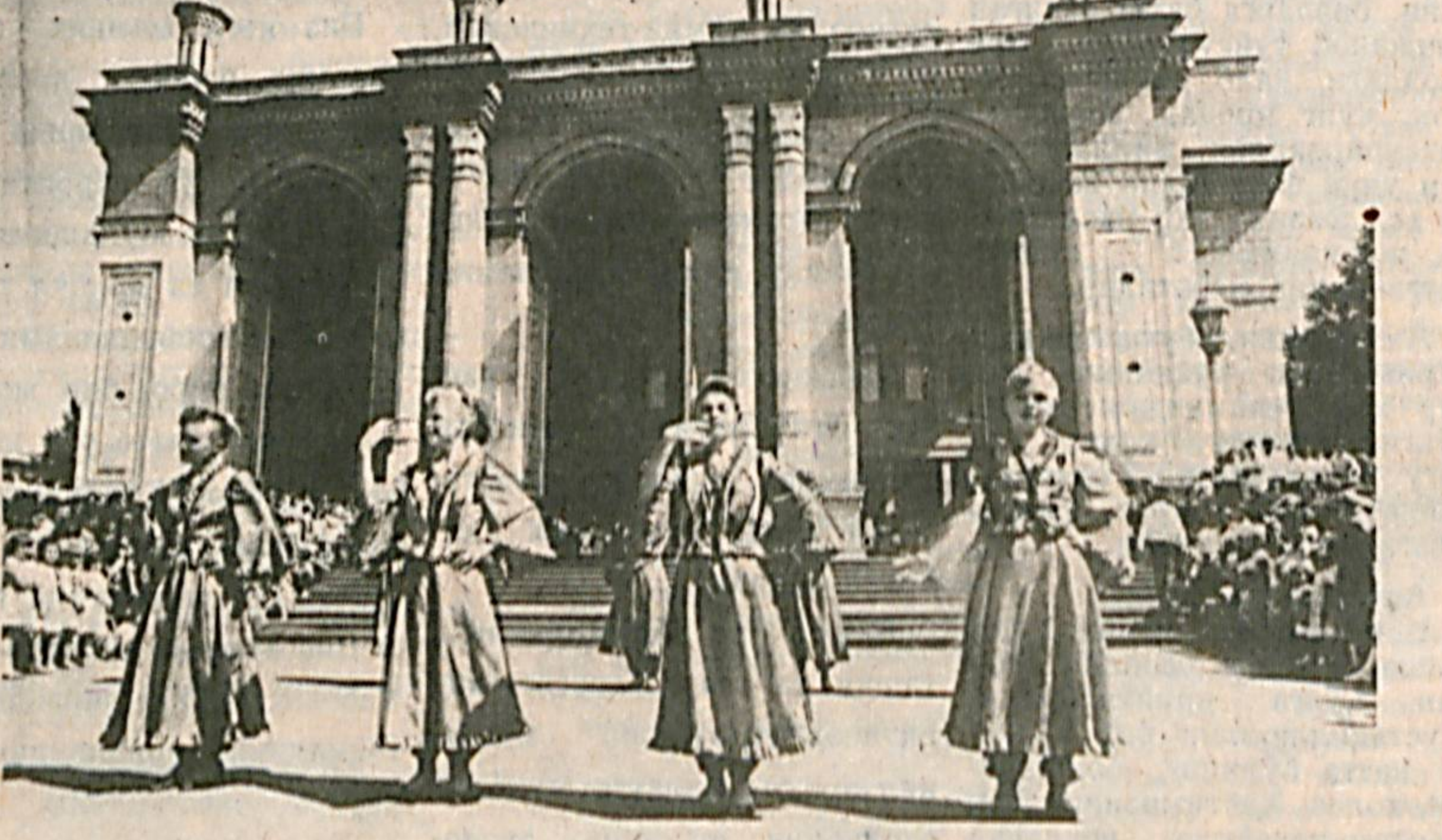
© Тошкентда Ўзбекистон Мустақиллигининг бир йиллигига бағишланган байрам тантаналаридан лавҳалар.