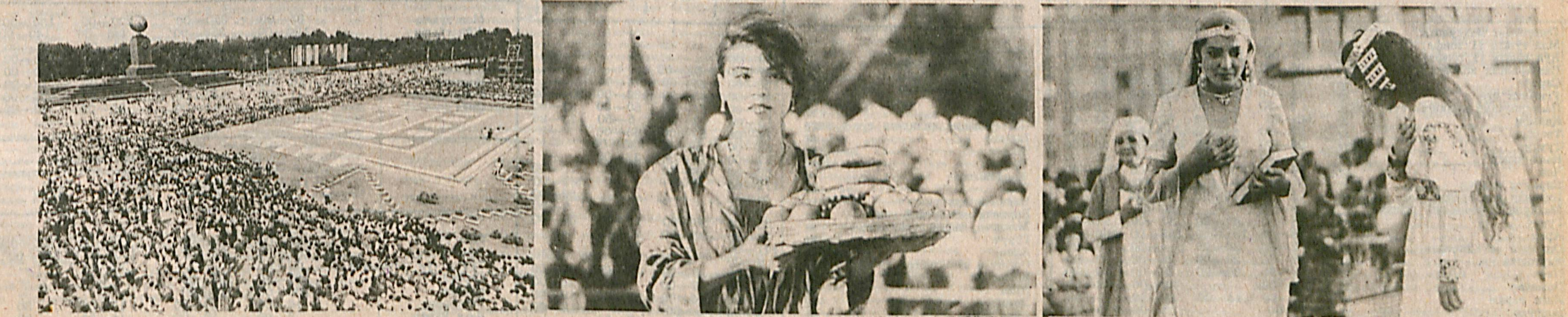
Тошкентда Ўзбекистон Мустақиллигининг бир йиллигига бағишланган байрам тантаналаридан лавҳалар.

Ўзбекистон — келажаги буюк давлат. Биз мустақил, демократик, ҳуқуқий жамият қураямиз. Ниятимиз инсонпарварлик, виждон эркинлиги қондаларига асосланган, миллати, дин-эътиқодидан қатъи назар, фуқаро ҳуқуқ-лари ва эркинликларини таъминлаб берадиган тизим қу-ришидир.