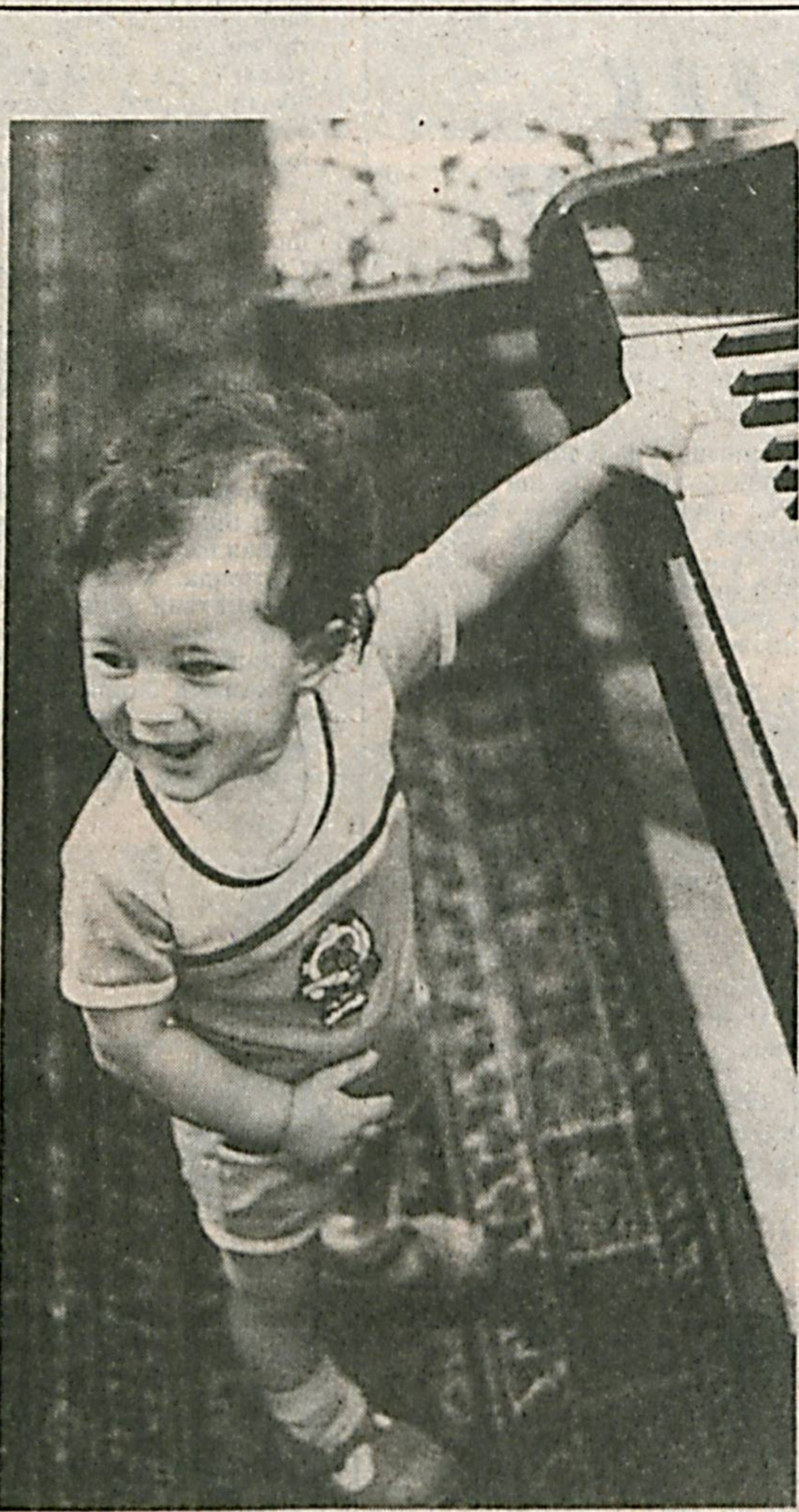
Мен инаниш чаламан...