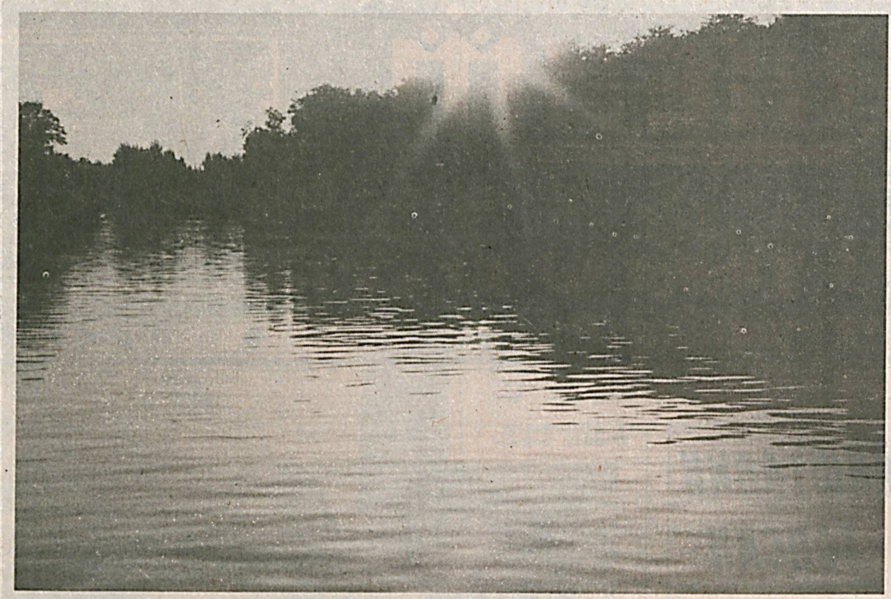
Сой соҳили сўлим-сўлим.

Жамоатчи муҳбиримиз Урта Осие геология ва минерал хом ашё институтига қарашли тажриба-услубият экспедициясининг геология партия бошлиғи, геология-минералогия фанлари номзода Шокир Мўминов билан етук олимнинг инсоний қизилатлари хусусида суҳбатлашди.