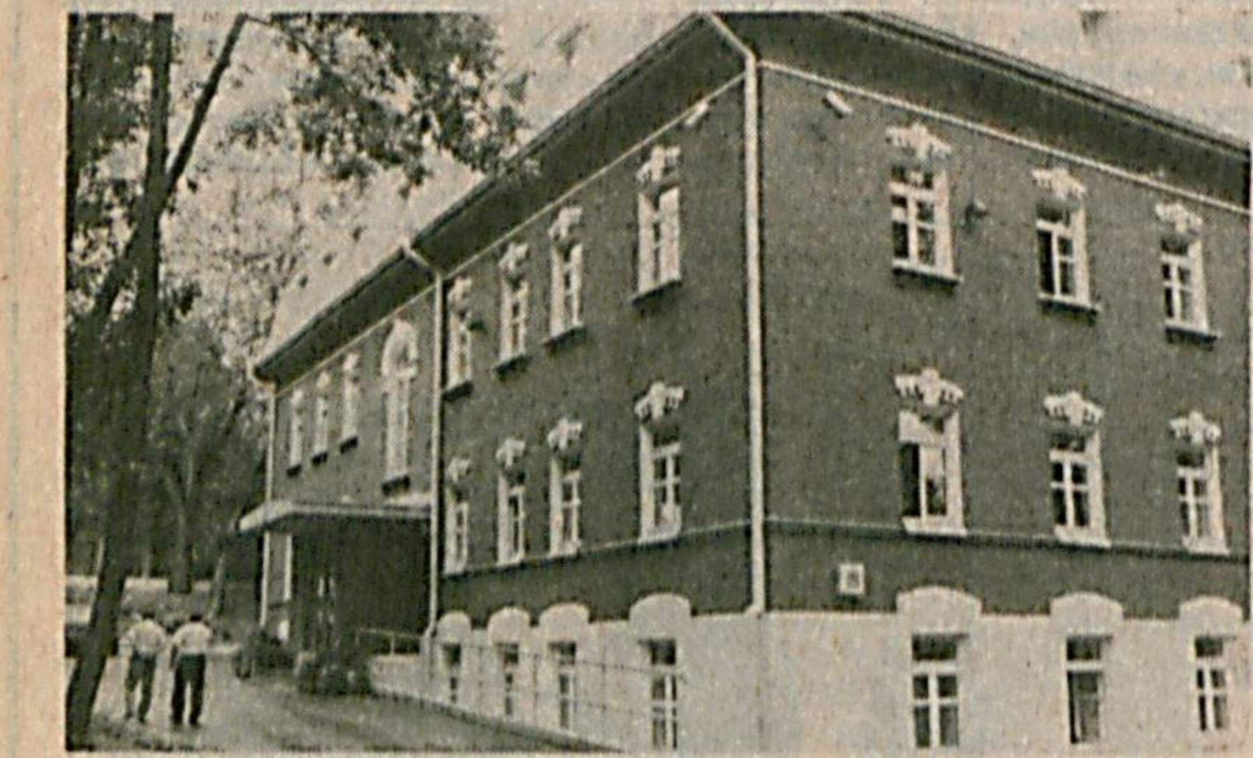
Москва. Бундан тўрт йил муқаддам америкаликлар билан ҳам- корликда бароб қилинган «Қайта қуриш» куралини таш- килоти вазоси эски иноватлари, эски усулда, тарихий чизмалар востасида қайта таъмирлаш билан шуғуллани- ди. Ана шундай усулда қайта таъмирланган ва Москва шаҳрининг марказида жойлашган олти қаватли бино Ва- ракико усулида қайта қуришга янги ағаларига топширилди. Унинг янги хўжайнларга гарбий кампаниининг вақилла- ридан иборат.