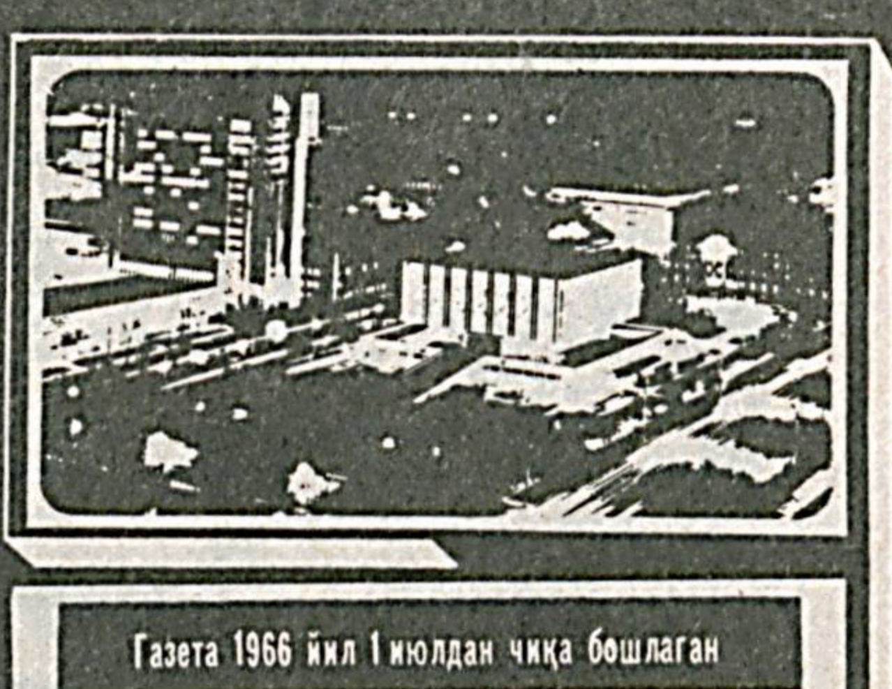
Газета 1966 йил 1 июлдан чққа бошлаган

№ 185 (8. 127) 1992 йил 21 сентябрь, дшанба Нархи 2 сўм.