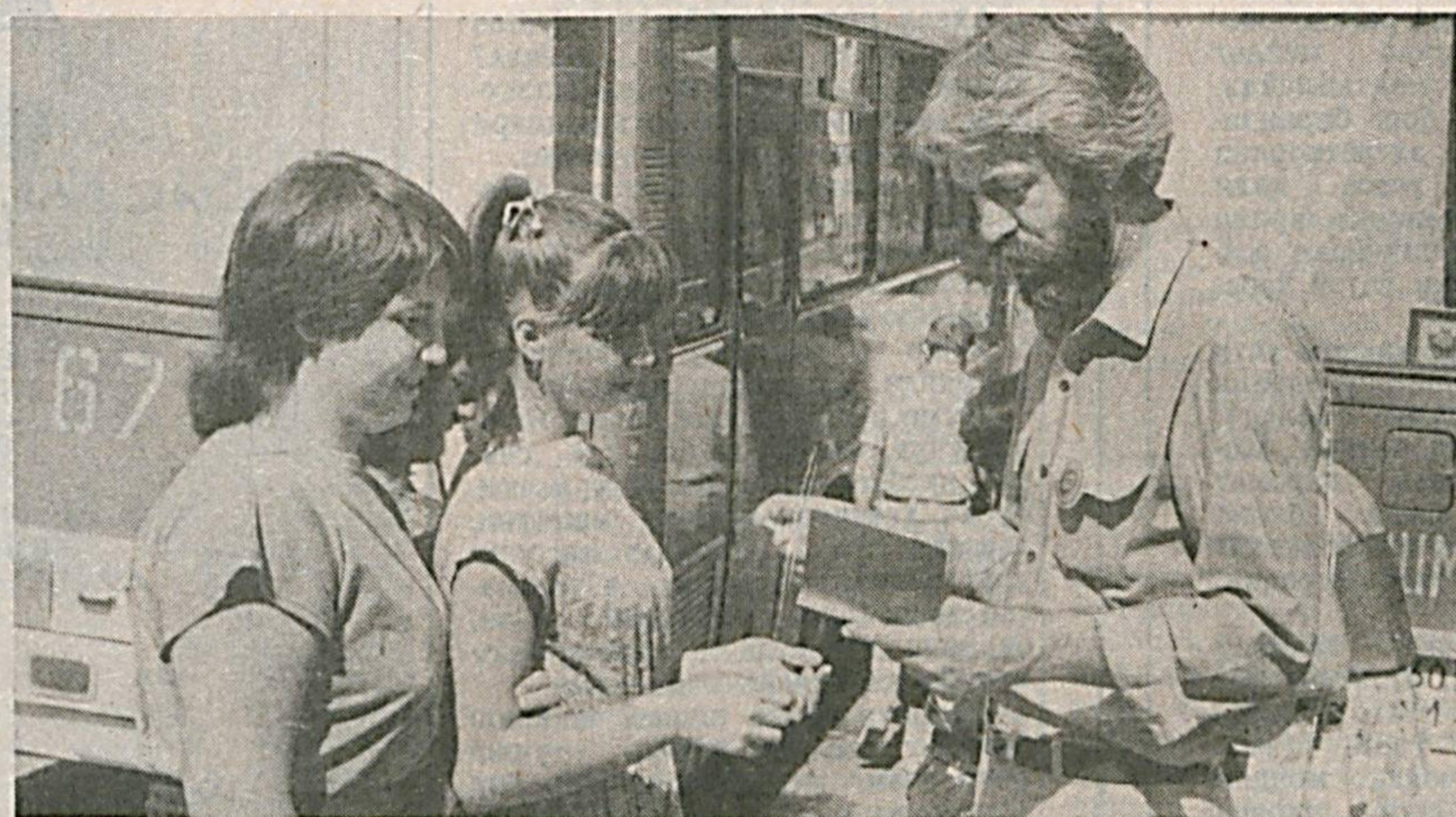
XI халқаро Тошкент кинофестивали тобора яқинлашиб келмоқда. Ҳадемай, томошагоҳларда, хабонларда дўстона учрашувлар, бахслар авжига минади. Худди кун кечагина ўтказилгандек туолган IX халқаро кинофестивал ҳам шодоналарга бой бўлган эди.

БУНДАН бир йил муқаддам республика миз пойтахти Тошкентдаги киночилар уйда бўлиб ўтган матбуот конференциясида кейин «Амир Темур» бадий фильмини яратиб юзасидан дастлабки ижодий ишлар бошлаб юборилди. Уша қайноқ музокарада бўлган кино асарининг ижодкорлари ва мутасаддилари жуда кўп ва санъаткорлар, шунингдек журналистларнинг саволларига жавоблар қайтардилар. Кейинчалик янги бадий фильм ташаббускорлигини Ўзбекистонда хизмат кўрсатган санъат arbоби, режиссёр Али Хамроев ва Италия ҳаёдро кинокомпаниясининг вакили, фильм бош директори Перо Амати ўз зиммасига олганликлари маълум бўлди. Дарҳақиқат, ҳар бир халқнинг ўз ўзининг ўзбек халқининг узоқ тарихи ва унинг жуда кўп ёрқин, сирли саҳифалари ҳаёзгача афсуслар бўлсинки мукаммал ўрганилган эмас!