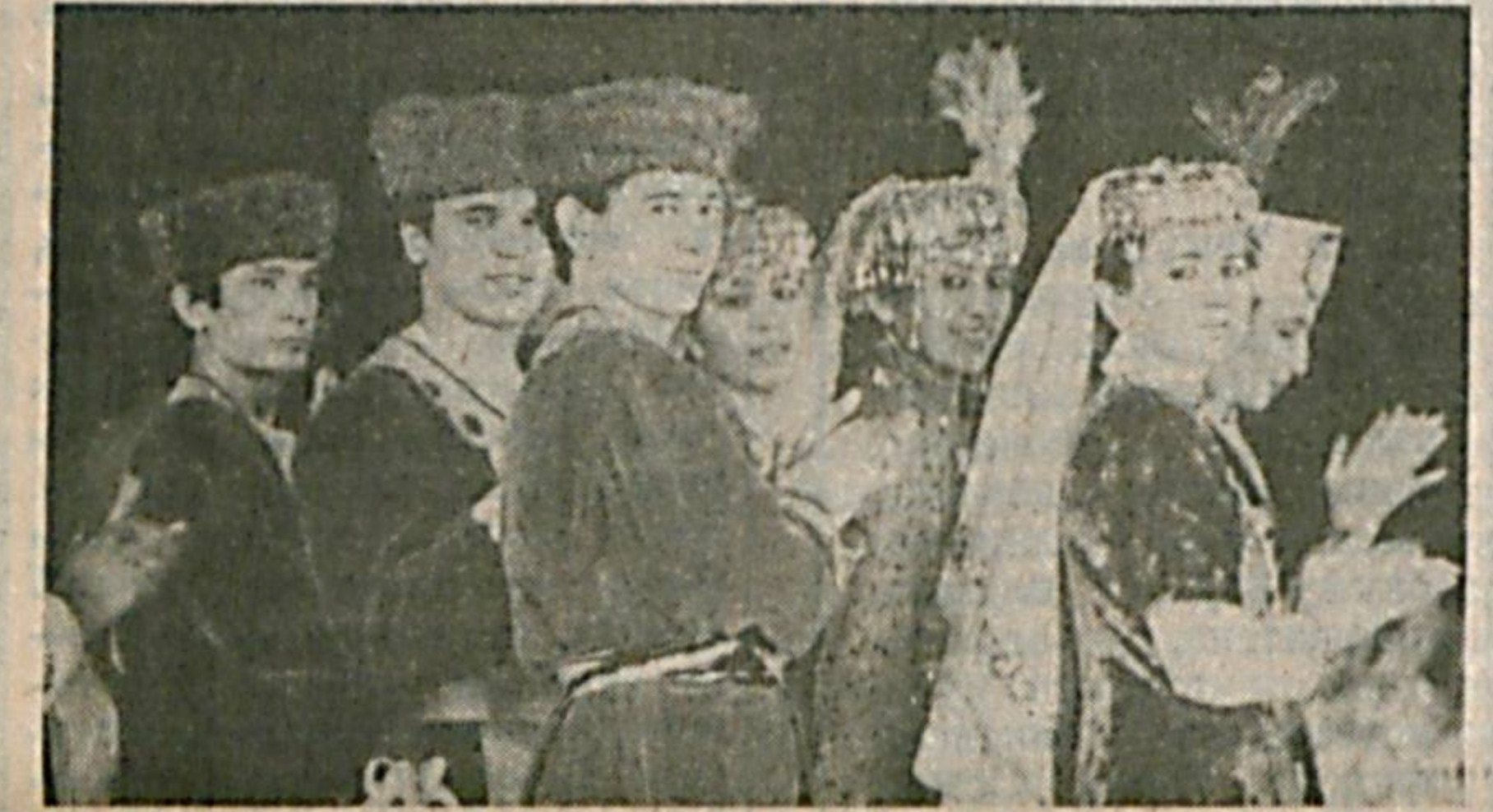
Музыка янграйди. Қўзлар қувнайди. «Қани, рақсга!» чорлайди йилгитлар.