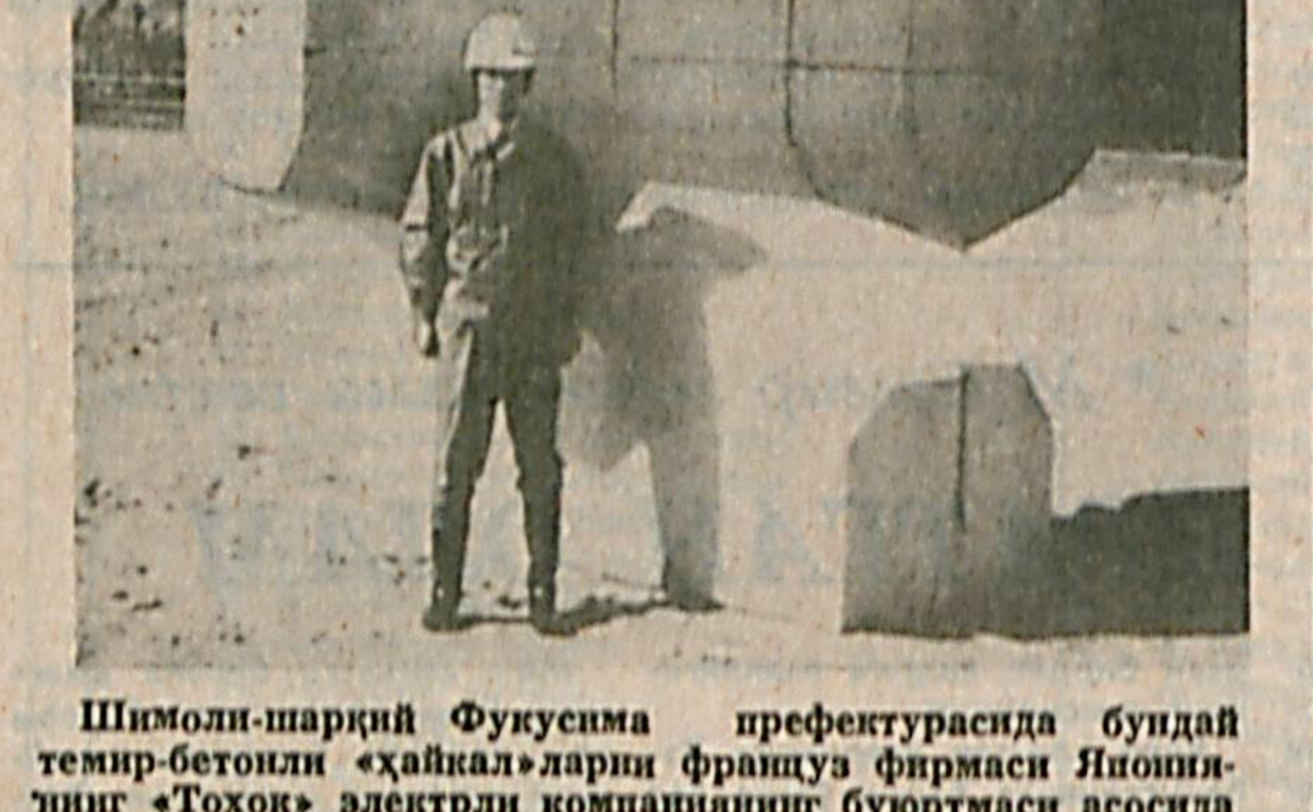
Шимоли-шарқий Фукусима префектурасида бундай темир-бетонли «Хайкал»ларни француз фирмаси Янониянинг «Тоқоқ» электрли компаниянинг бюротмаси асосида ясамоқда.

Энди фабрика ёшди. Ҳозир давлат олдида унинг 55 миллион кронди қарзи бор.