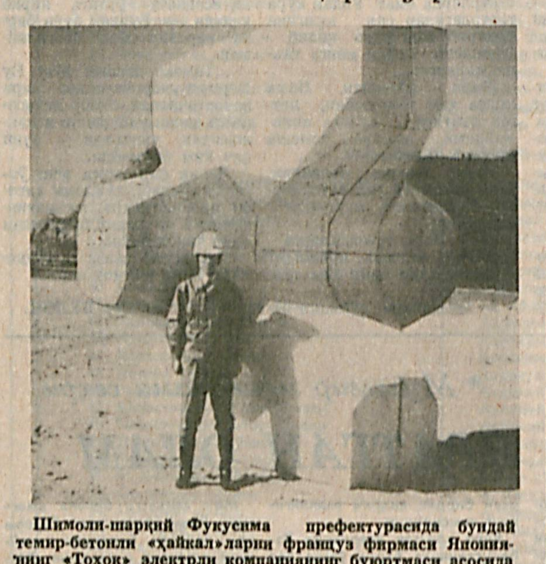
Шимоли-шарқий Фукусима префектурасида бундай темир-бетонли «Хайкал»ларни француз фирмаси Янониянинг «Тоқоқ» электрли компаниянинг бюротмаси асосида ясамоқда.

Ўзбекистон Республикаси Маданият ишлари вазирлиги М. Қорӣқубов номидаги Ўзбек давлат филармонияси «БАҲОР» КОНЦЕРТ ЗАЛИДА 23 ВА 25 СЕНТЯБРЬ СОАТ 18.00 ДА СИМФОНИЙ КОНЦЕРТЛАР МАВСУМИНИНГ ОЧИЛИШИ