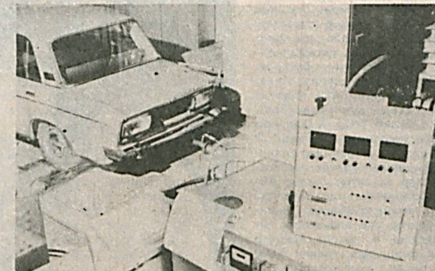
Кўпчилик автомашина тузатиш устаноларини аста-секин ривожланиш сари юз тутмоқда.