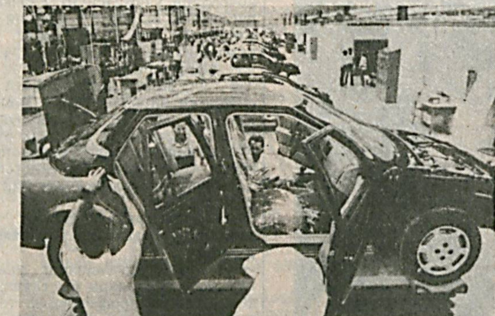
Американинг машҳур «Женерал Моторс» корпорацияси ишлаб чиқараётган «Сатурн» автомобили мана шундай тайёрланади. Ҳадемай, бизда ҳам шундай автозаводлар очилишига умид боғласа бўлади.