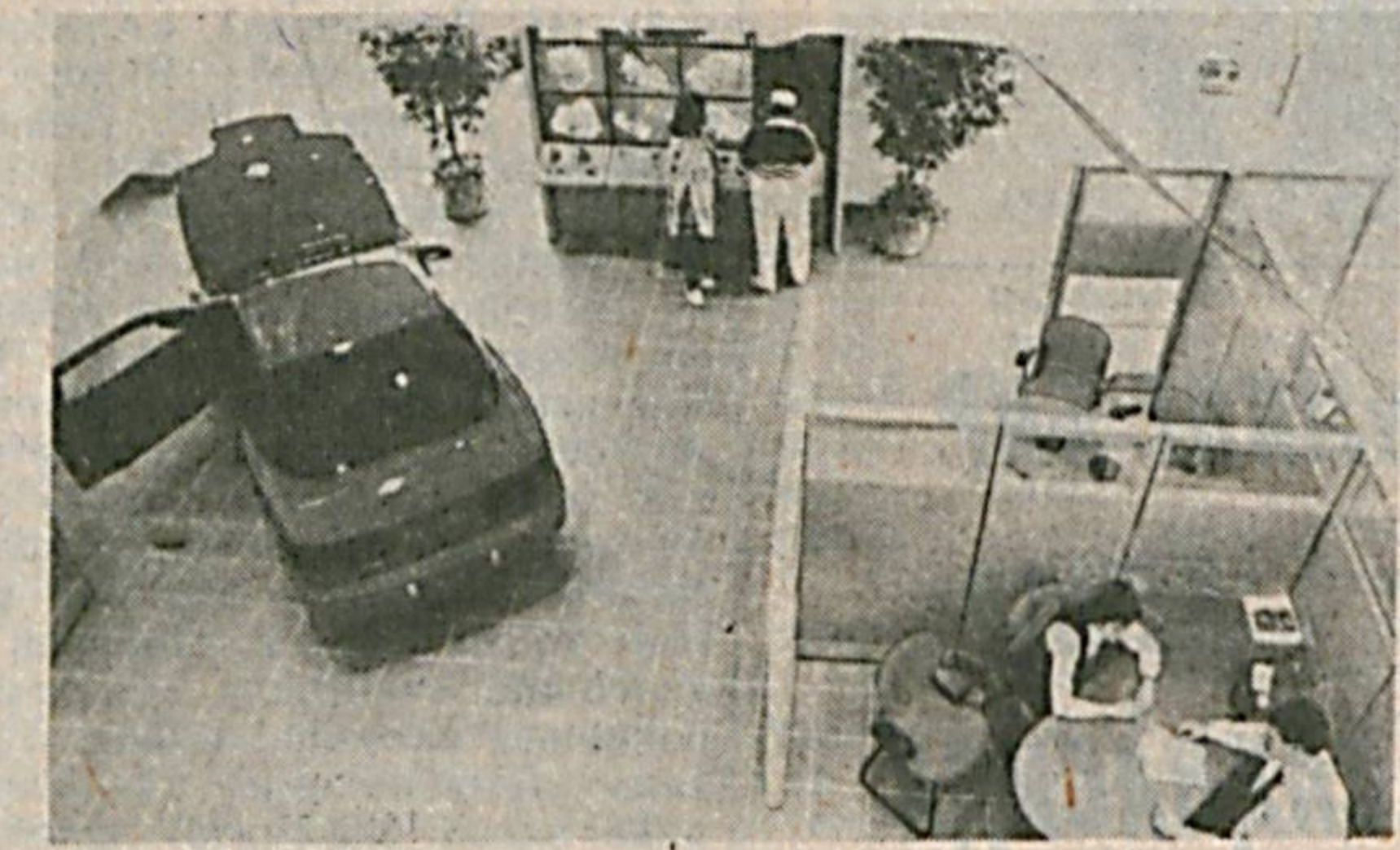
Автомобиль яратиш қийин, унинг савдодаги нархини аниқлаш эса ундан қийин. Машинаси тушмагур эрзон эмас-да!