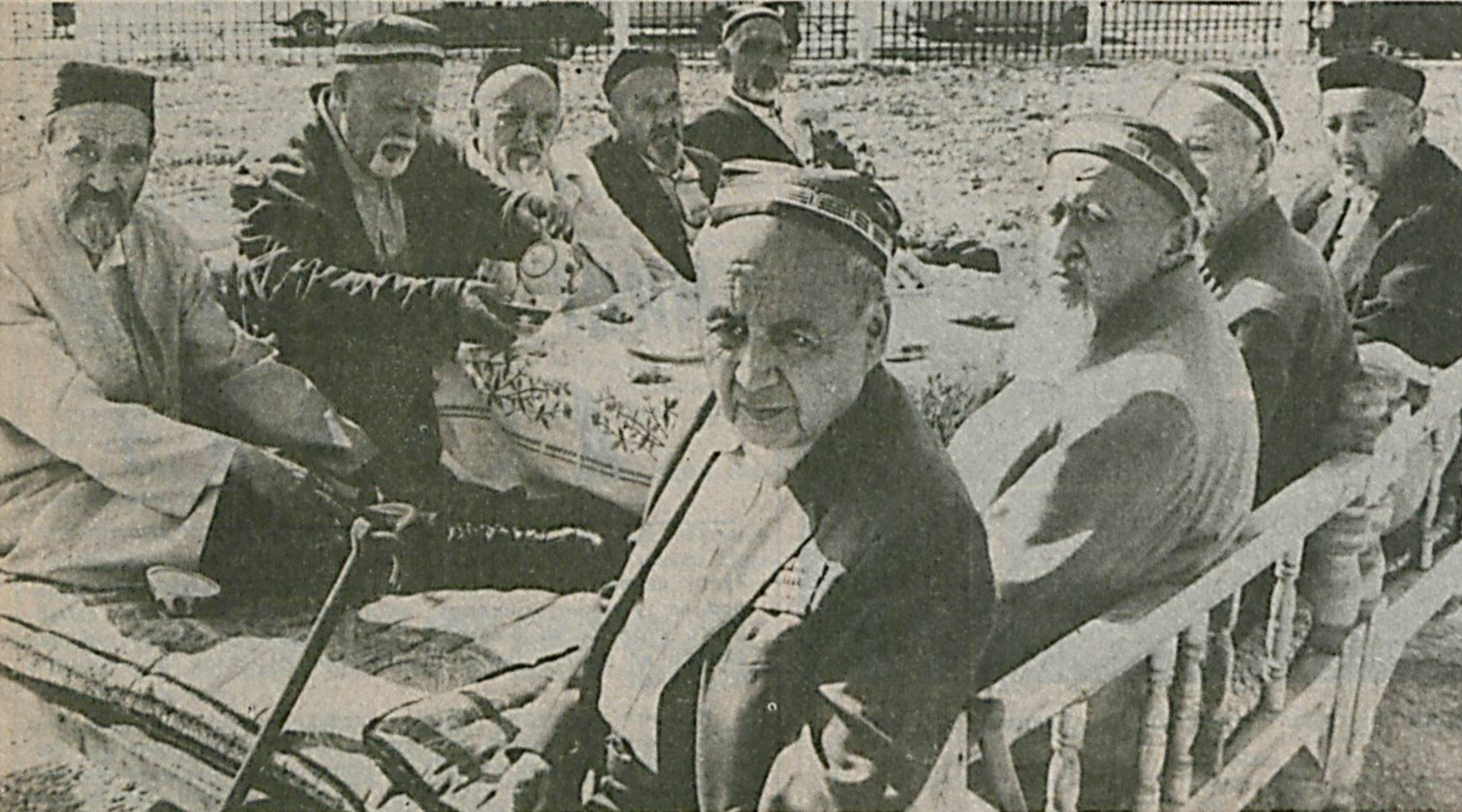
Оиламиз сарбони отахонлар умри боқий бўлсин.

ЎЗБЕКИСТОН Тилларда минг йиллар куй, дoston номинг, Тарихда юлдуздек Туркистон номинг, Мовароуннахр, гоҳида шер Турон номинг Муқаддас заминим, эй она юртин! Қиз, ўғлон кўксиди кўли, хурматда, Меҳмонга дастурхон ёсар албатта. Қиз-қизил ноиларинг латъдек саватда, Муқаддас заминим, эй она юртин!