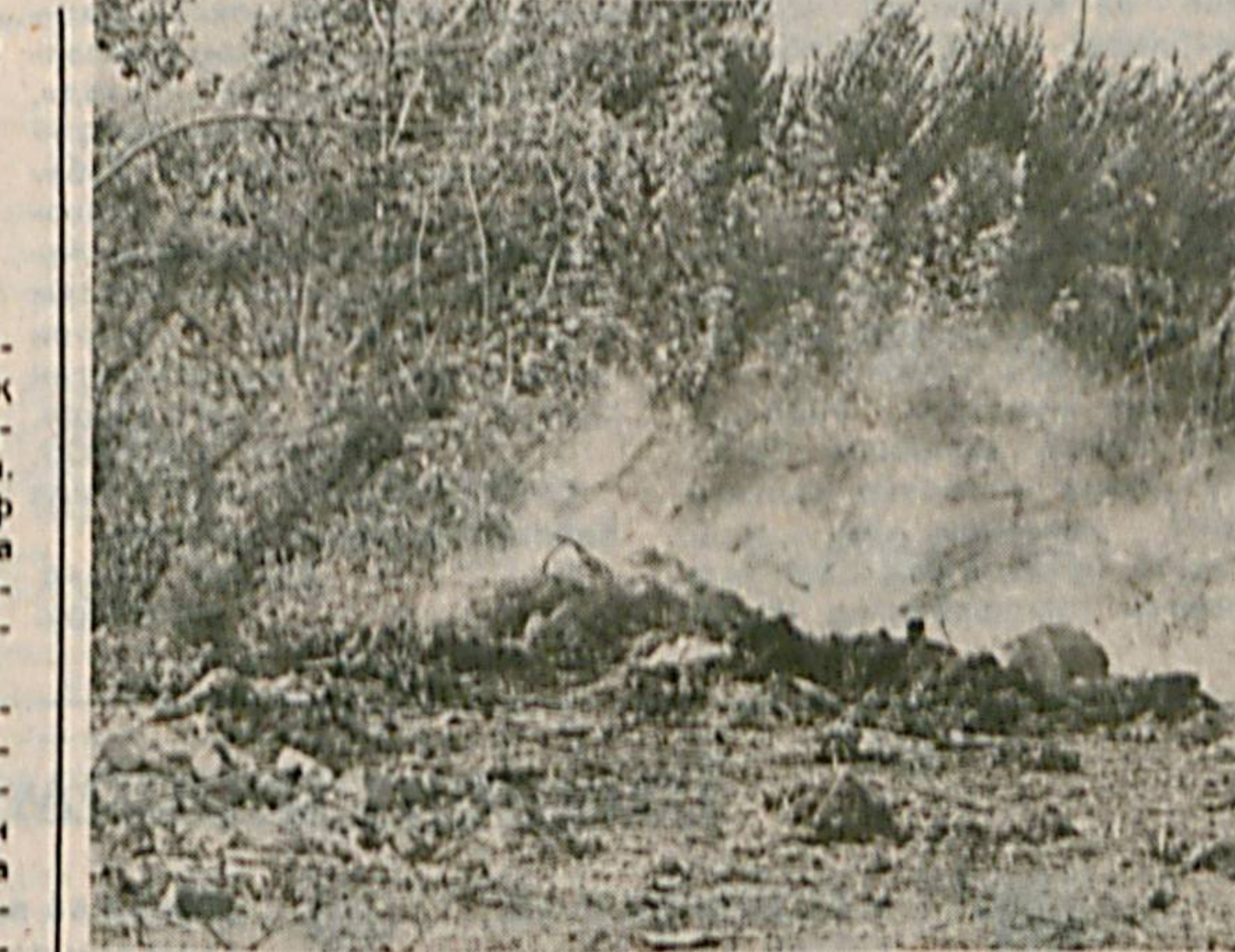
Кўм-кўк дарахлар билан уралган бу гўшада соф ҳаво таралиши ўринга ахлат ва ундаги ёнаётган латта-лутталарнинг аччиқ ҳиди димоққа урилиб кўнглини хира қилади.

Шудрингларнинг ҳам таркиби ўзгариб кетди, у болагинимиздаги нақ чўмилгудек жинжақ хўл бўлганимиздаги шудринг эмас — дейди украиналик сув қимбаси бўйича мутахассис, кимё фанлари доктори Наталья Мешкова-Клименко.