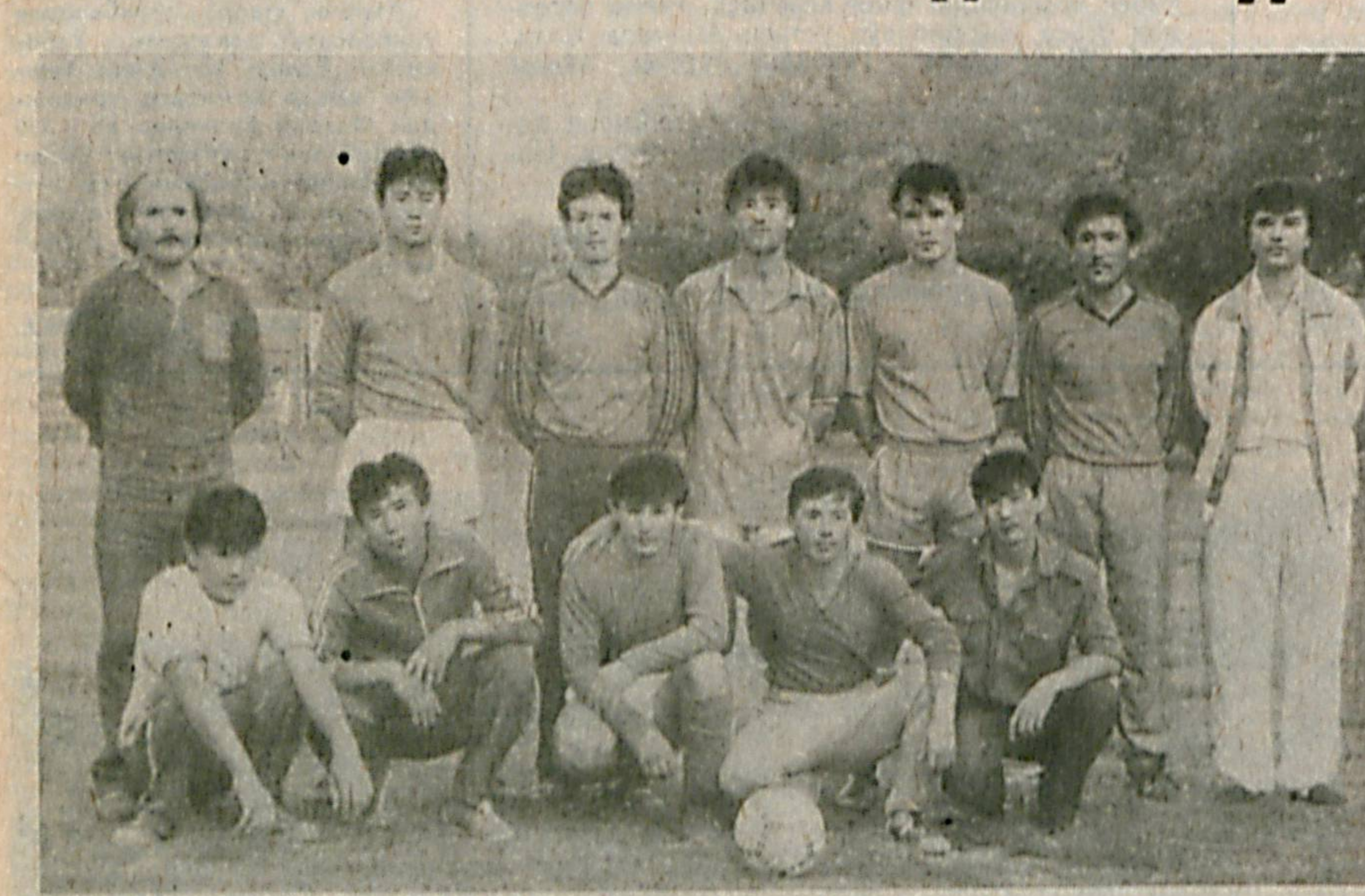
СУРАТДА: «Ташселимаш» терма жамоаси ўртоқлиги учрашуви олдидан.

Осоийшталлигимиз посбонлари бўлими милиция ходимларининг оғир ва маъсуляти ишларини ҳар қандай рағбатлантисрак ағрийдн. Зеро, уларнинг сизу бизнинг уйда ҳам, шу жойимизда ҳам хотиржам юришмишимиз таъминлашларининг ўзиниқ жуда катта савобга лойиқ. Милиция ходимларининг ижтимоий ҳимосини янада яхшилаш, район ички ишлар бошқармасининг моддий-техника таъминотини мустаҳкамлаш, ички ишлар органларида узоқ муддат хизмат қилган меҳнат фаришларига моддий ёрдам кўрсатиш яхшилаш, муниципал милиция ходимларини маълум таъминлаш ҳамда жинсийчиликка қарши курашнинг олдинги сафарларида хизмат қилётган ходимларнинг шарафли, аммо оғир меҳнатларини рағбатлантириш мақсадида Мирзо Улуғбек район ҳокимлиги ҳамда шу район ички ишлар бошқармаси чоғида фаолият кўрсатётган «Тартибот» ижтимоий жамоат фонди томонидан тайрли ишга кўл урмдди. Яъни, юқорида тилга олинган ташкилотлар ўзаро ҳамкорликда «Тартибот» деб номланувчи янги пул-буом лотереясини тайёрлади. Лотереяни чикариш учун сарфланмиш хусусида муҳбиримиз Мирзо Улуғбек район Ички ишлар бошқармаси бошлигининг шахсий тартиб билан ишлаш бўйича ўринбосари, тираж комиссиясининг аъзоси, милиция майори Этур Жўраев билан мулоқотда бўлди.