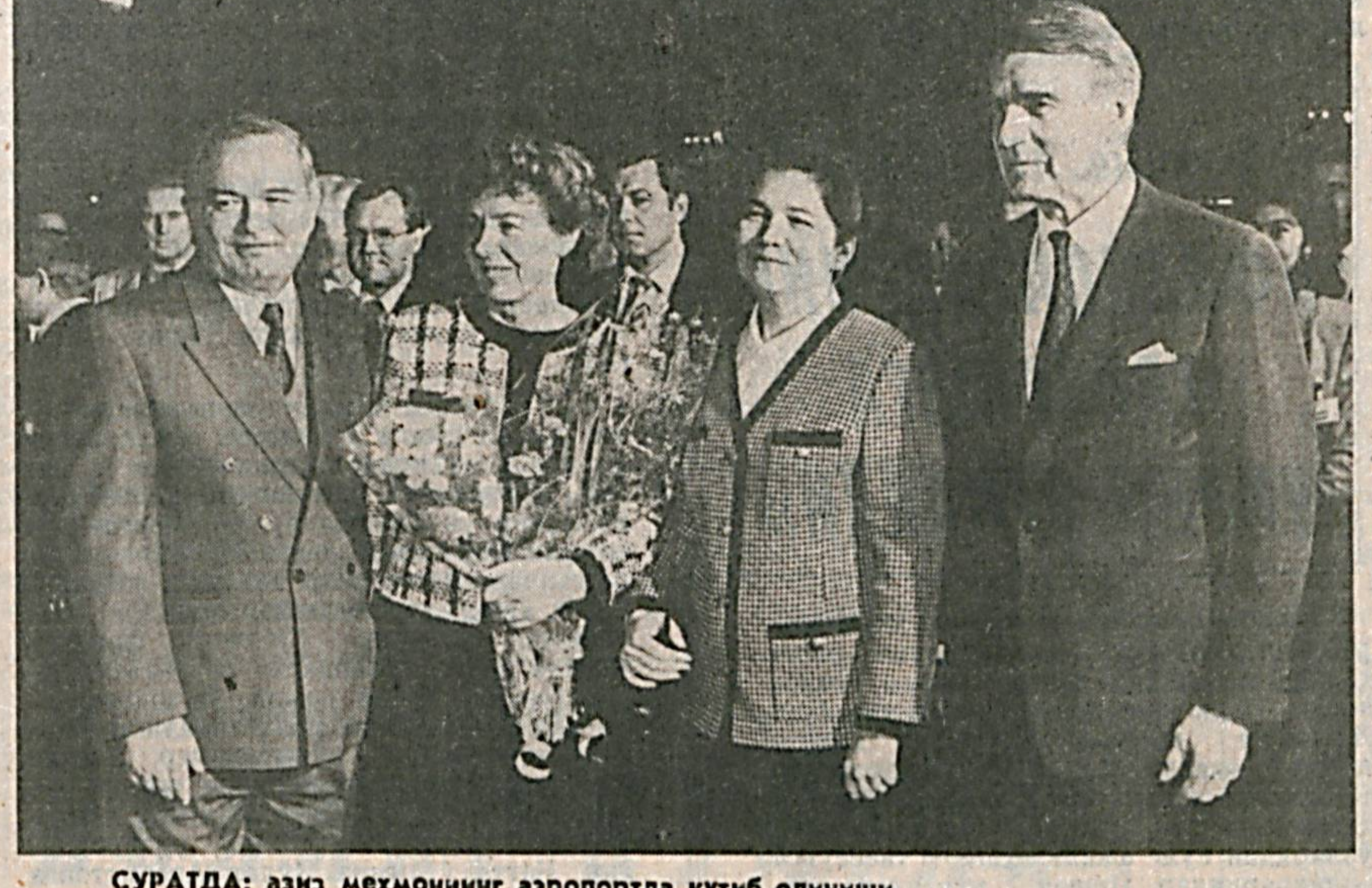
СУРАТДА: азио меҳмонининг аэропортда кутиб олинishi.

И. Каримов Ўзбекистонга илк марта расмий ташриф буюрган олий мартабали меҳмонини самимий қўллади ва халқаро сиебат майдонида катта обрўга эга бўлган давлат раҳбарининг мамлакатимизга ташриф буюриши муҳим аҳамиятга эга, деди. Унинг фикрича, Хельсинки шарида Ўзбекистон Республикаси имзо чеккан Европада хавфсизлик ва ҳамкорлик тўғрисидаги якуновчи ҳужжат Урта Осиё минтақасида тинчликни сақлаш ҳамда Европа мамлакатлари билан ҳар томонлама манфаатли алоқаларини йўлга қўйишда муҳим омил бўлади.