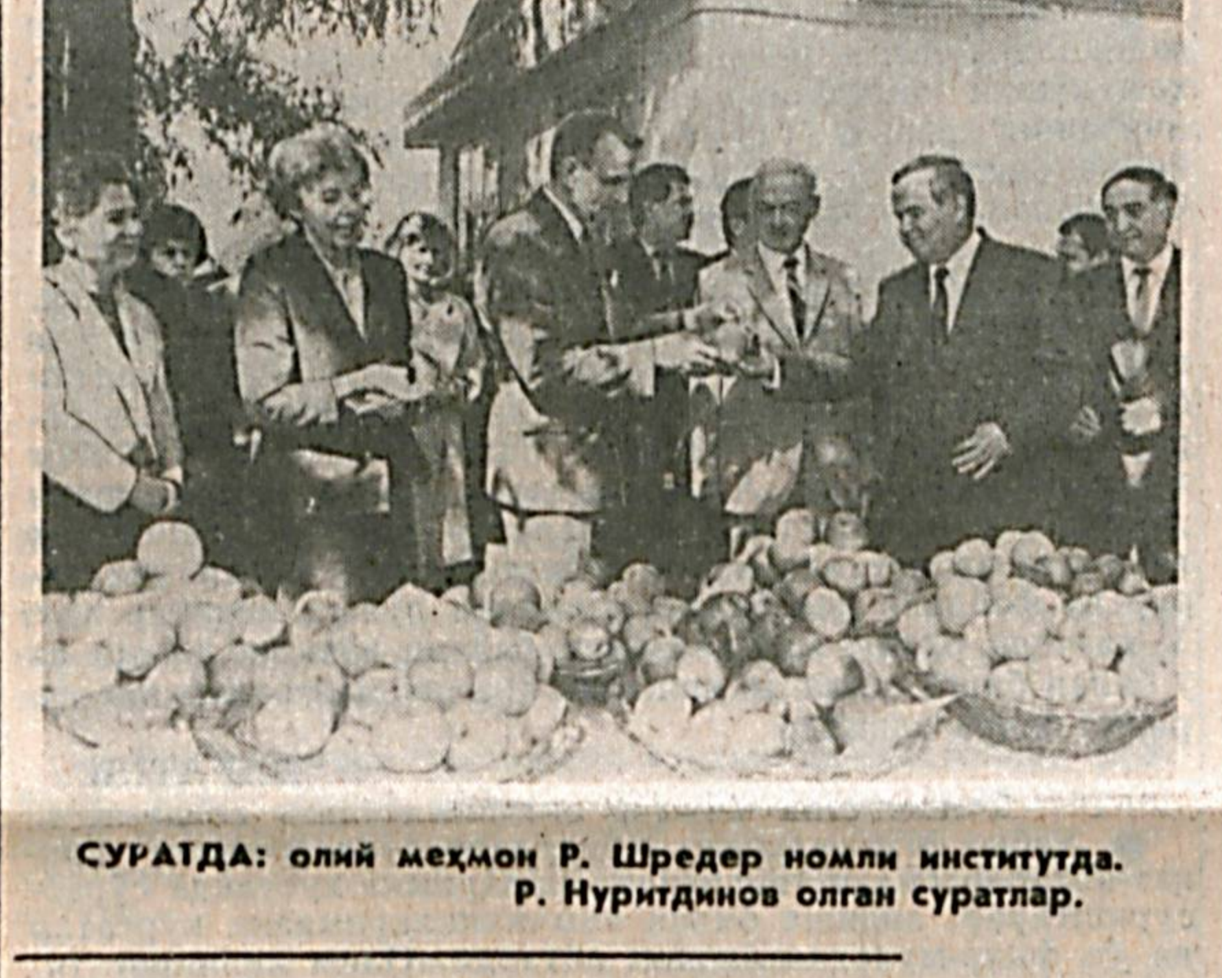
СУРАТДА: олий меҳмон Р. Шредер номли институтда.