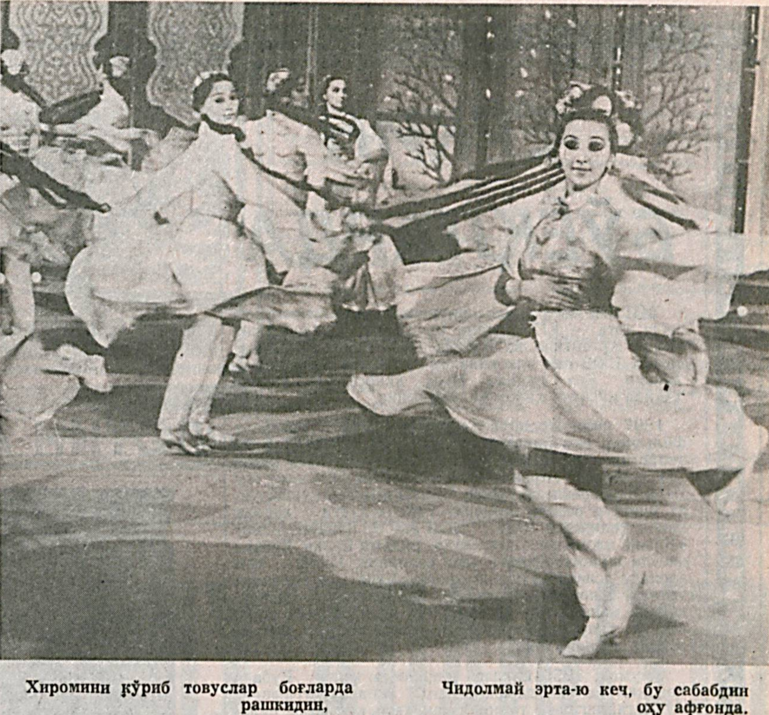
Хиромини кўриб товуслар боғларда рашидин,