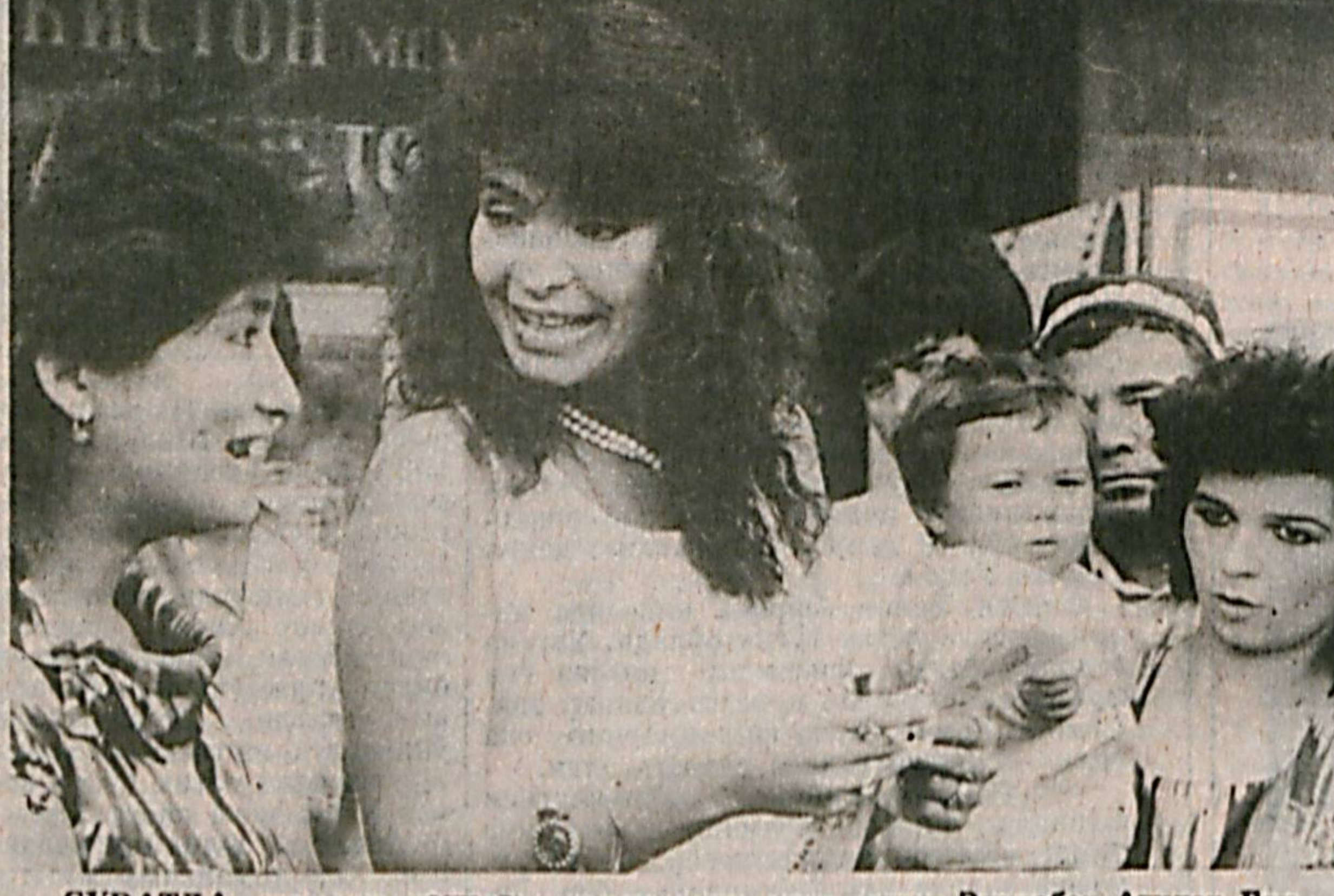
СУРАТДА: жаҳонга танилган мексикалик кино юлдузи Элизабет Агилар Гонсалес ўзбек мухлислари даърасида.