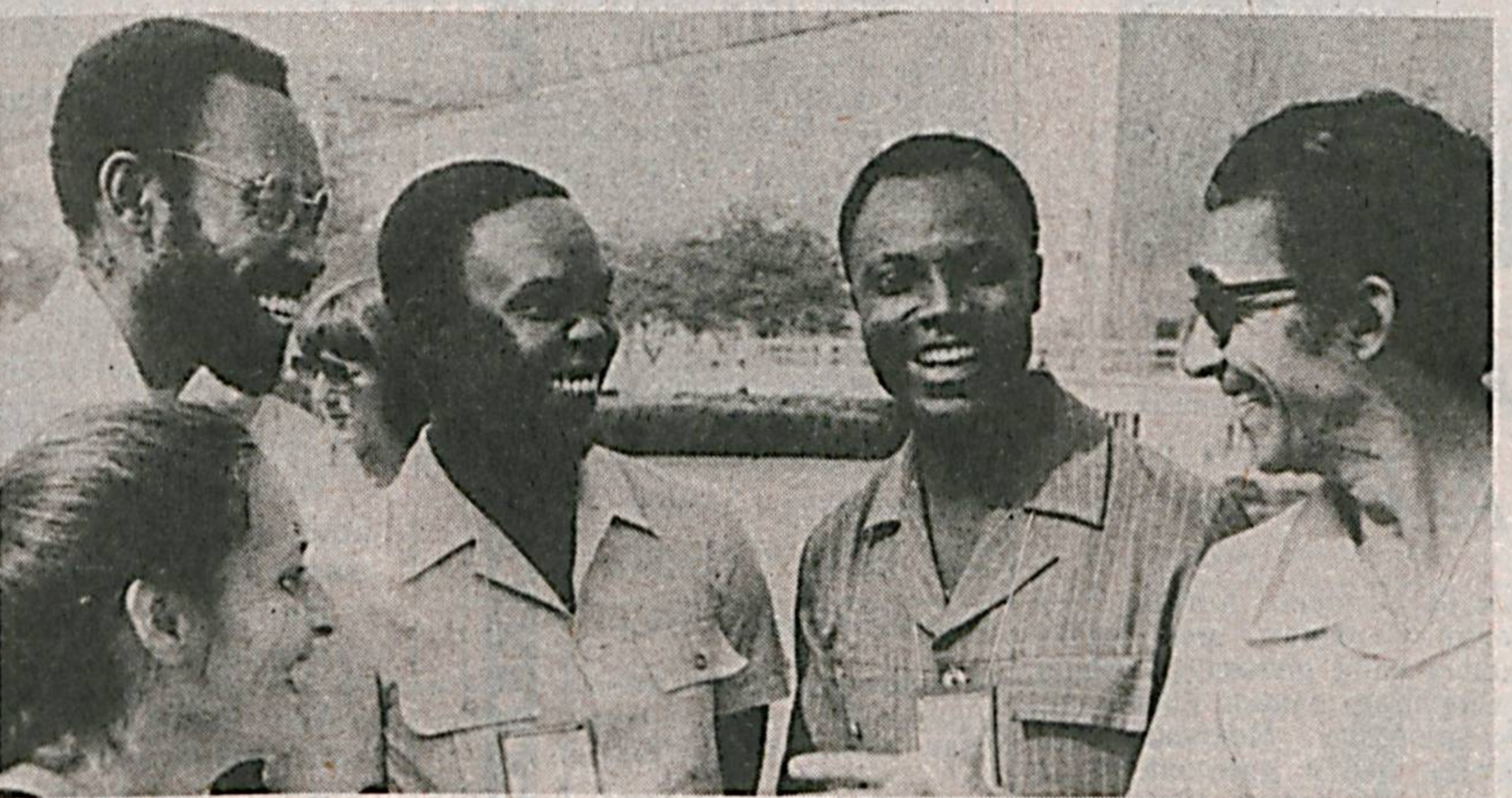
Африка қитъасида жойлашган давлатларда ҳам кино санъати тораб ривожланиб бормоқда.