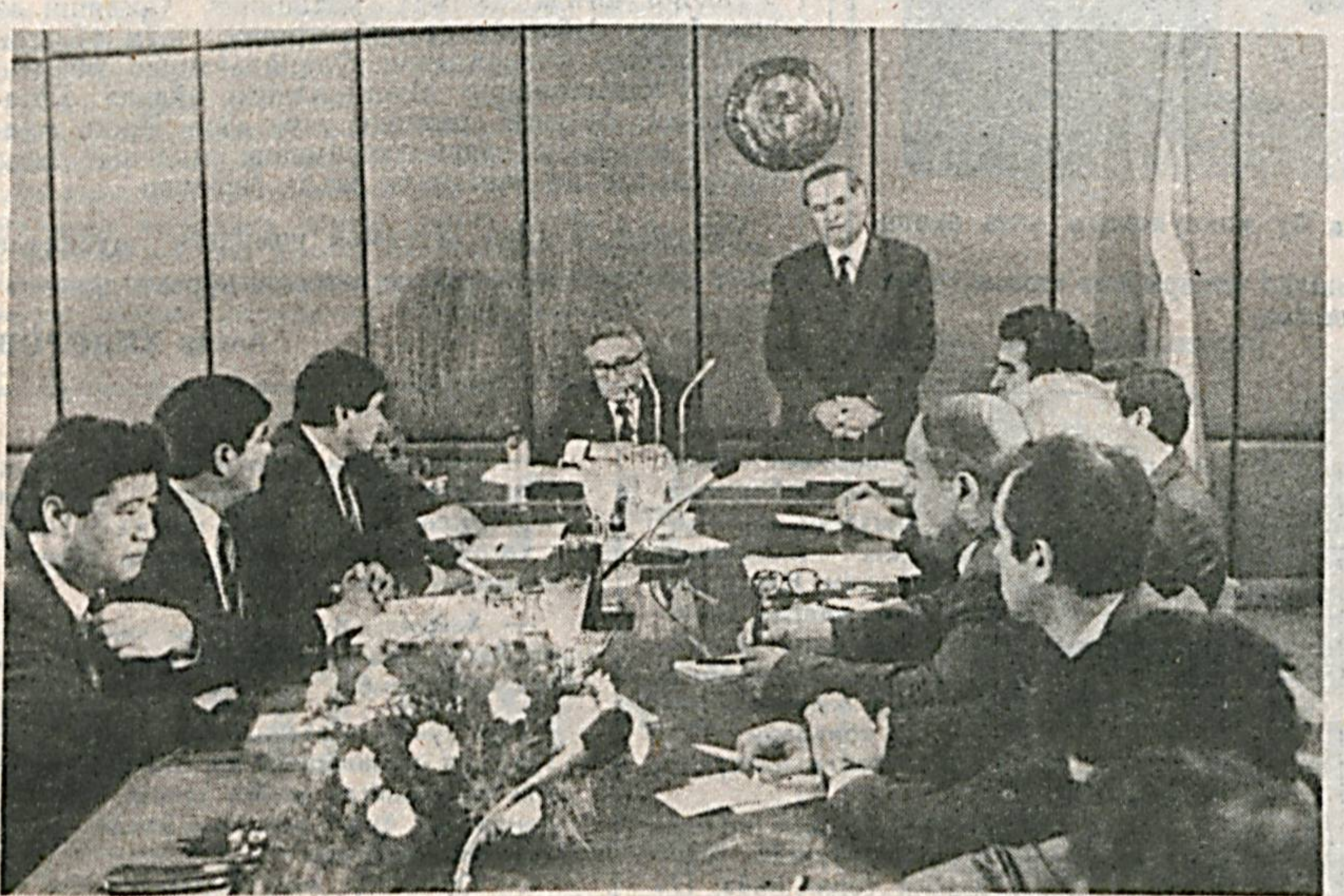
СУРАТДА: учрашув пайти.

Ўзбекистоннинг мустақилликка эришгани, ўлкада иқтисодий-сиёсий, иқтисодий ва бошқа соҳаларда ижодий ўзгаришлар рўй бераётгани, республиканинг Бирлашган Миллатлар Ташкилотига аъзо бўлгани, унинг обрў-эътибори ортиб бораётгани бутун дунёда қизиқиш уяғотмоқда.