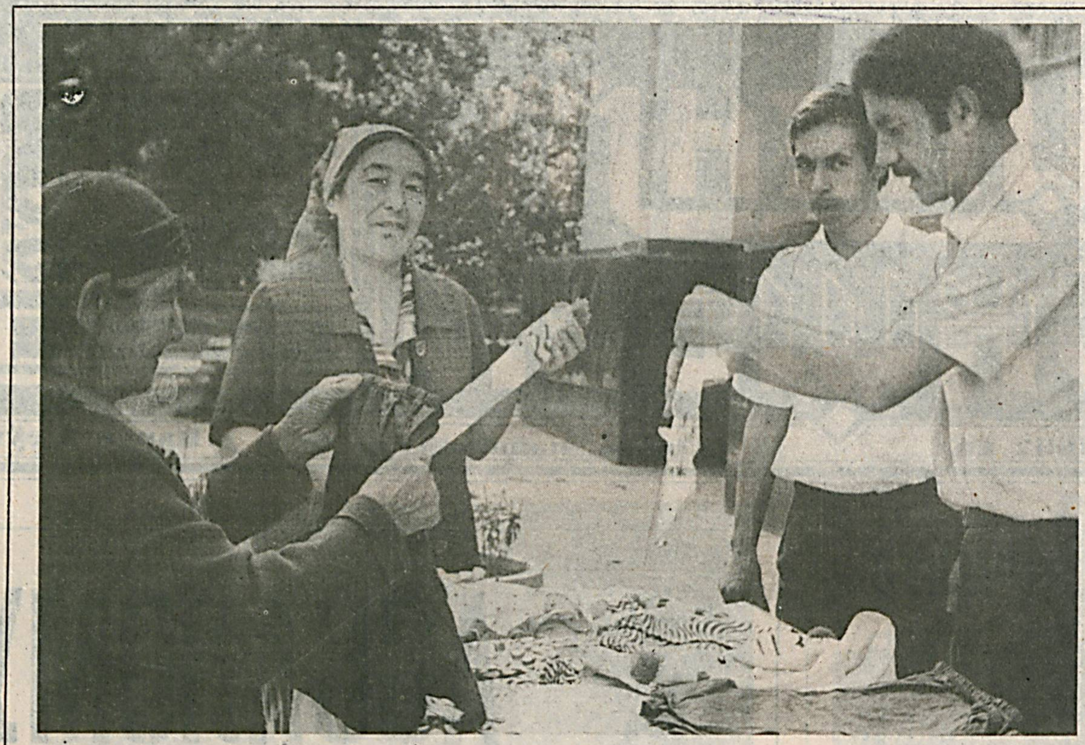
Мактаб ўқувчиларини ишга жалб қилиш мақсадида шахрининг Шайхонтоҳур районига 2-ўқув ишлаб чиқариш комбинати ташкил қилинган эди.

Бу йил қиш мавсумига картошка, пивэ етарли жамғарилдики! Утган йилдагидек бу маҳсулотлар мўл-кўл бўладими, тақиссиқ сезилмайдими? Мана шу саволлар ҳозир ҳаммамизни диққат-эътиборда турибди.