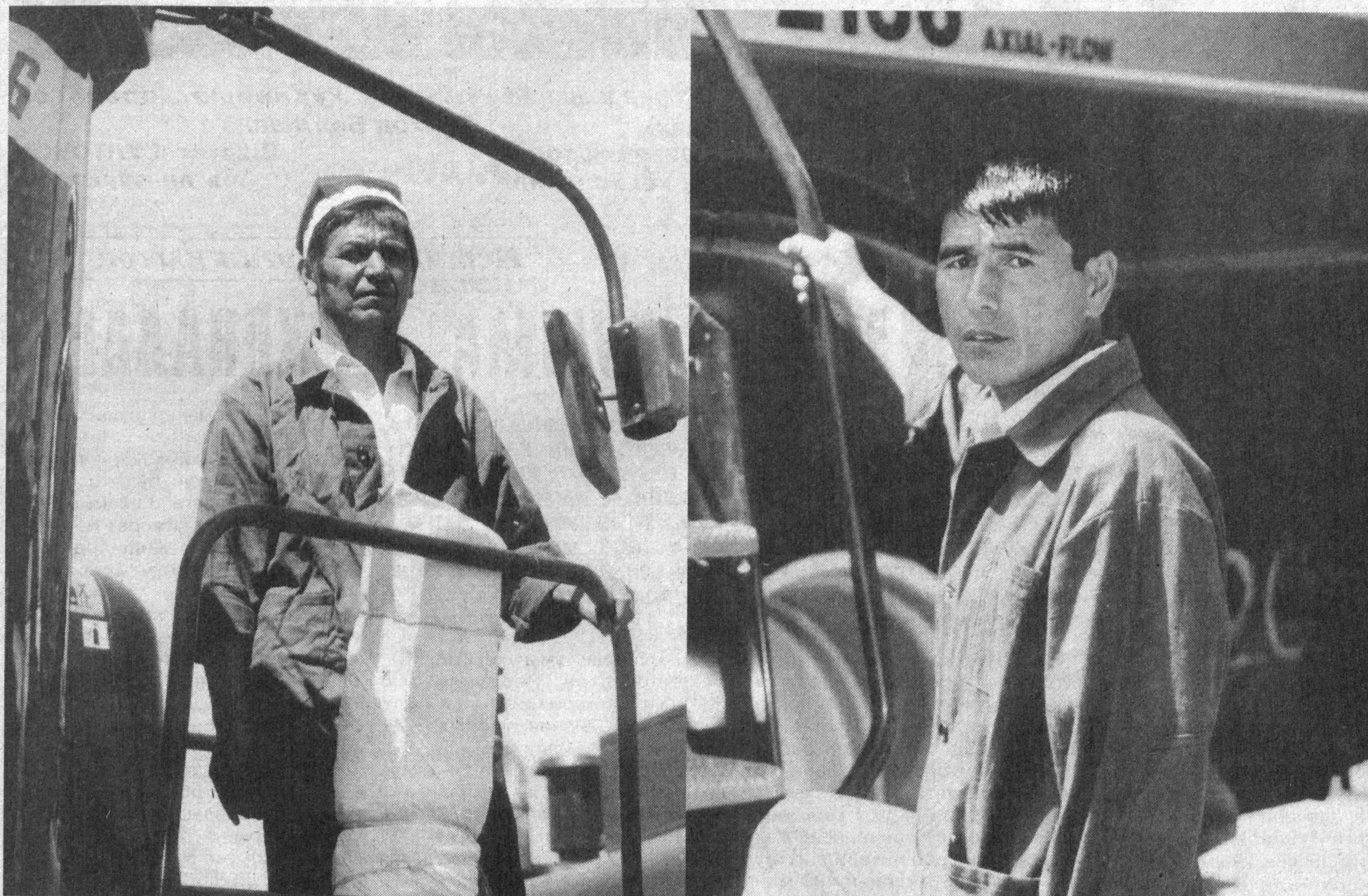
Асака тумани ғаллакорлари режа гектаридан 53 центнер бўлгани ҳолда ҳосилдорликни 85 центнерга етказиш учун астойдил

СЕШАНБА, ЧОРШАНБА, ЖУМА ВА ШАНБА КУНЛАРИ ЧИҚАДИ