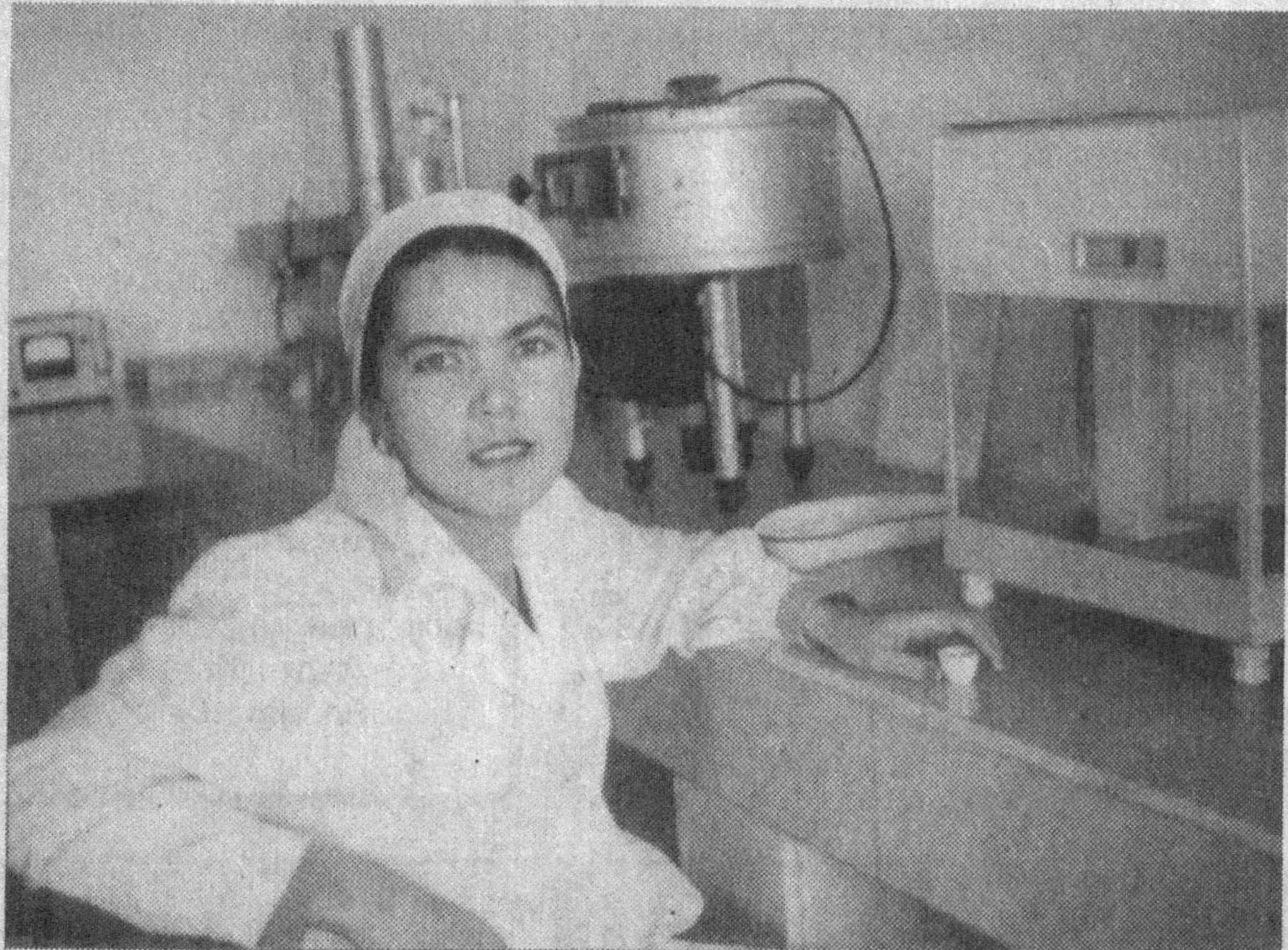
Яқинда чет эллик ишбилармонлар билан ҳамкорликда Шаҳрисабз шаҳрида донни қайта ишлайдиган «Шаҳри-Кеш» Ўзбекистон — Туркия қўшма