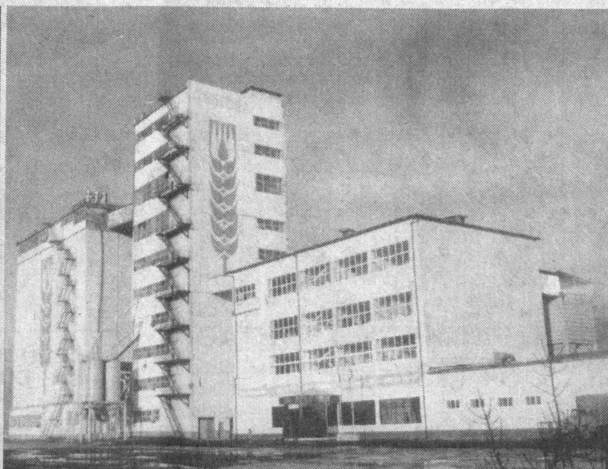
корхонаси фаолият кўрсата бошлади. Натижада бу ерда жаҳон андозалари талаблари даражасидаги маҳсулот ишлаб чиқарила бошланди.