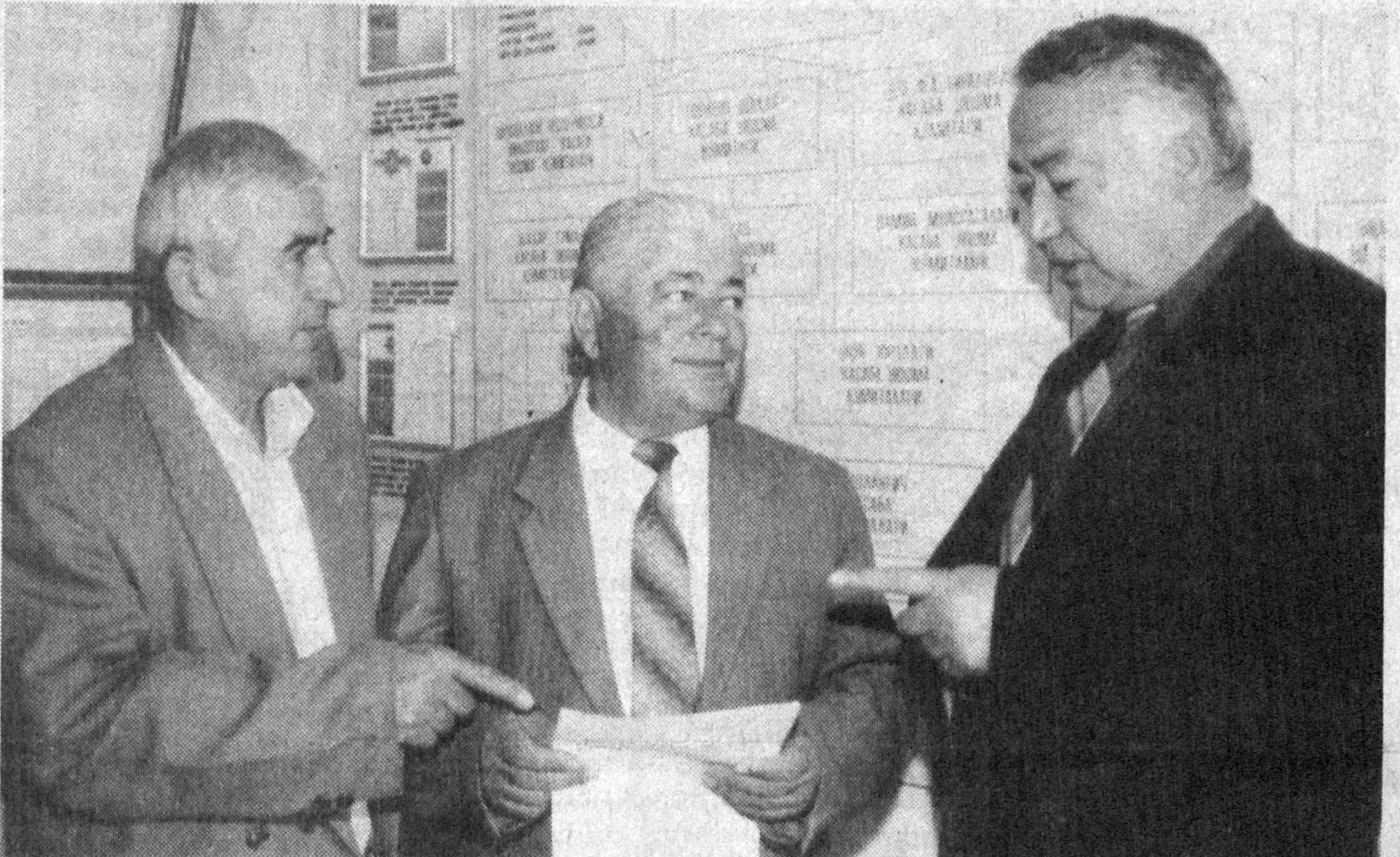
Сариосиё тумани таълим ва фан ходимлари касабаси уюшмаси жамоаси «Таълим тўғрисида»ги Қонун талабларидан келиб чиқиб, соҳада илоҳотларни изчил амалга оширишга алоҳида эътибор беришмоқда. Жумладан, мактабларни замон талабига мослаштиришга, компьютерлаштириш ва малакали ўқитувчиларни ижтимоий қўллаб-қувватлашда туман Халқ таълими бўлими билан ҳамкорликда иш олиб боришмоқда.

меъёрий ҳужжатларни ҳуқуқий экспертизадан ўтказмаслик. Ўзбекистон Республикасининг Меҳнат Кодексида жамоат шартномаси ходимнинг қонунда белгиланган ҳуқуқларини чеklangи, имтиёзларини пайсатириши мумкин эмаслиги таъкидланган. Афсуски, Иштихон туманидаги М.Жўраев номида ширкат хўжалигининг жамоат шартномасида «ишлаб чиқаришда ногирон бўлган ходимга 35 минг сўм, вафот этган ходим оиласига 175 минг сўм тўланади» деб, «Оҳалиқ-Ломанн-парранда» қўшма корхонасининг меъёрий ҳужжатида ишлаб чиқаришда ногирон бўлганларга энг кам иш ҳақининг бир йиллиги, вафот этган ходим оиласига энг кам иш ҳақининг 4 йиллиги тўлиниши ёзиб қўйилган. Ҳолбуки, амалдаги меҳнат қонунда бу тўловлар ходим ўртача ойлигининг мутаносиб равишда камида бир йиллиги ва камида олти йиллиги миқдорда бўлиши қатъий белгилаб қўйилган. Шунга ўхшаш