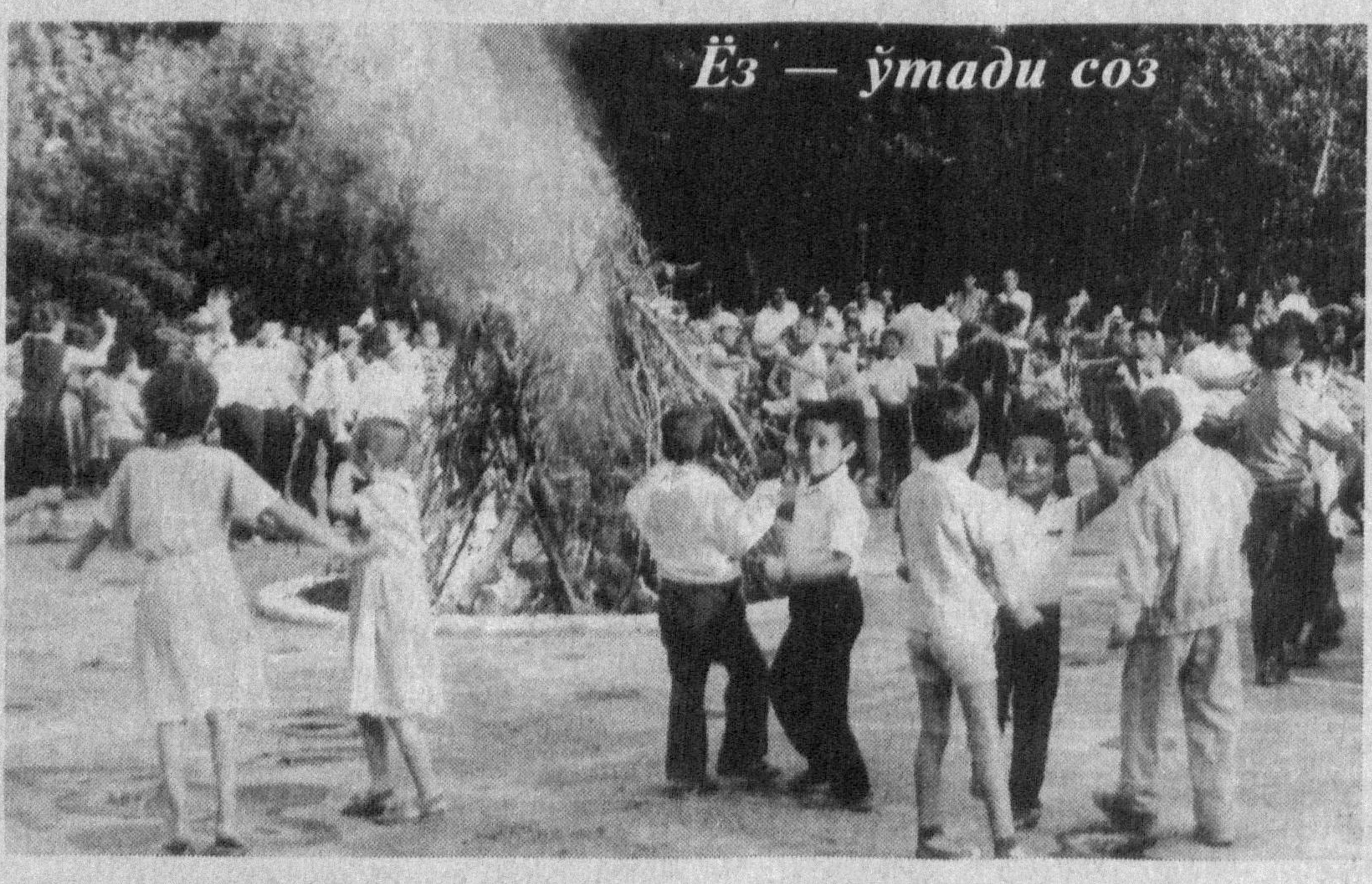
Ёз — ўтади соз