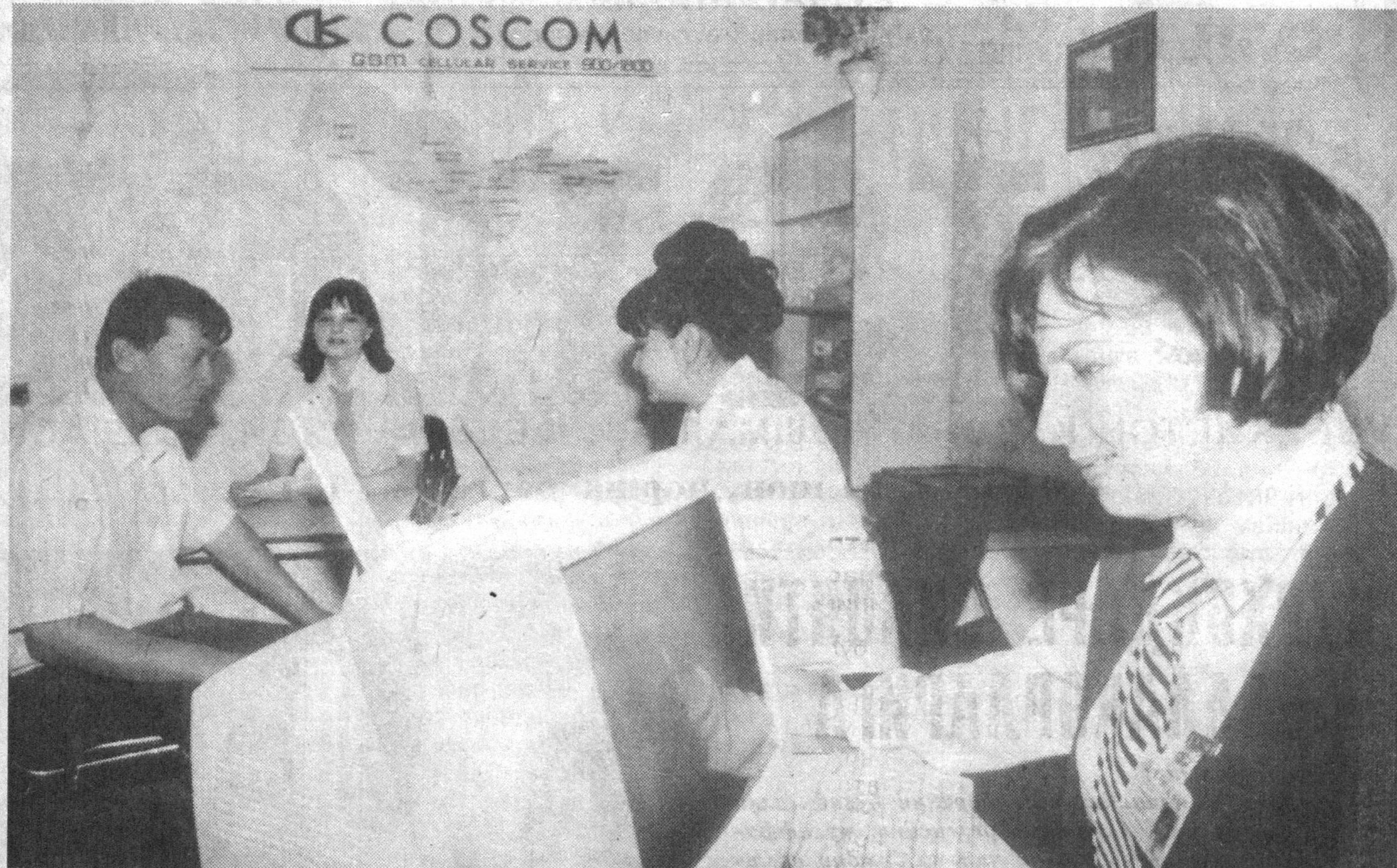
Суратда: операторлар за-лининг умумий кўриниши.

Аъзам ИСОҚОВ, Давлат муассасалари ва жамоат хизмати ходимлари Самарқанд вилоят қасаба уюшма қўмитаси раиси.