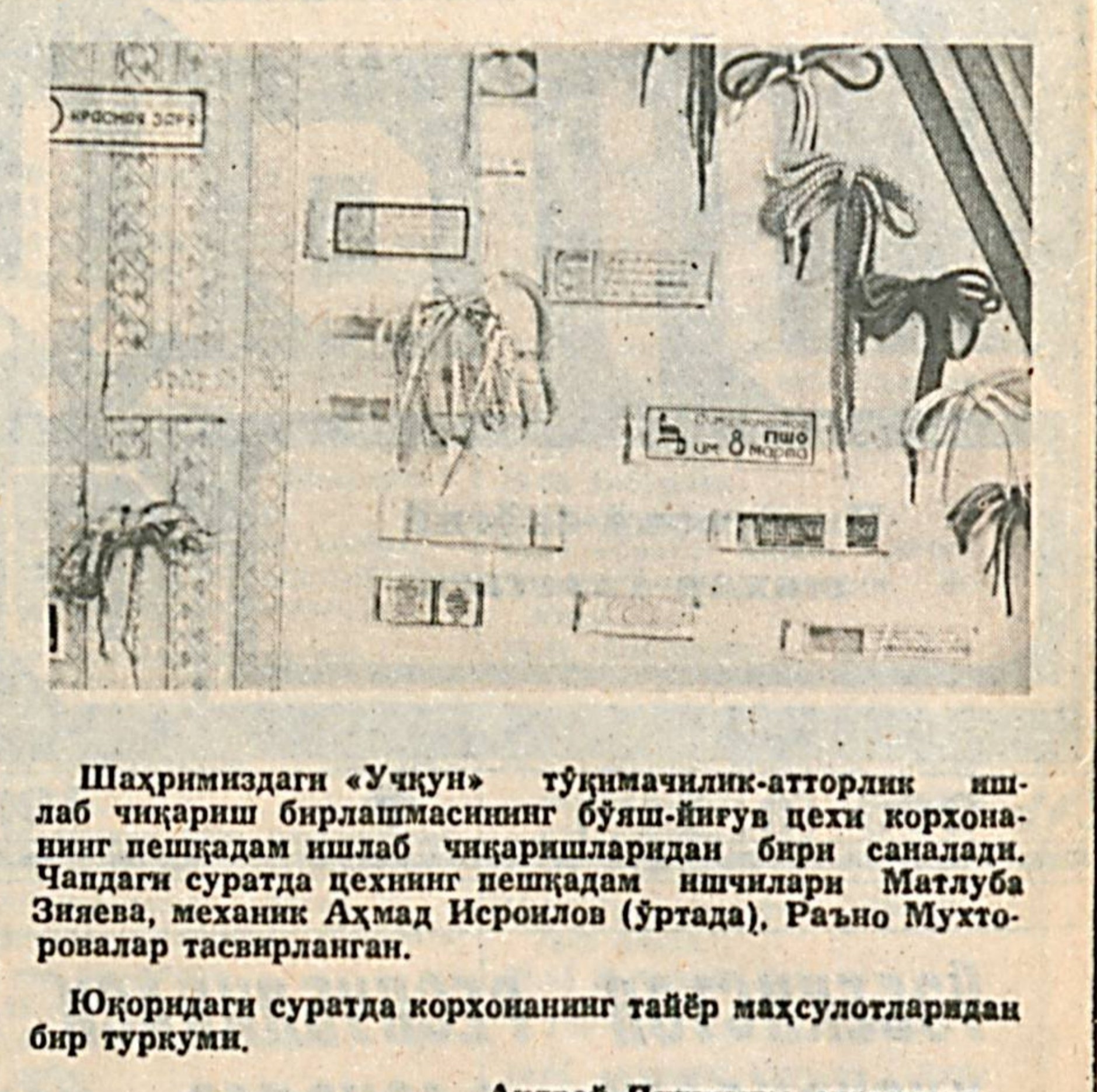
Шахримиздаги «Уқун» тўқимачилик-атторлиги ишлаб чиқариш бirlанишнинг бўша-йиғув цехи корхонанинг пешқадим ишлаб чиқаришларидаги бири саналади...