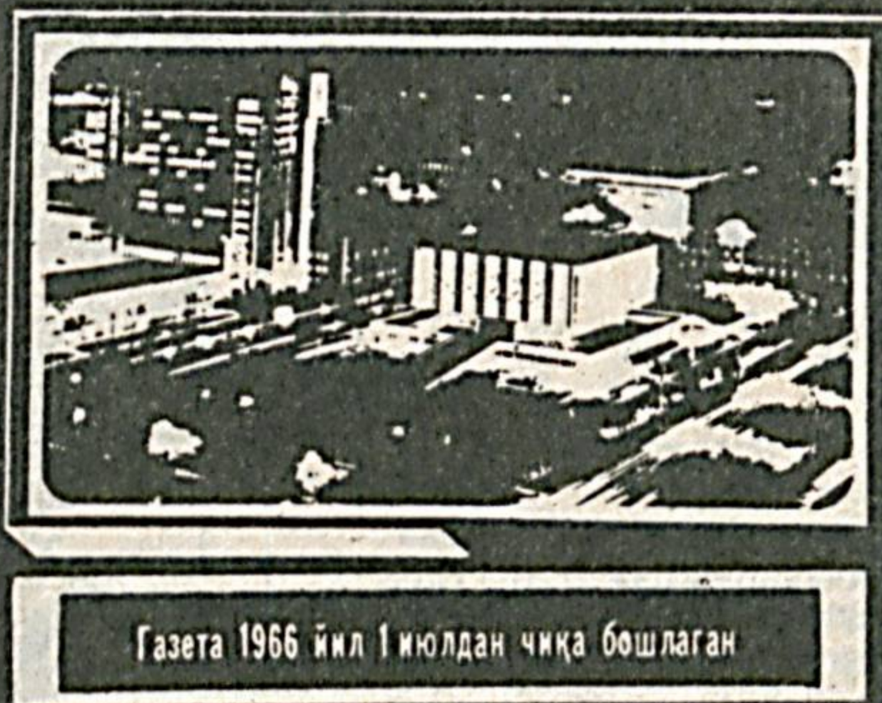
Газета 1966 йил 1 июлдан чиқа бошлаган

№ 205 (8. 147) 1992 йил 19 октябрь, душанба Нархи 2 сўм.