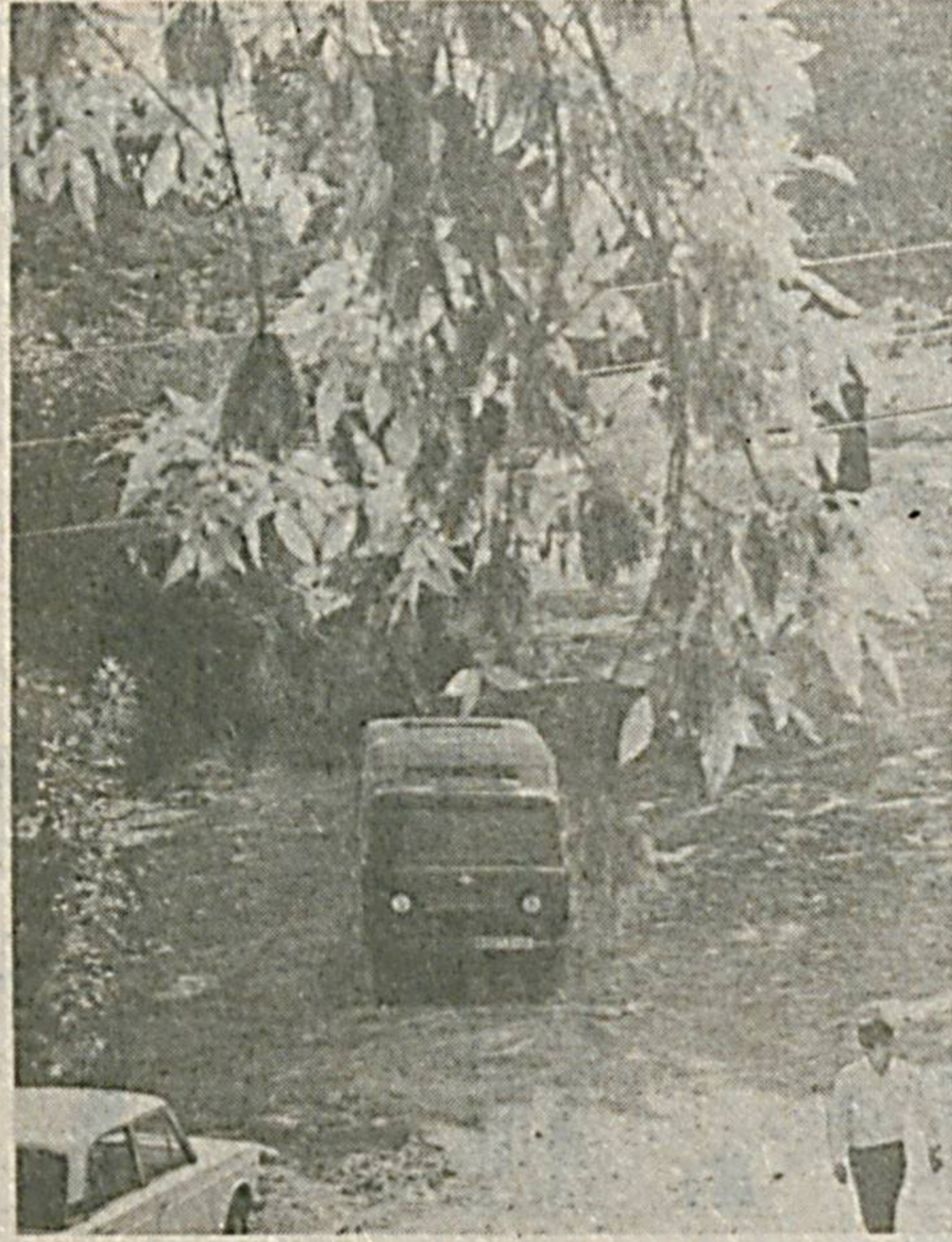
Ўзига жалб қилишини яхши билишадди.