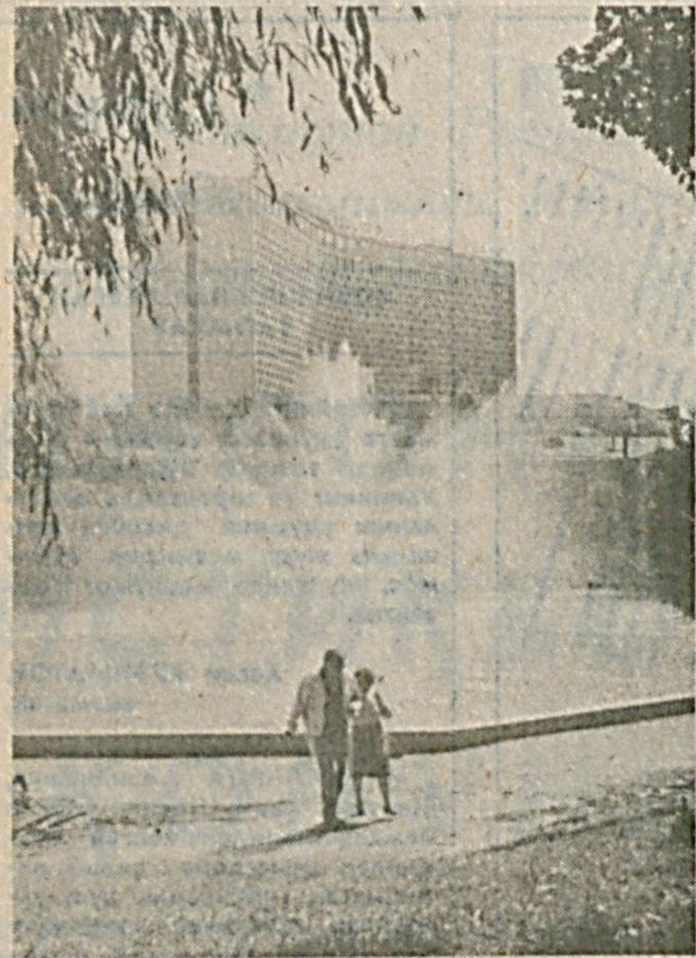
Пойтахтликлар ва Тошкент меҳмонлари шахримизнинг сўлим гўшалари ҳар фаслда ўз жозибаси, таровати билан киши эътиборини...