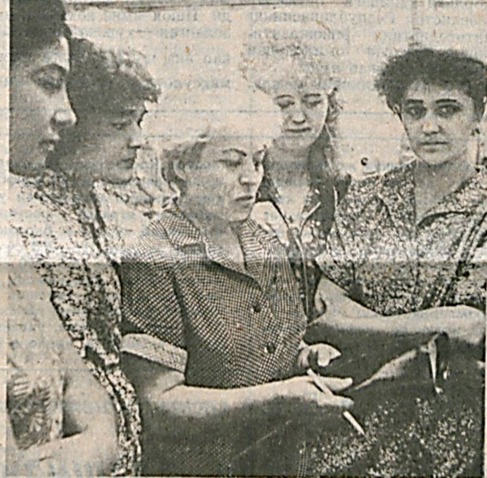
Илгарилари шахримиздаги 2-пайлабзал бирлашмаси ишлаб чиқарилган маҳсулотларининг асарияти сифатсиз чиқарди. Бу эса ўз навбатида харидорларнинг ҳақли эътирозларига сабаб бўлди. Ҳозир эса бунинг акси. Тўғри ҳозир ҳам ашёнинг сифатсизлиги туфайли корхонада провизор маҳсулотлар унраб тўради. Лекин корхонада тикилаётган оёқ кийимлар асосан замонавий ҳам