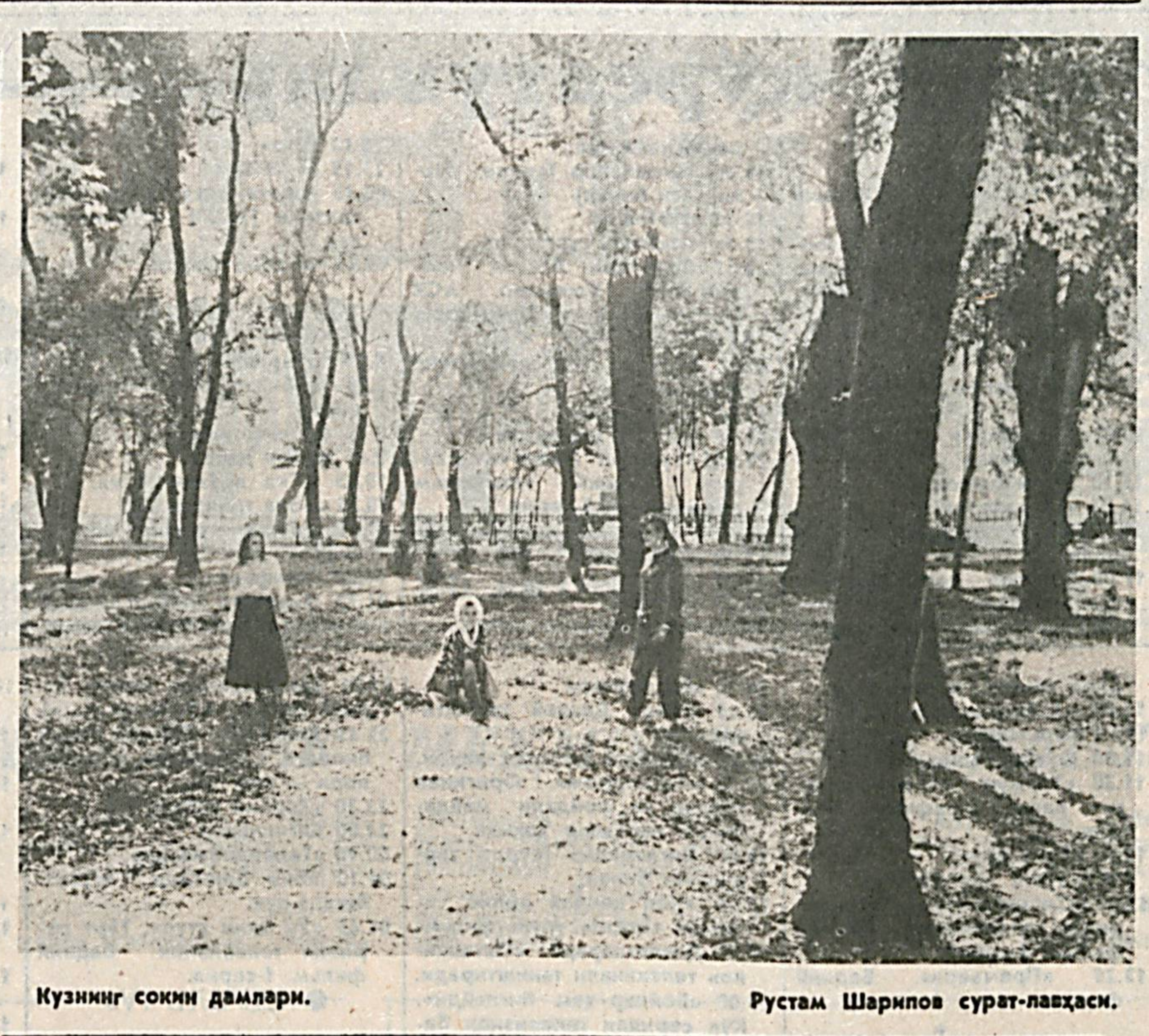
Кузнинг соғини давлари. Рустам Шарипов сурат-наъшаси.