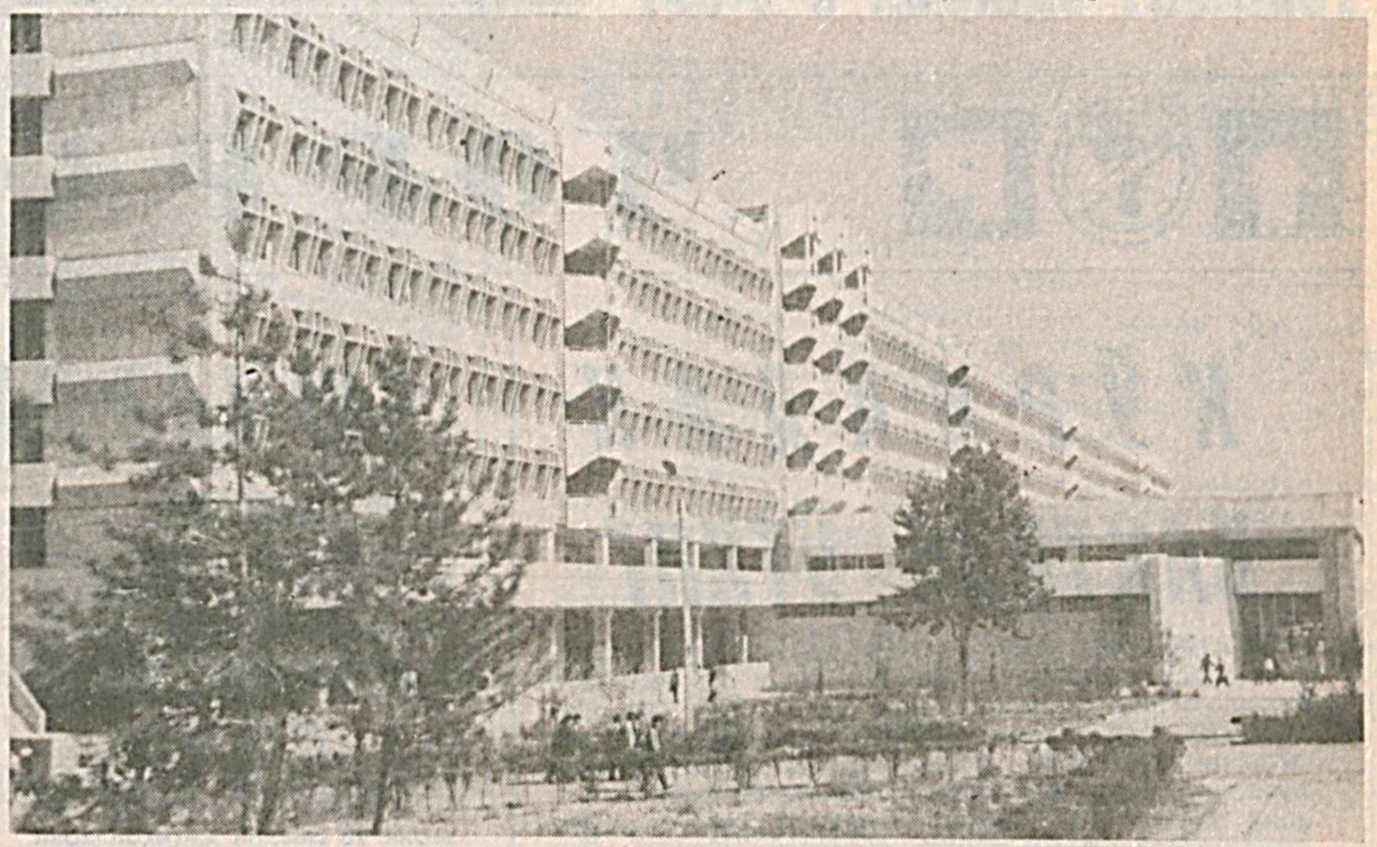
Тошкент Давлат техника университетининг янги ўқув биноси.

УРТА Осиё ва Қозоғистон театрларининг минтақаларо фестивалларини ташкил қилиш ҳақида ушбу олдидан қилиб режиссёрларнинг фикри бундан тўрт йил муқаддам Олмоте шайхиде бўлиб ўтган мажлисда тасдиқланган эди.