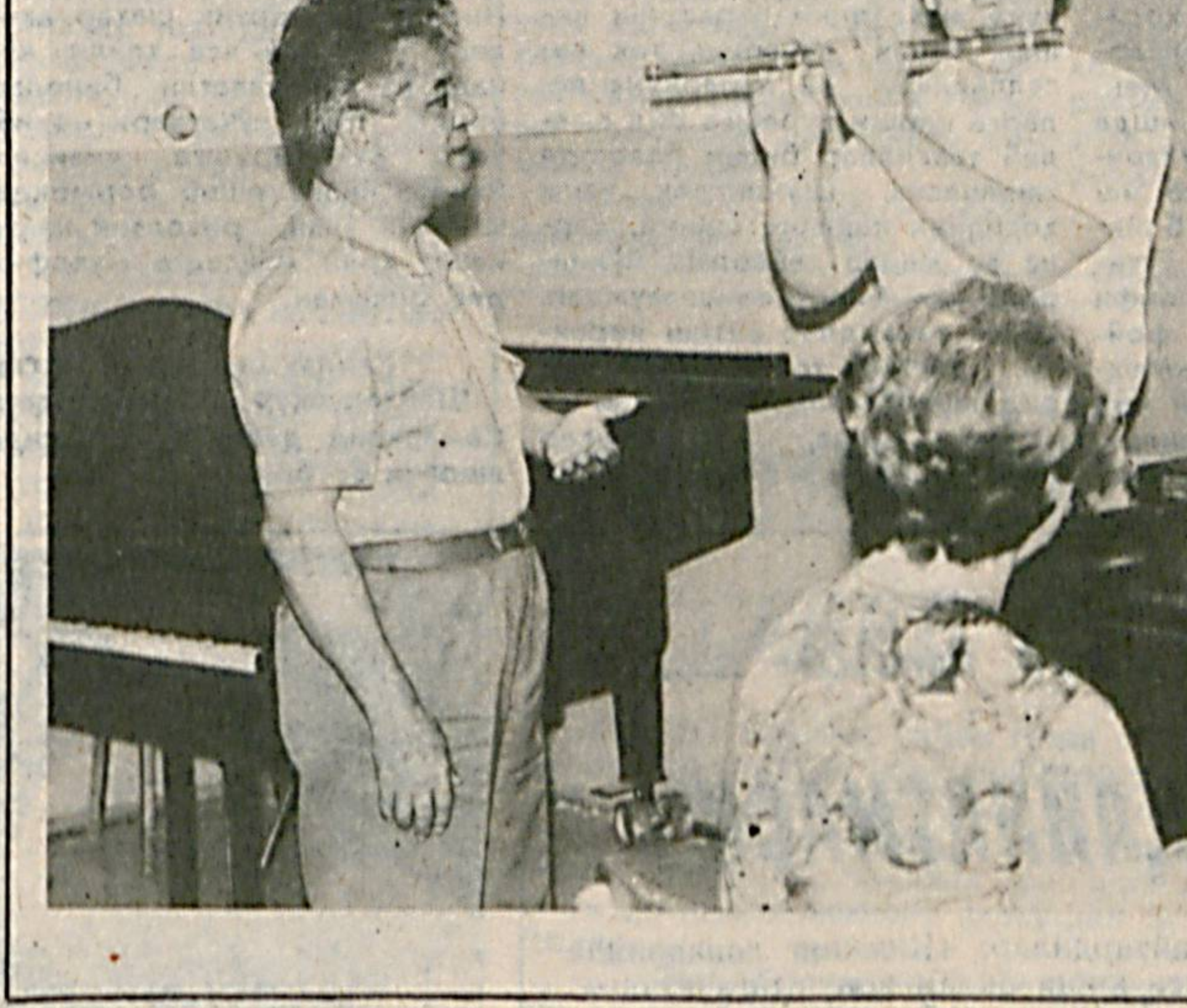
ИСТИҚБОЛГА КАТТА УМИД

— Мирза ака, одатда дарваларда «Бир мазза қилиб қўшиқ айтилган», — деган норабор Кулолининг қалинида, Аммо, мундариб най навосдан тингмайинизми, — деганларнинг ҳеч эсломайман.