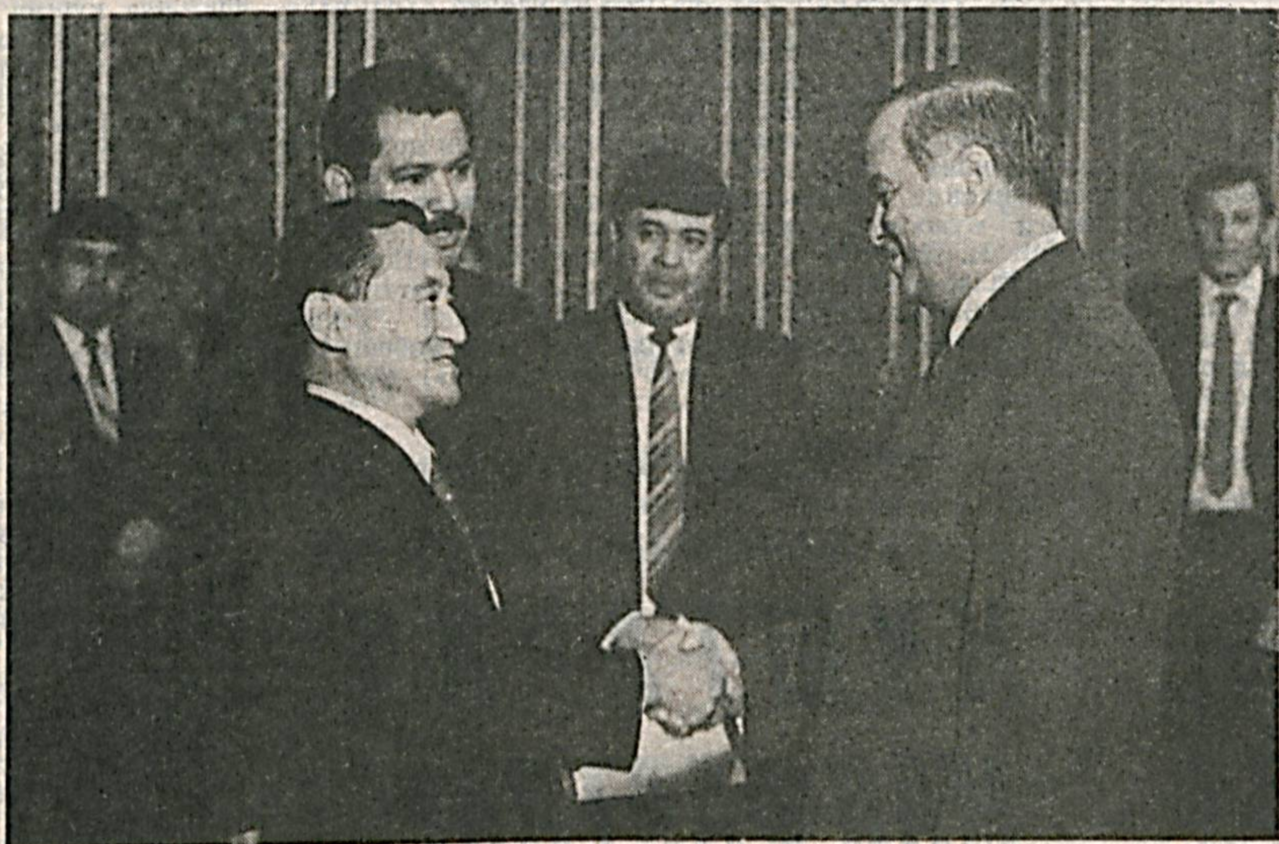
СУРАТДА: учрашув пайти.

Мамлакатимиз Президентини Ислам Каримов 26 октябрь кунини Япония молия вазирининг халқаро ишлар бўйича муовини Тадао Чинони қабул қилди.