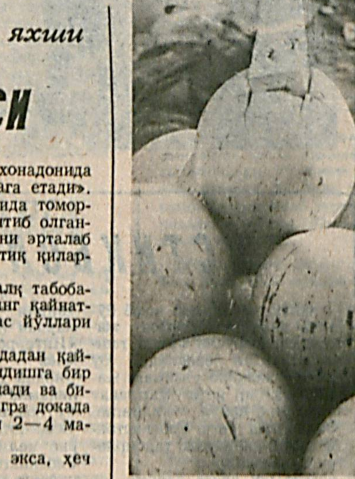
Олтин куз келди. Ползаларда тарвузлар, қовунлар, тар мевалар, фарқ пилган палла. Фақатгина тилларанг

РАҲМАТЛИ ОУВИМ айтардилар: «Кимнинг хонадонига бир тул нон жийда бўлса қиши билан нонуштага етади».