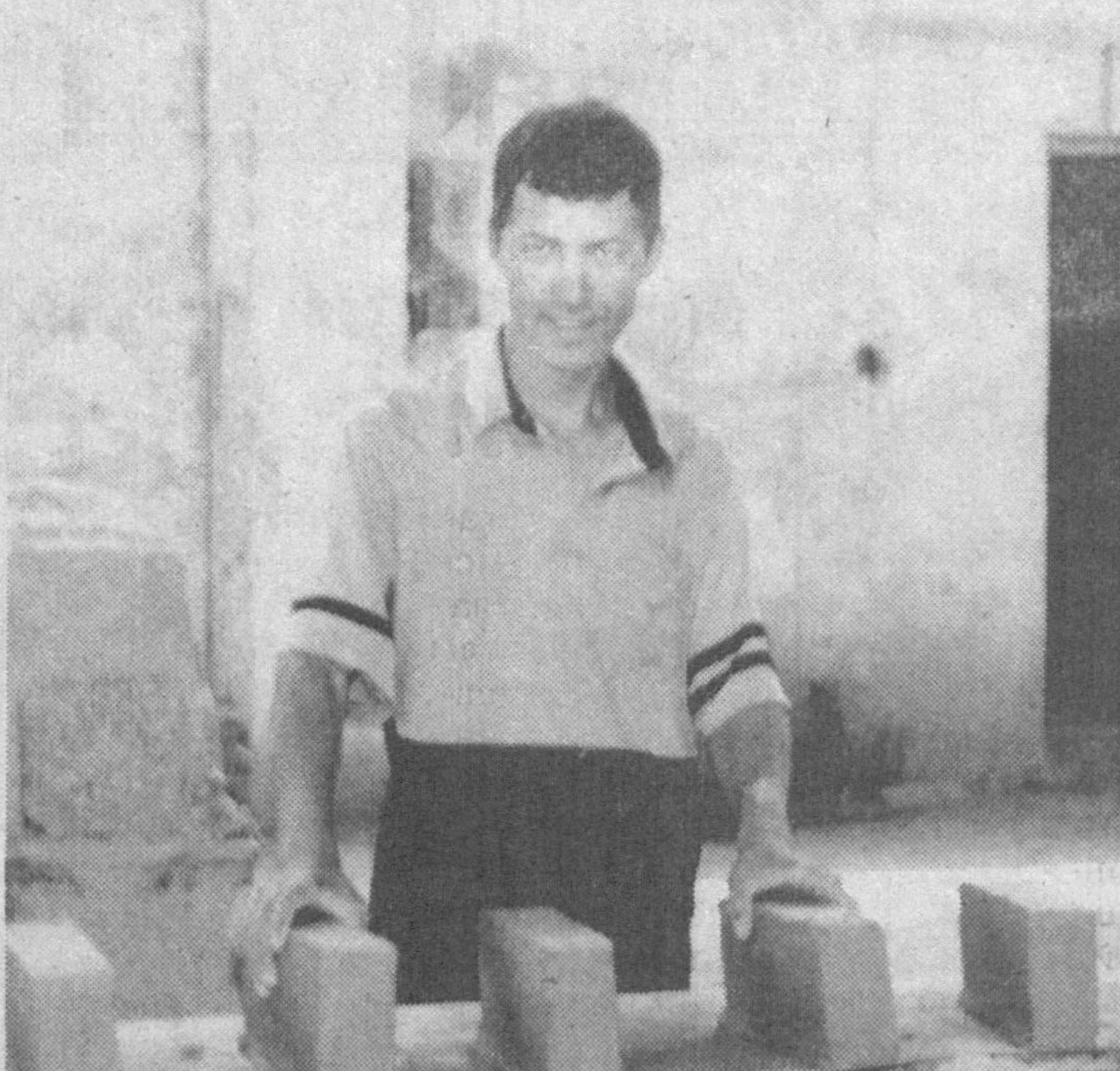
Оққўрғон туманидаги «Имкон» масъулияти чекланган жамияти томонидан бир ойда 300-350 минг дона пишик гишт ишлаб чиқарилиб, харидорларга етказиб берилмоқда. Айтиш мумкин, бу корхонада 75 нафар ишчи меҳнат қилмоқда. Улар учун кутубхона, дам олиш хоналари иш-