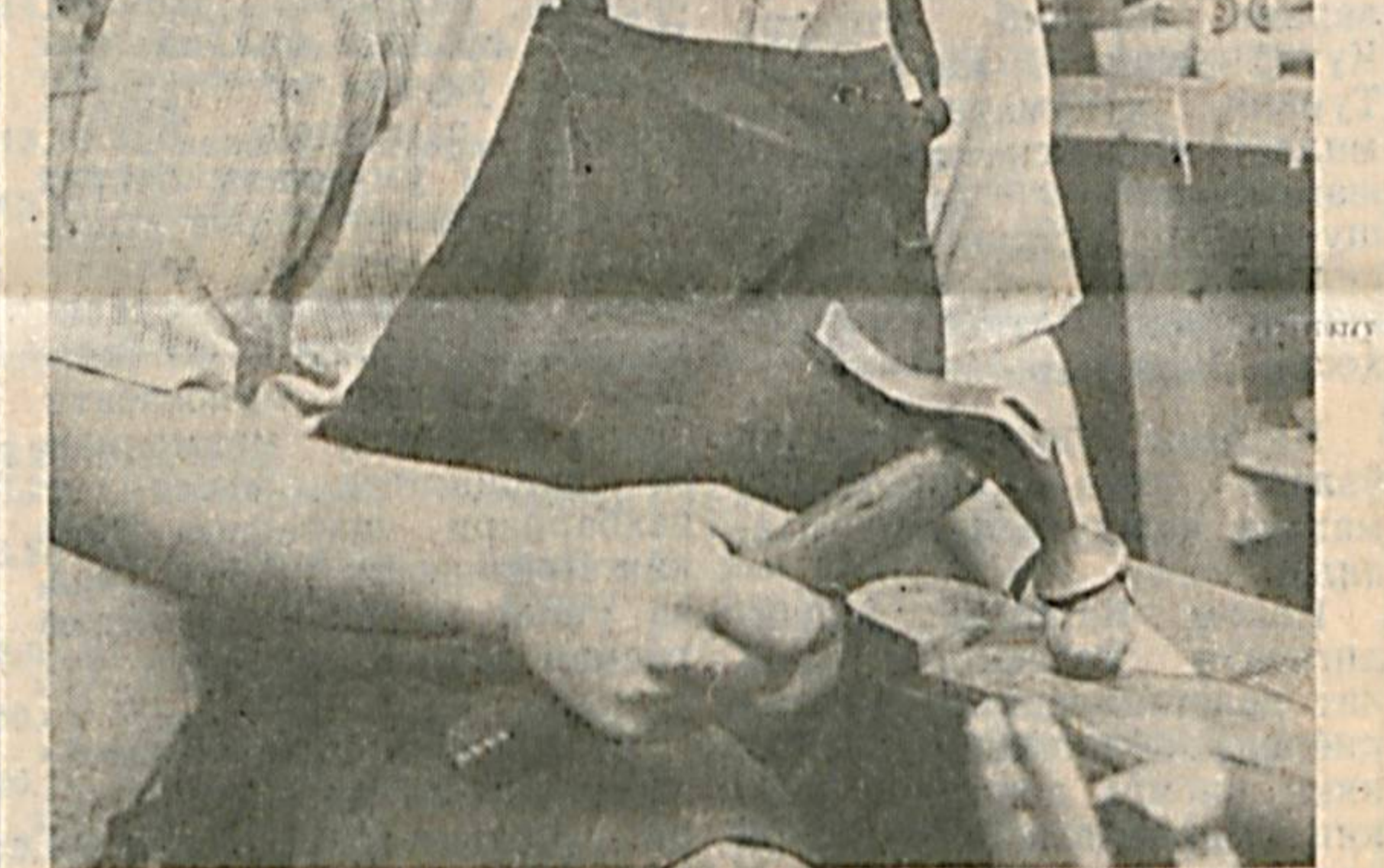
Шароф РАШИДОВ, Ўзбекистон Республикаси Фанлар академиясининг мўҳбир аъзоси, профессор.