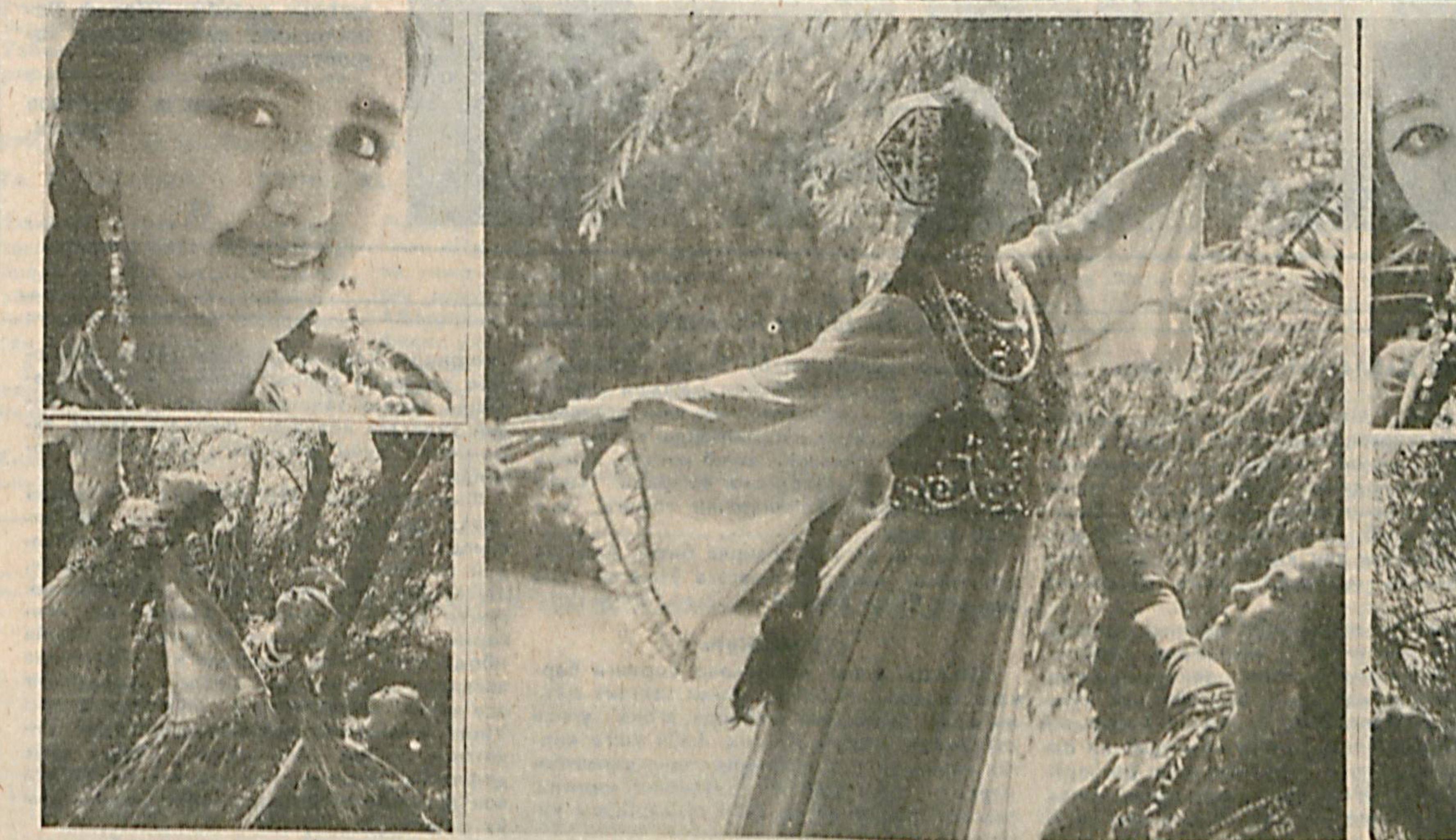
Ўзбекистон ишбилармонларининг «Вону» маданият маркази сулув раққосалари ижролари билан инсон гўзаллигини тараннум этиб, муҳлислар қалбини дарров забт этидилар.

— Раҳмат. Сўхбатини Мухайё МИРСАИДОВА олиб борди.