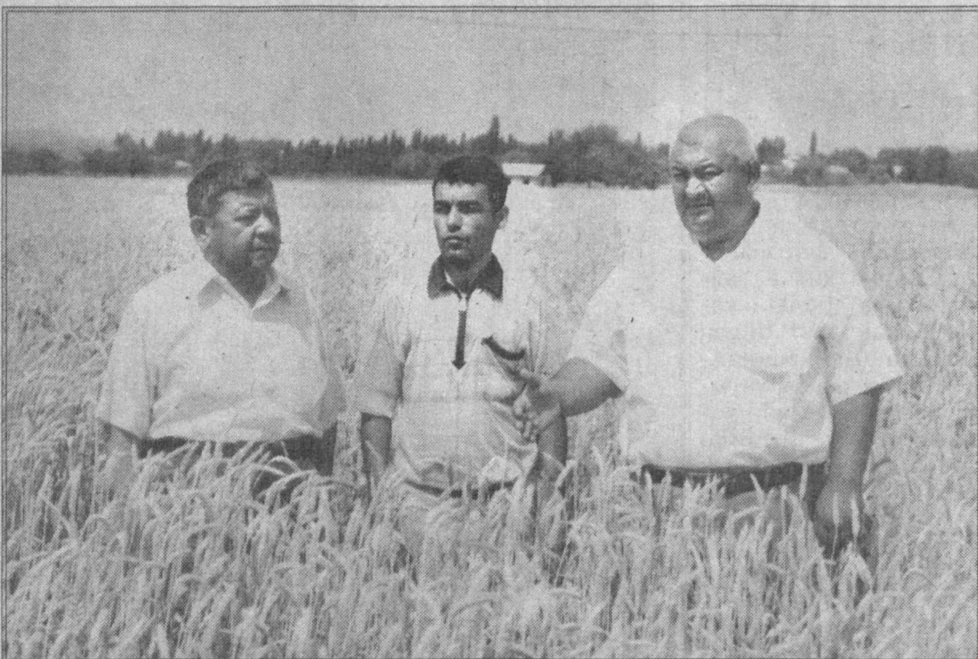
Бу йил Пскент тумани далаларида ҳам ризқу рўзимиз бўлган галладан мўл ҳосил етиштирилди. Айна пайтда сўнги гектарлар ҳосили саранжомлаб олинди.