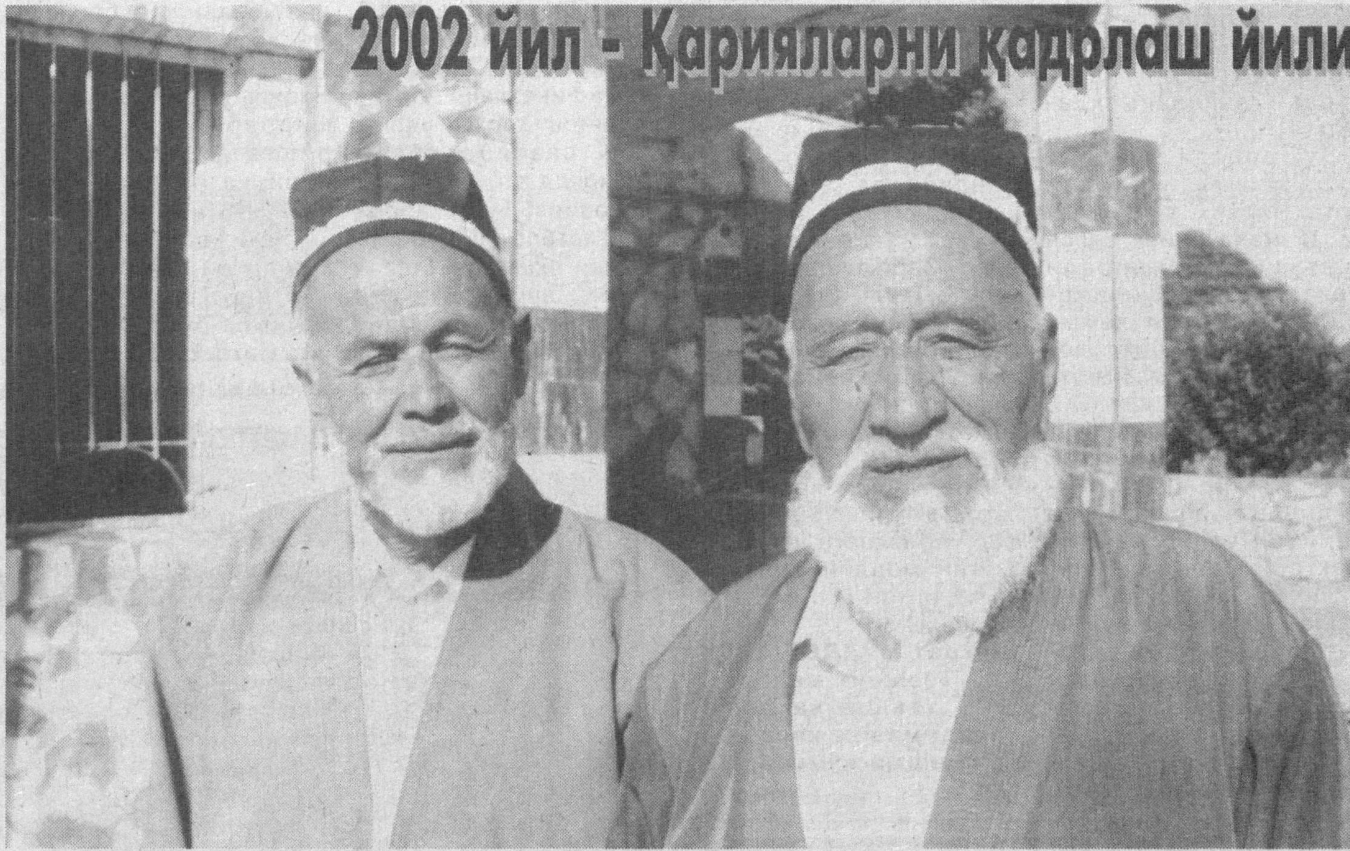
2002 йил - Қарияларни қадрлаш йили