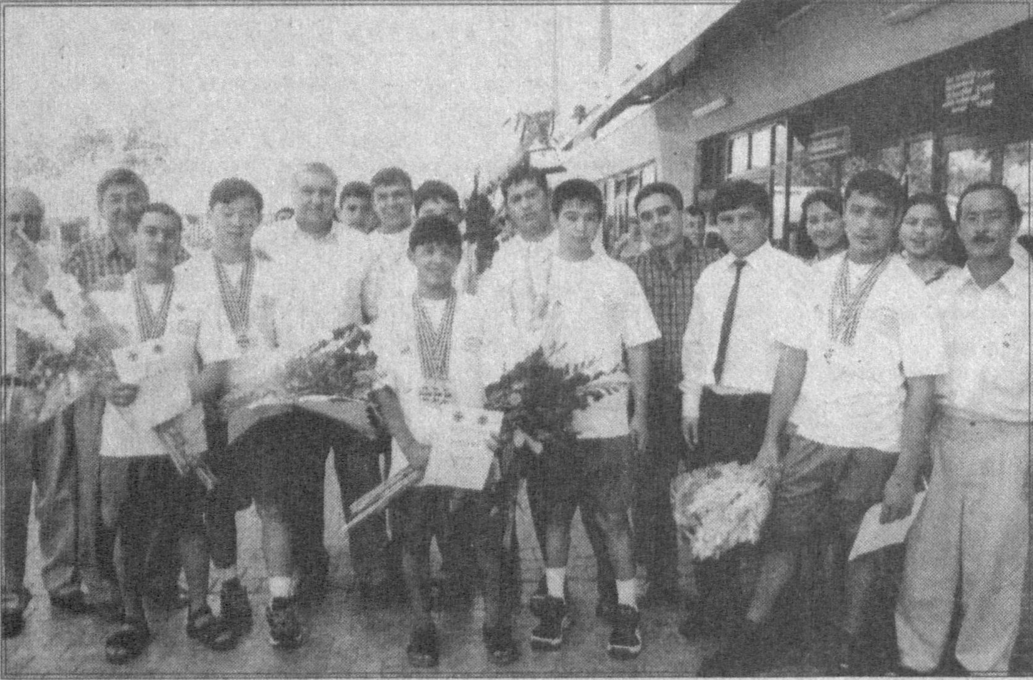
Еш огир атлетикачиларимиз Таиландда бўлиб ўтган қитъа чемпионатида фар кучиб, мамлакатимиз мустақиллигининг 11 йиллигига ажойиб ғалабани тўхфа этдилар. 4 та олтин, 5 та кумуш ва 3 та бронза медалларини кўлга киритган вакилларимиз умумжамоа ҳисобида биринчи ўринни эгаллашди. Кунни кеча голиб спортчиларимизни Тошкент аэропортида мутасаддилар, ота-оналар ва мухлислар кўлда гул, юзда табассум билан қутиб олдилар.

Эргаш ОЧИЛОВ, филология фанлари номзоди.