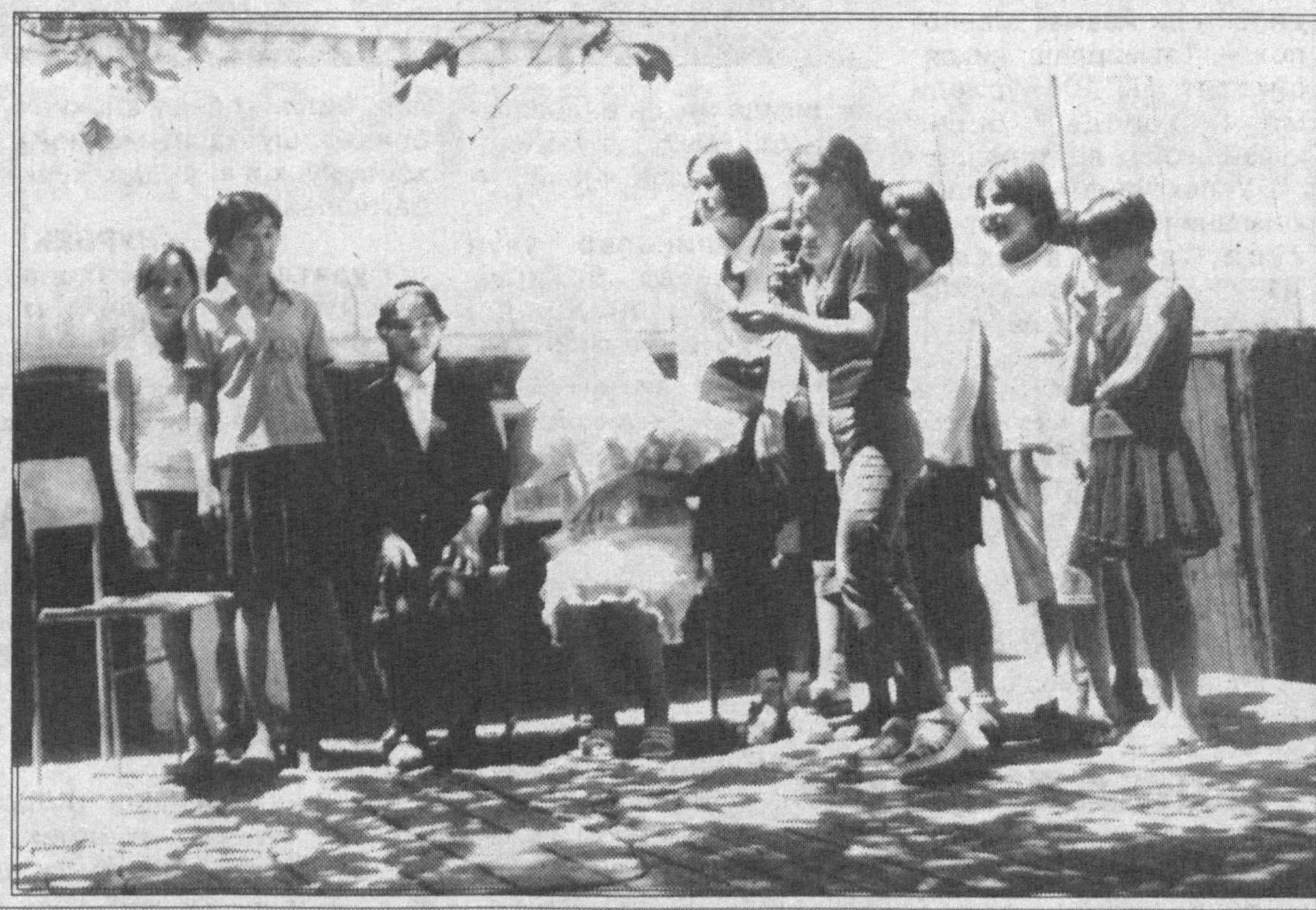
Болалар оромгоҳда ҳордиқ чикариш ва табиат билан яқинлашмоқда.