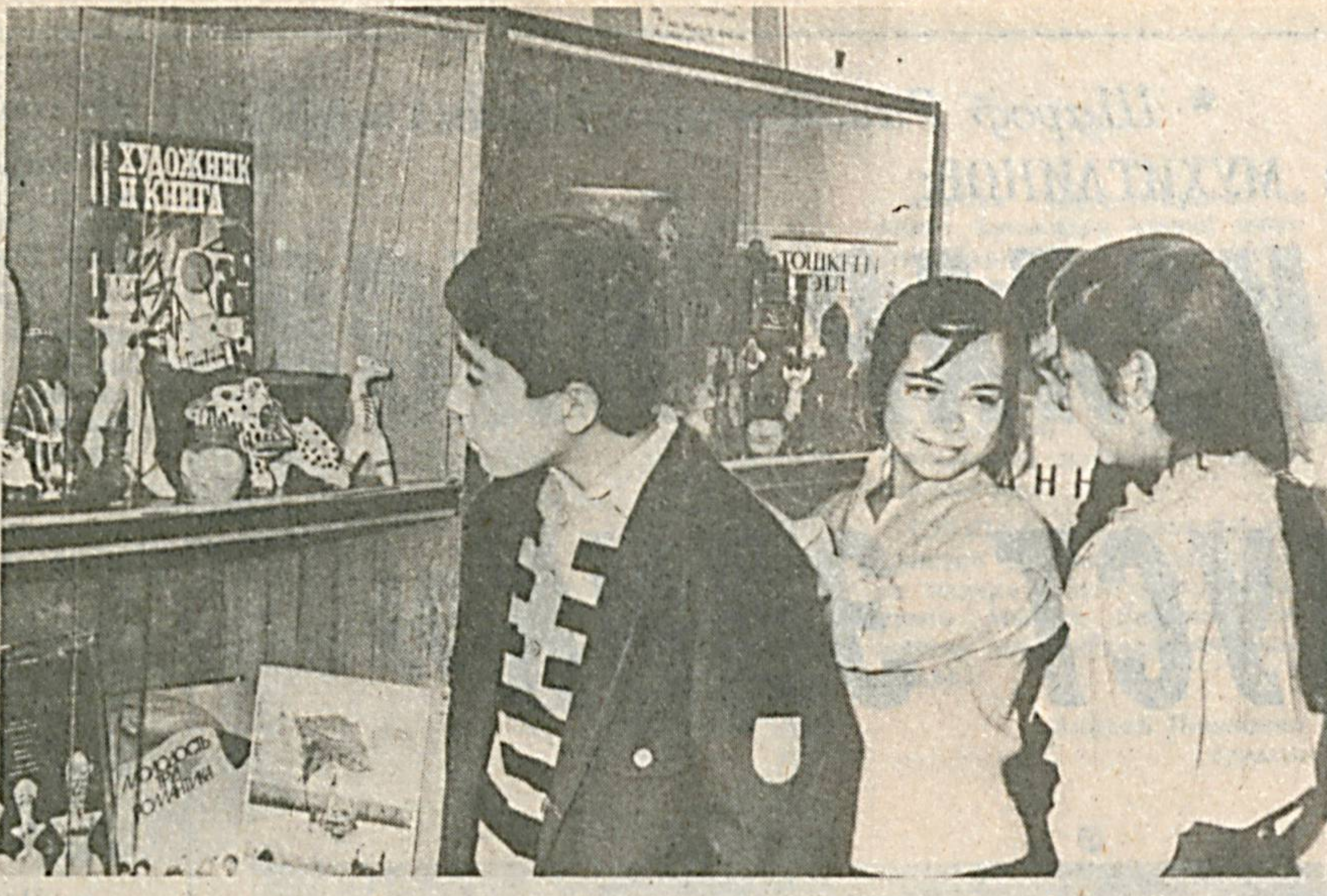
Пойтахтимиздаги Ар-Розий номли ўрта мактабда ташкил этилган этнография музейи ўзининг ранг-баранг ва бой кўргазмалари билан республика кўр-китанловиде биринчи ўринни эгаллаган. Кўргазмадан жой олган қадимги буюм-ларни ўқувчи ва муаллимлар тўплаган.

Натижалар шунинг кўрсатишича, инсон та-насининг иммунологик тизими гоят сез-гир ва организмга радиация таъсирининг объектив мезонидир, бу бошқа нати-жалар аҳоли соғлиғи ҳолатининг назорати учун алоҳида аҳоли гуруҳлари мониторин-ги учун асос қилиб олинган.