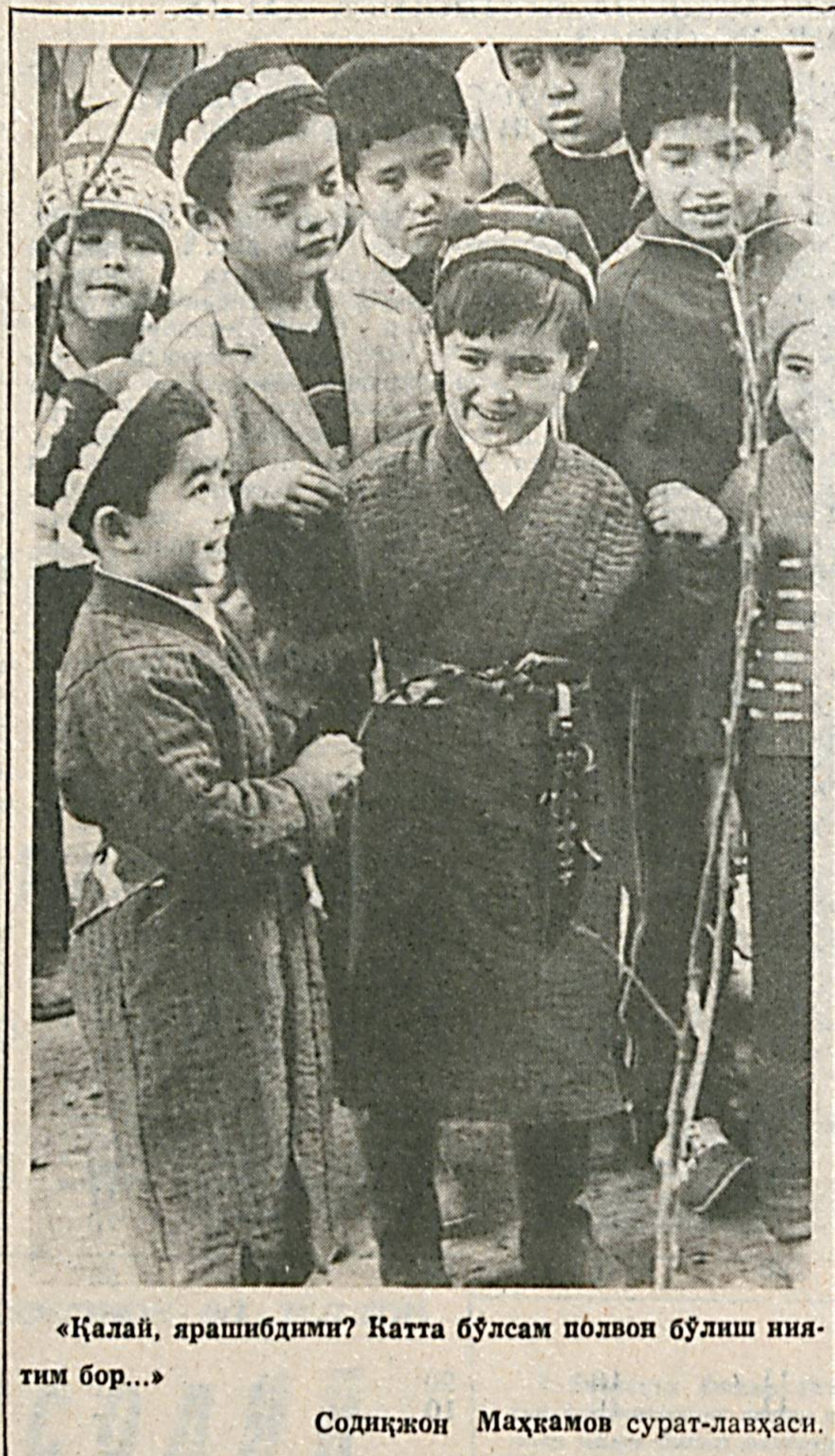
«Қалай, ярашибдими? Катта бўлсам полвон бўлиш ниятим бор...»

қеа бевосита халқ оғзидан даврдан даврга ўтиб келадиган фарзандлариниз учун айтилган дарс бўлган.