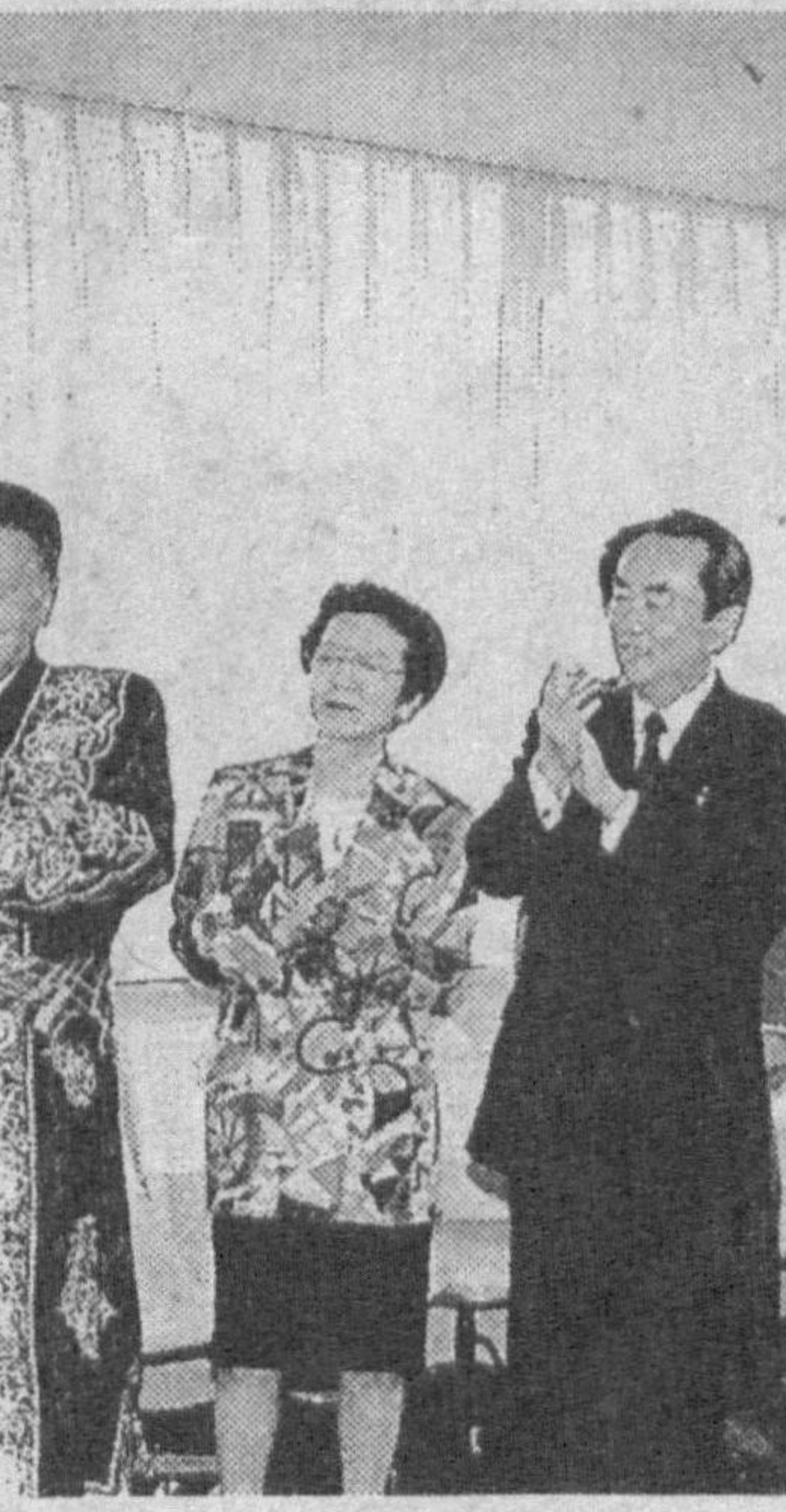
экан, бу ҳам Ўзбекистон-Япония дўстлигининг рамзи эканлигини таъкидлади.

Университетдаги тантанали йиғилишида Ўзбекистон Президентини Фармони билан икки мамлакат халқлари ўртасида дўстликни мустаҳкамлаш, илм-фан ва маданиятнинг ривожлантиришга қўшган ҳиссаси учун таниқли олим ва жамоат арбоби, Васада университети ректори Такаюси Окушима Ватанимизнинг «Дўстлик» ордени билан тақдирлангани эълон қилинди. Ислам Каримов орденини топширар