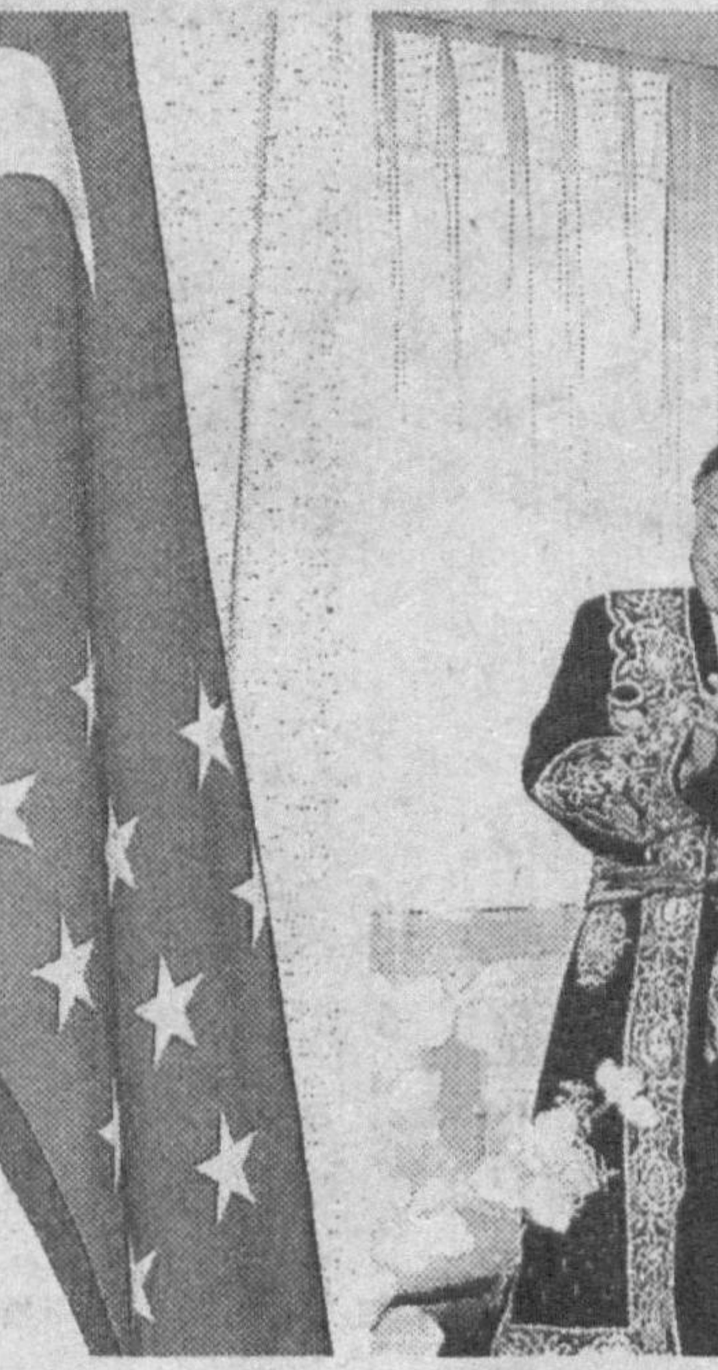
вазирининг «Мицубиси», «Мицуи», «Марубени», «Нише Иваи» корпорациялари билан ҳамкорлиги, Ўзбекистон Ташқи иқтисодий фаолият миллий банки билан «Bank of Tokyo-Mitsubishi» ўртасида имтиёзли кредит борасидаги «Ўзбектуризм» Миллий компанияси билан Япония саймиллаштириши уюшмаси ва бошқа сайёҳлик компаниялари ўртасида ҳамкорлик тўғрисидаги ҳужжатлар, 348 миллион иенлик грант ажратилиши ҳақидаги нота ва бошқа муҳим ҳужжатларга имзо чекилди.

Умуман, Токиода жами ўн тўртта ҳужжат имзоланиб, ўзаро муносабатларнинг ҳуқуқий пойдевори гоят мураттабланди ва мазмунан бойиди. Икки мамлакат Ташқи ишлар вазирилари ҳамкорлиги, Ўзбекистон Ташқи иқтисодий алоқалар