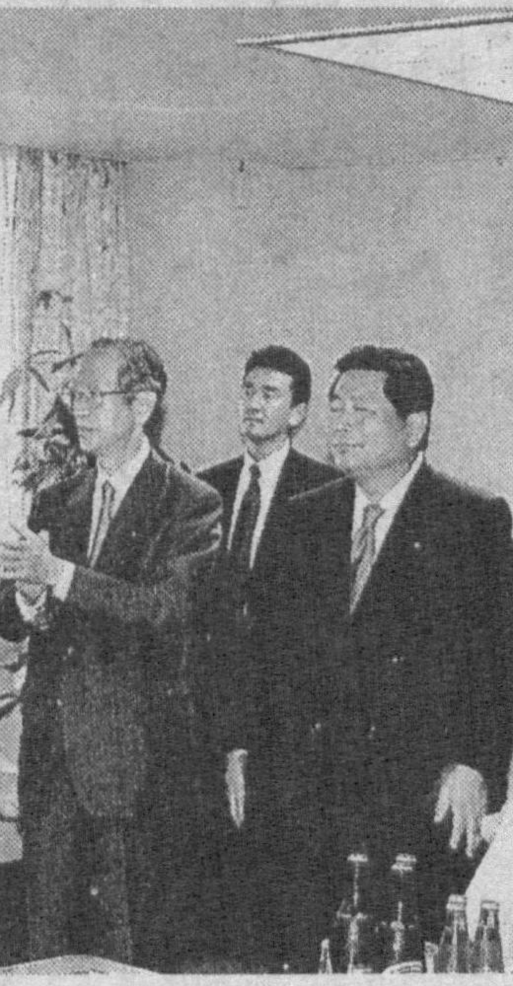
маросими ўтказилди. Кўтаринки руҳда ўтган суҳбатлар давомида энергетика, ахборот технологиялари, тўқимачилик, кимё ва энгил санаят, коммуникация тизимларини тақомиллаштириш борасида кўлаб ахдлашувларга эришилди.

Ташрифнинг яна бир ўзига хос жиҳати унинг иқтисодий музокараларга бой бўлганидир. Ислам Каримов таъбири билан айтганда, «Япония иқтисодиёти тибратиб турган» йирлик корпорациялар раҳбарлари билан алоҳида учрашувлар бўлди, ишбилармон доираларнинг нуфузли вакиллари иштирокида қабул