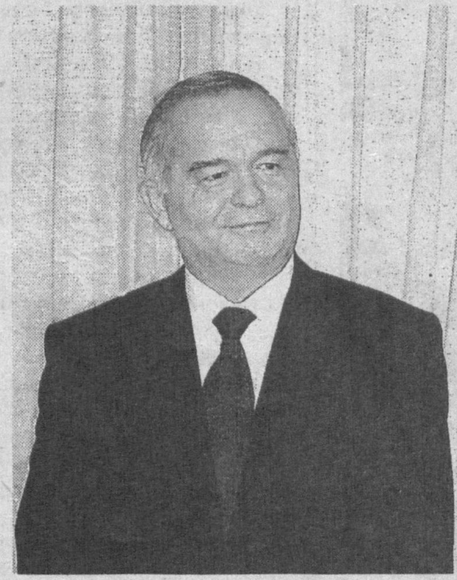
назар узоқ муддатли, қалин, ўзаро ишончга йўрилган муносабатларни назарда тутди.

Энди икки мамлакат ўртасидаги янги - стратегик ҳамкорлик ҳақида сўз кетар экан, аввало, бу муносабатларнинг мазмун-моҳиятига тўхталиш даркор. Гап шундаки, айрим мамлакатлар ўз манфаатларидан келиб чиққан ҳолда, маълум муддат давомида муайян давлат билан қалин ҳамкорлик қилиши, дунё сиёсий ва иқтисодий ҳаёти ёки ҳамкор мамлакатдаги вазият ўзгариб қолса, тўғрисида текарши қилиши мумкин. Стратегик ҳамкорлик эса, айрим ўзгаришлардан қатъи