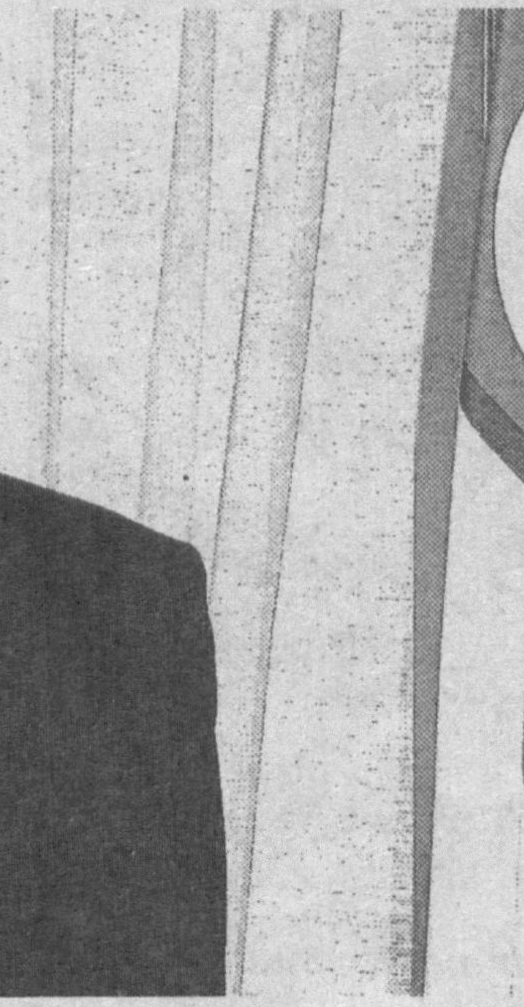
зир Жунъитиро Коидзуми имзолаган иккинчи ҳужжат - Иқтисодий ҳамкорликни ривожлантириш ва Ўзбекистондаги ислохотларни қўллаб-қувватлаш тўғрисидаги қўшма баёнод ҳам гоят муҳим аҳамиятга эга. У иқтисодийнинг кўлаб соҳалари бўйича икки томонлама қонун ҳужжатларини тақомиллаштиришни назарда тутди. Жумладан, унда энергетика соҳасидаги ҳамкорлик, савдо-иқтисодий муносабатлар, сармояларни ўзаро химоялаш ва рағбатлантириш, ҳаво алоқасида ҳамкорликни янада кенгайтириш каби масалалар қамраб олинган. Албатта, Япония томонидан бундан бундан ҳам Ўзбекистондаги ислохотларни янада кенг қўллаб-қувватлаши алоҳида таъкидланади.

Токиода Президент Ислам Каримов ва Бош ва-