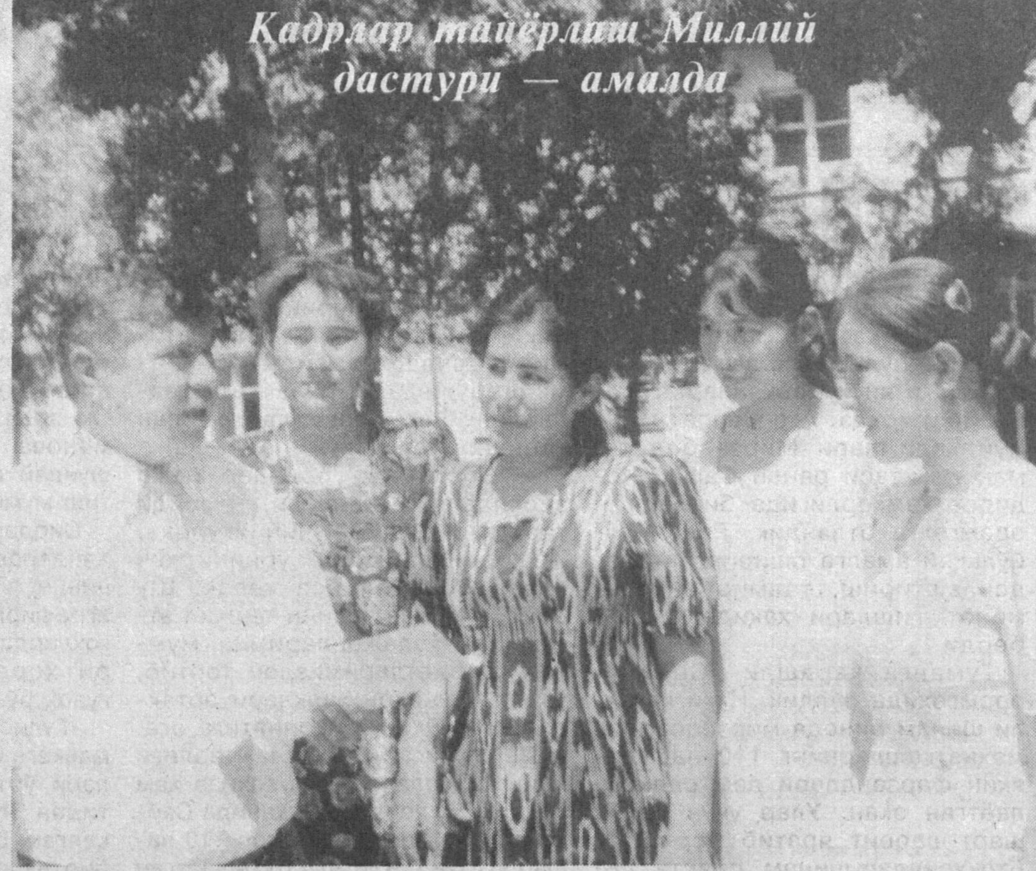
Кадрлар тайёрлаш Миллий дастури — амалда