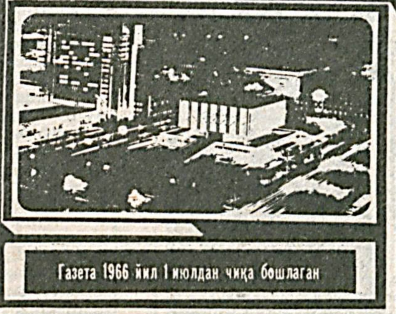
Газета 1966 йил 1 июлдан чиқа бошлаган

● Англияда чоп этилган «Уорлд Сокиер» журналининг мушаррифлари ва журналистлари ер кўрасидан энг кучли футболчи, мураббий ҳамда жамоаларини аниқлади.