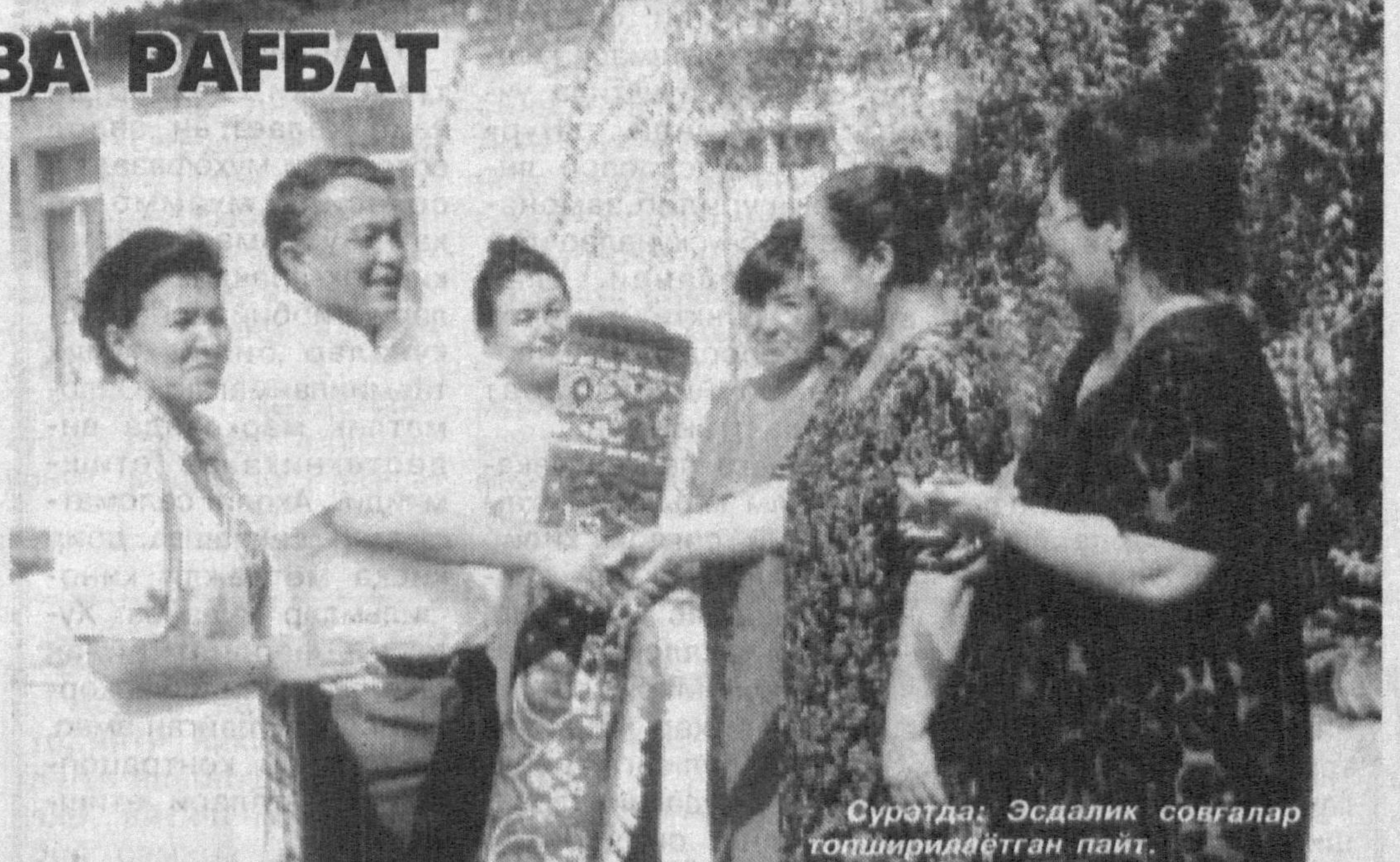
Суретда: Эсдалиқ совғалар топшириётган пайт.