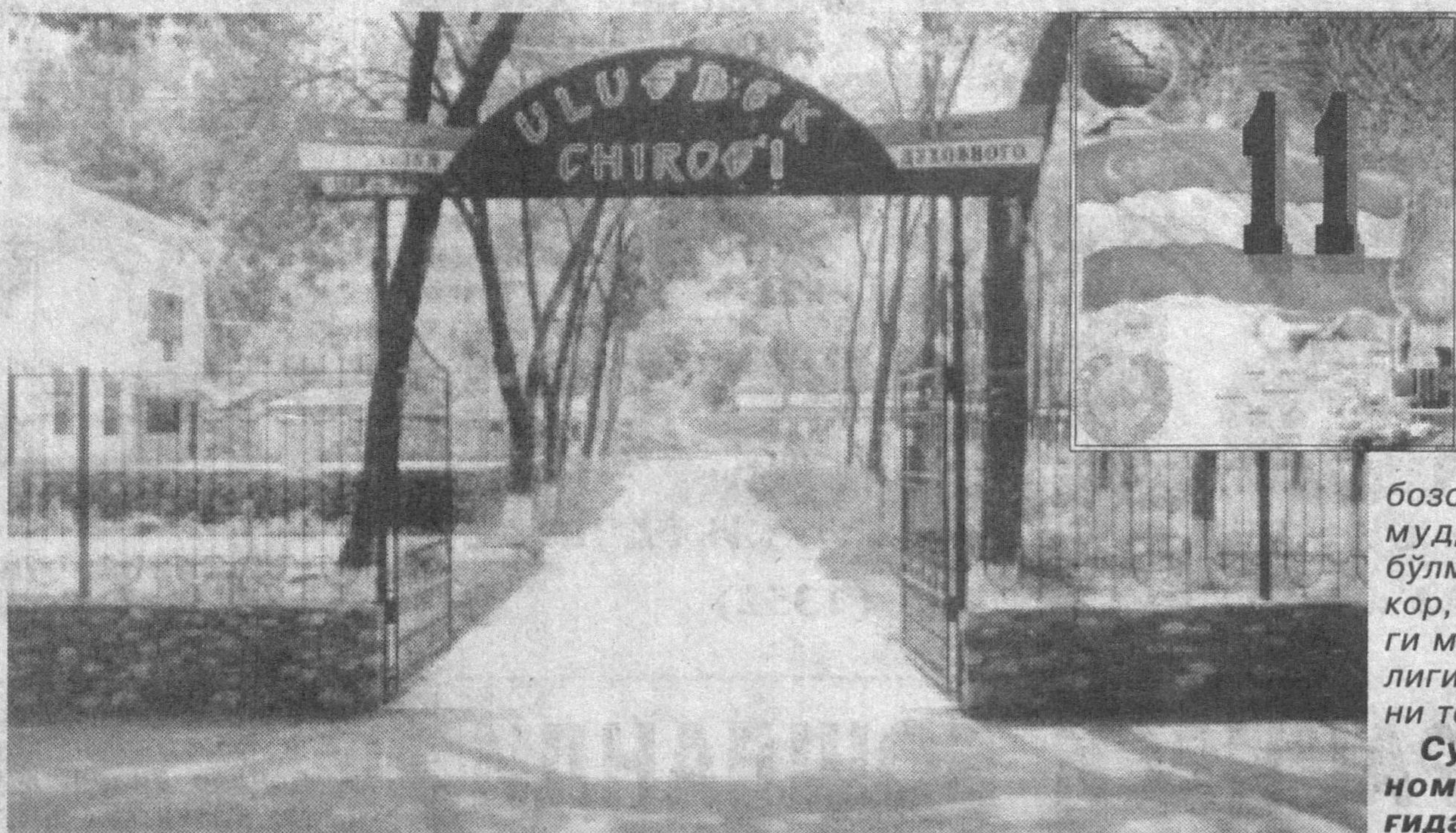
Тошкент шаҳридаги Мирзо Улуғбек туманида хайрли ишлар амалга оширилмоқда. Кўпнинг кучи билан кўчалар, хўбонлар янада фойдали бўлиб, чиroy очмоқда. Умуман бу йил мавжуд 50 та маҳаллада ободонлаштириш, кўкаламзорлаштириш ишлари уюшқоқлик билан олиб борилди.

Яқинда Улуғбек маҳалласида «Улуғбек чиroyи» номи билан аталган маданият-истироҳат боғи фойдаланишга топширилди. Табиийки, бозор шароитида бундай ишларни қисқа мuddатда амалга оширишнинг ўзи бўлмайди. Бир-бирига ҳамқору мададор, меҳру оқибатли кишилар ўртасидаги мустаҳкам дўстлик қудратли куч эканлиги бунёдкорлик ишларида ўз тасдиғини топмоқда.