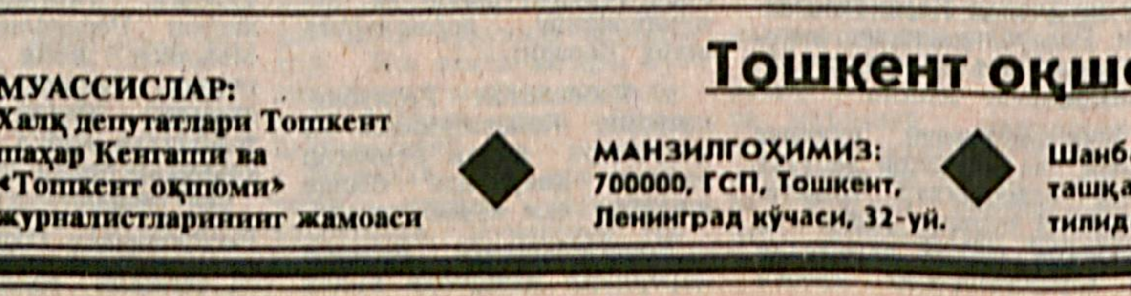
МАНЗИЛГОҲИМИЗ: 700000, ГСП, Тошкент, Ленинград кўчаси, 32-уй.