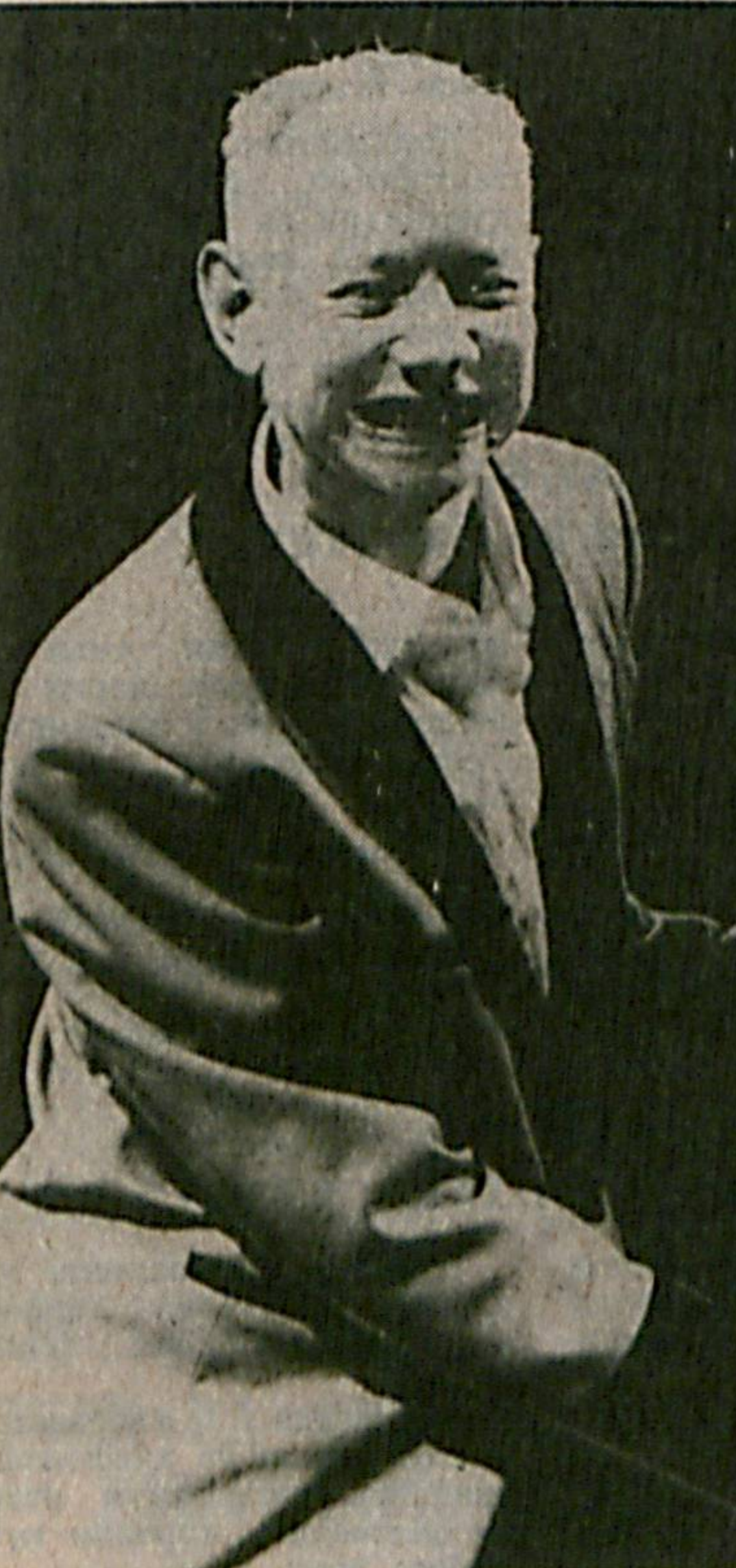
Британия поймунаси осмонига чиқиб келадиган санъат юзиде — Жо Жексон. Ҳазининг Фарбий Европа мамлакатлари бўйлаб илк сафарини бошлади. Ушбу гасет-роль унинг «Лафта энд ласт» (тузлу ва шаҳват) номли илк қўниқлар туғлама жамланган пластинканинг дунё юзини кўриши билан бошланди.

хулудиде 160. Нигер дарёси ҳавзаларида эса 280 тил муомалалари юради. Бу борада Папуа — Ниги Гвинея давлати голибликни кўлга киритган. Бу ерда 1010 тил ва шева мавжуд. Тупланган ушбу маълумотлардан тилшуносларнинг ўзлари ҳам ҳайрон.