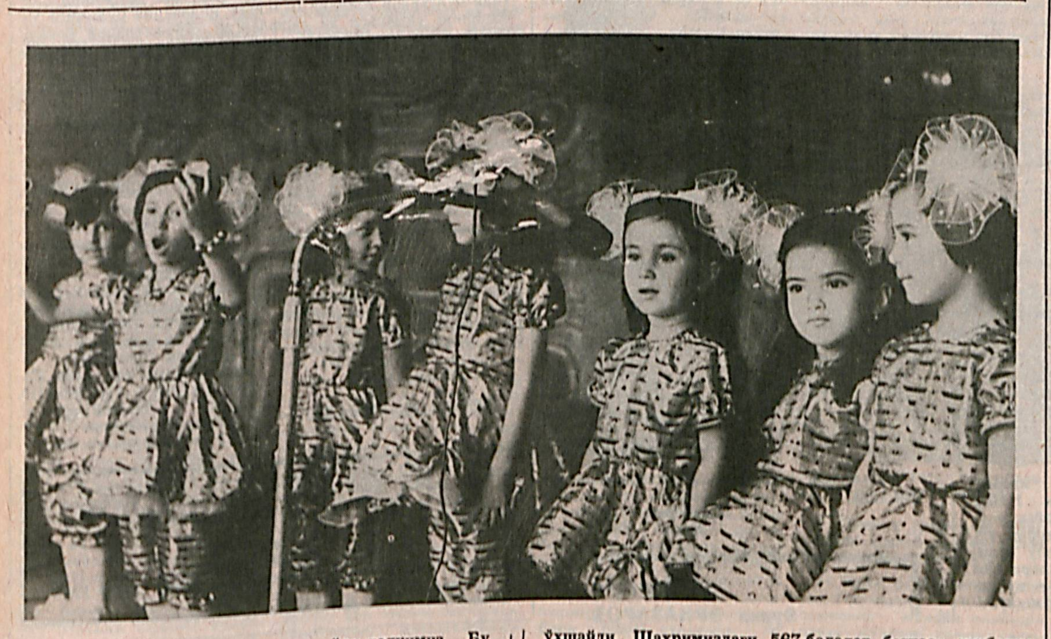
Буладиган бола бошидан маълум, дейди халқимиз. Бу ўқийди. Шаҳримиздаги 567 болалар боғчаси тарбияланувчилари ижро этган кўшиқлар ёпи қарига ёқди.

МИРОБОД районидagi Саниқул турар жой мавзесида «Бешчинор» деб аталган янги 60 ўринли оёқона фойдаланишга топширилди.