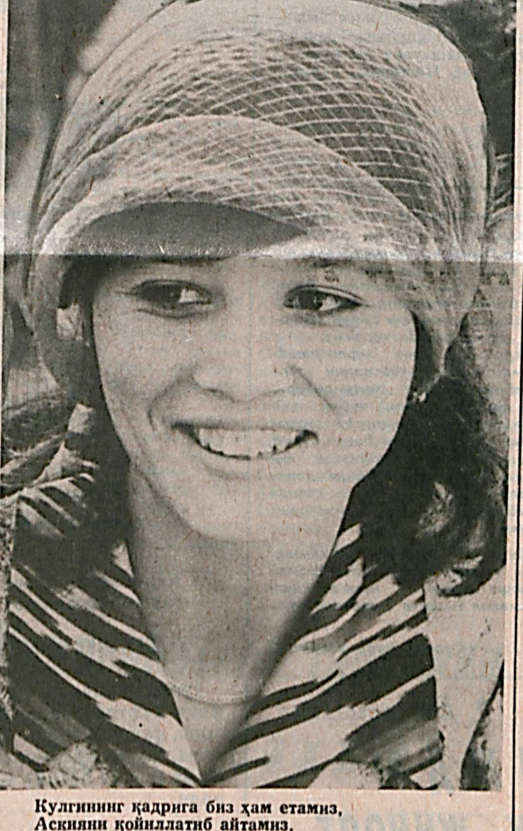
Кулгунинг қадрига биз ҳам етасиз, Асияни қойиллатиб айтасиз.

— Бой нега камбагал, камбагал эса бой бўлмайди? — Бой ҳаминша ўяғ томони билан ухлайди. Шунинг учун юраги эзилди, тушида қашшоқлана боради. Ўғида эса э-хўшини йғи олиб, янаям илдамроқ ҳаракатланади. Камбагал эса ҳаминша чап томони билан ухлаб, тушида бою бахтиёр бўлиб, ўғида ана шунинг лаззати-га кифоялиб юриверади. — Одамзот ҳаёт билан видолашаётганда нимани англай бошлайди? — Оддийлигини. — Бехосдан уй ҳайвонла-рига забон битса, одамзотга даставвал нима деб мурожаат қилган бўларди? — «Қўйиб юбор!» деб но-ла қиларди. — Одам кўпроқ нимадан бахтиёр, рози бўлади? — Яшаётганидан.