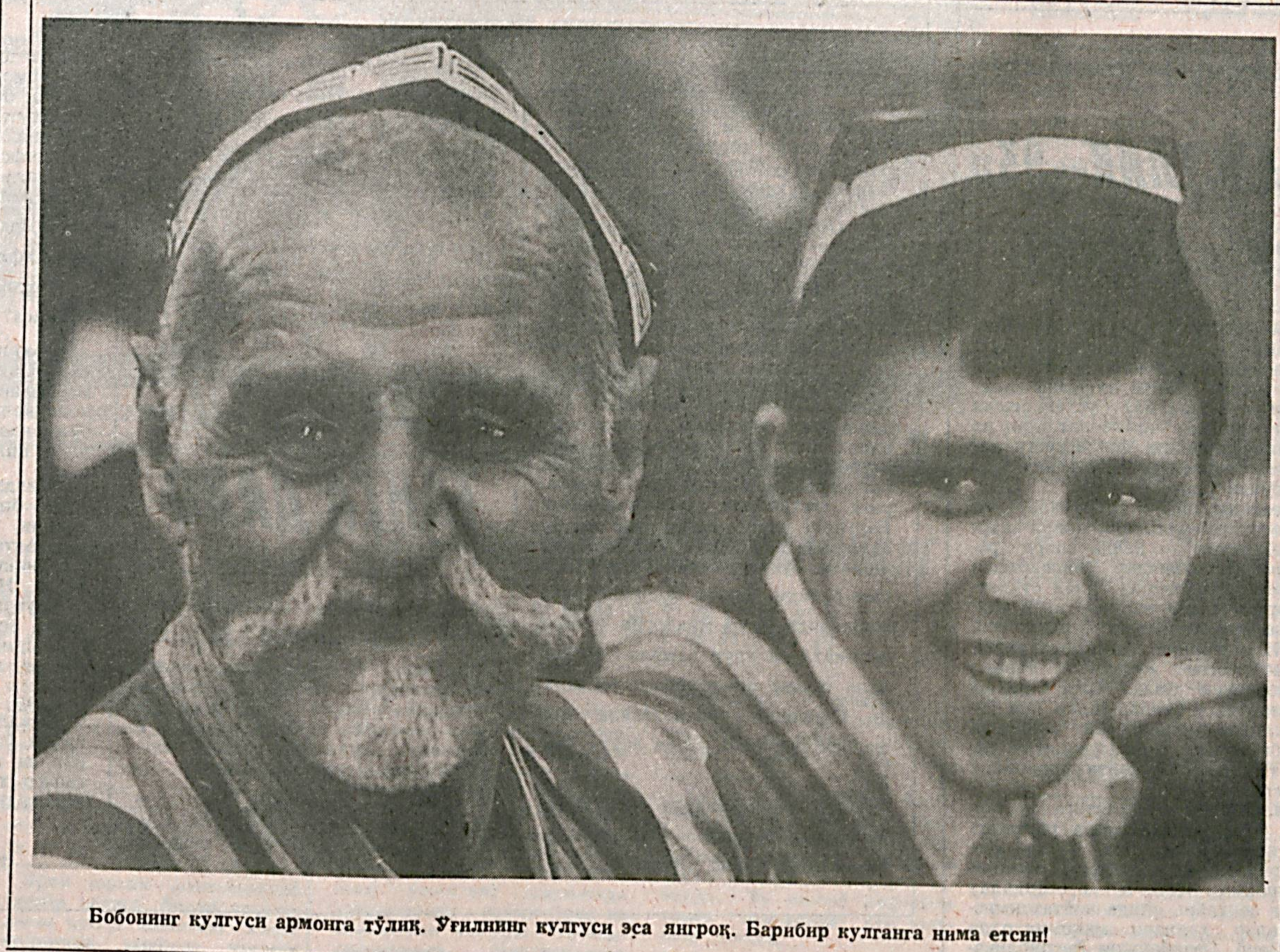
Бобонинг кулгуси армонга тўлиқ. Ўғилнинг кулгуси эса янграқ. Барибир қулганга нима етсин!

ИСКАНДАР. Гулмисиз, сунбулмисиз, райҳонмисиз, жамбилмисиз? Ҳўзир қизлар совчи келганда: «Армияга борган эканми!» деб суриштиришди. Умуман, бирор тай-инли хўнарнинг думидан ушлаганимиз? ИСКАНДАР. Гулмисиз, сунбулмисиз, райҳонмисиз, жамбилмисиз? Бизни хиз-матга кузатишганда: «Қайтиб келсақ, ҳамма ишни ўз қўлимизга оламиз!» деб ваъда берганимизни эшитганимиз? АЙНИДДИН. Мана, муқталик давлат бўл-ди. Ҳамма умид миллий армиямиздан. Ҳалқимизнинг тинчлиги, оқсонишлиги, ф-ровон ҳаёт кечирishi бизга ишониб қўй-ганини чин қалбдан ҳис қилганимиз? АЙНИДДИН ЗАЙНИДДИНОВ, Искандар РАҲМОНОВ.