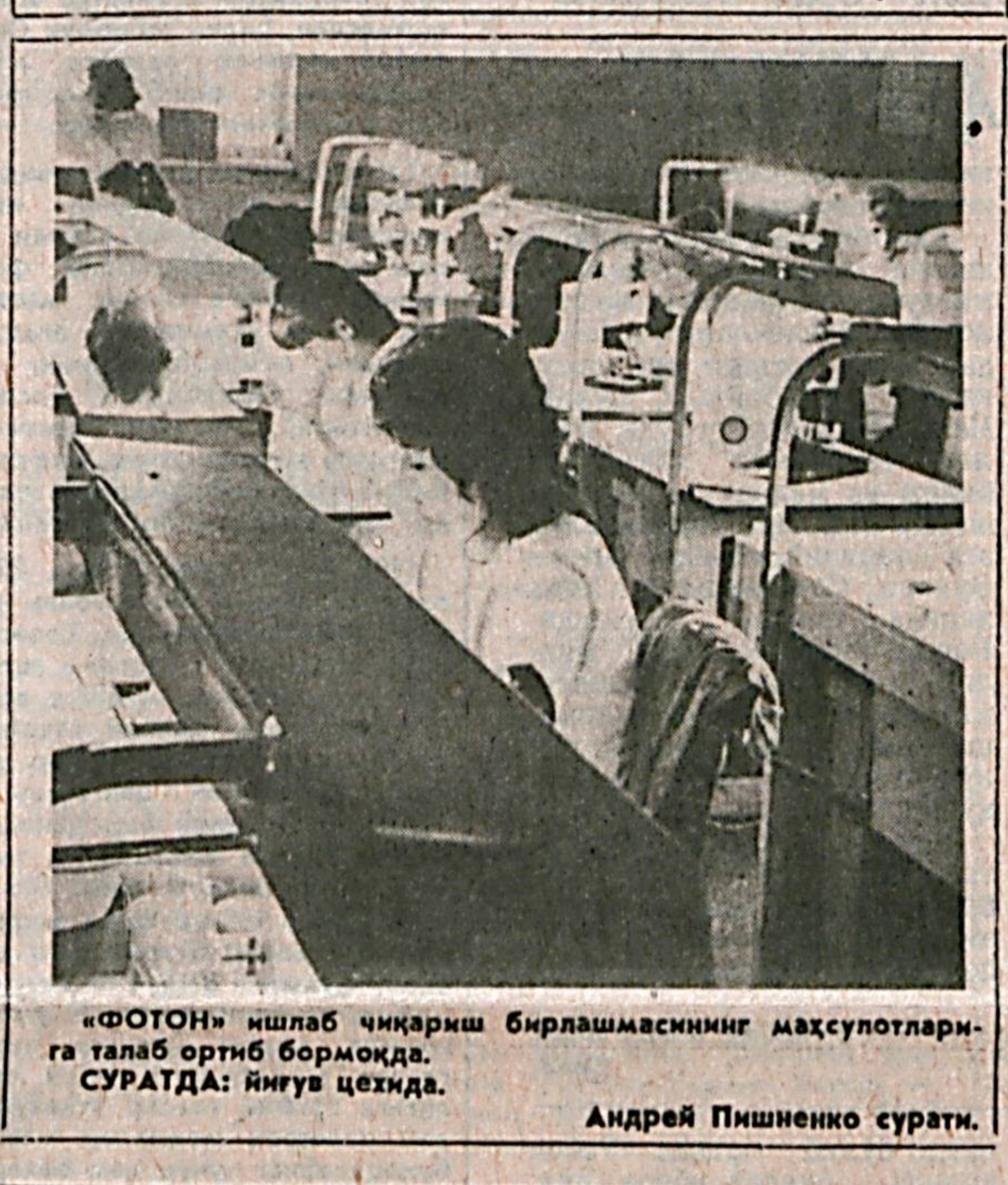
«Фотон» ишлаб чиқариш бirlашмасининг маҳсулотлари- га талаб ортиб бормоқда. СУРАТДА: йиғув ҳезида.

Республикамизнинг халқлари Тожикистонда содир бўлаётган воқеаларни алам ва изтироб билан кутиб олмақдалар, Тожикистон халқ ноибларининг мамлакатинидаги аҳволни нормал иста солиш йўлидаги ишлари ва тақдирларини тўла-тўқис қўллаб-қувватлайдилар.