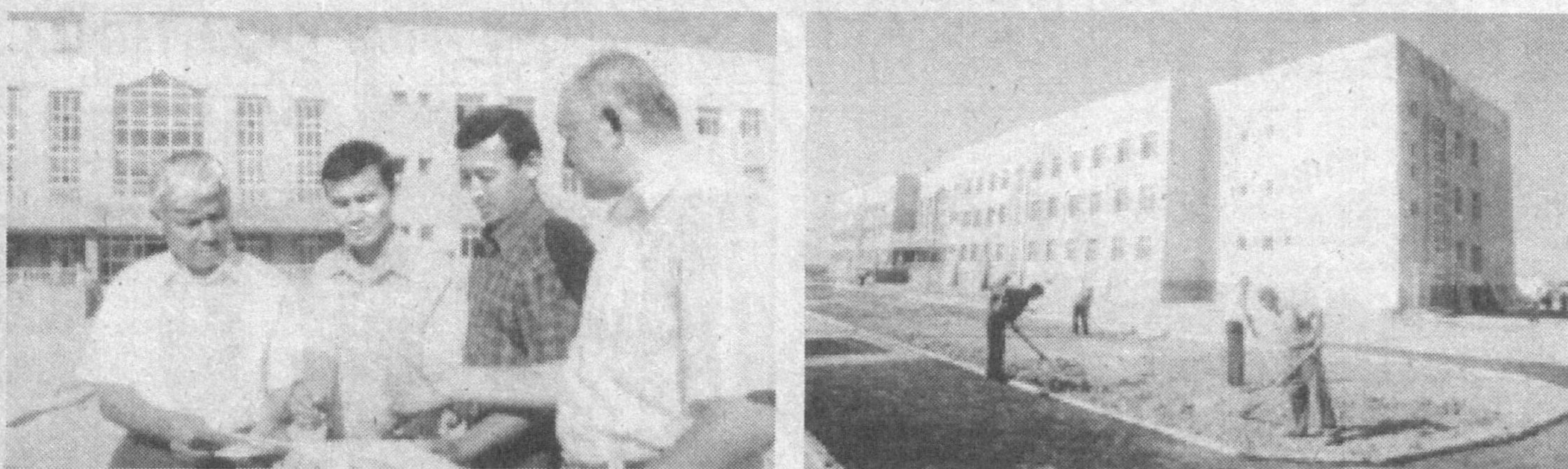
Ангор туманидаги маиший хизмат касб-хунар коллежи юртимиз мустақиллигининг 11 йиллиги арафасида ўзининг илк талабаларини қабул қилиб олди.