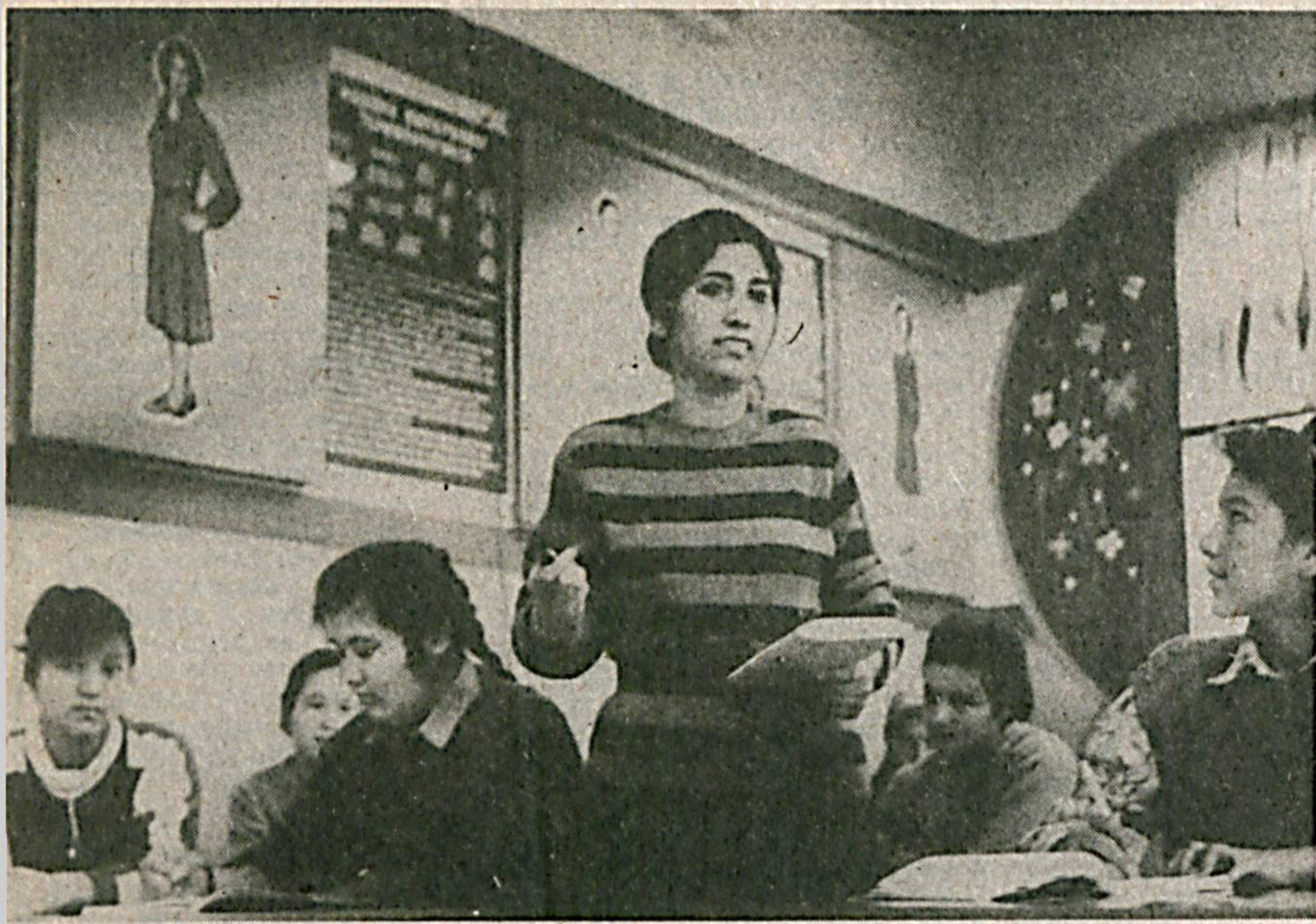
Сиз суратда кўриб турган бу қизлар тахриридаги 48-хунар-техника билим ўргини талабаларидир. Улар бу ерда рга маълумот олиш билан бирга тилини билиш, шунингдек, кийимлар технологияси, лойиҳаларини чизиб мутахас-