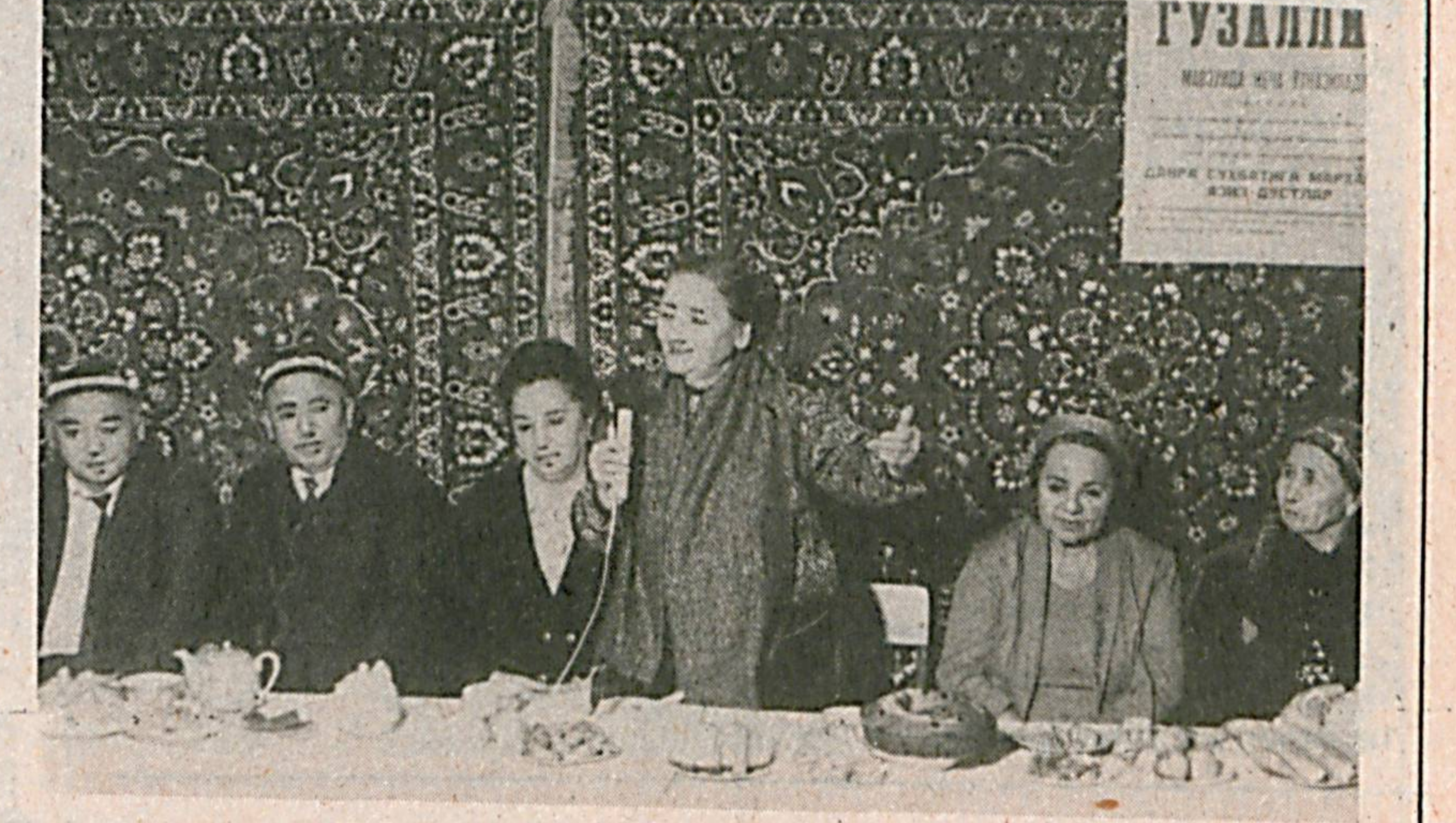
СУРАТЛАРДА: «Шарқона гўзаллик» деб номланган давра суҳбатидан лавҳалар.