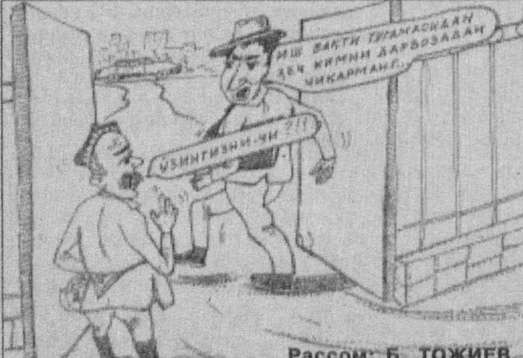
Рассом: Б. ТОЖИЕВ.