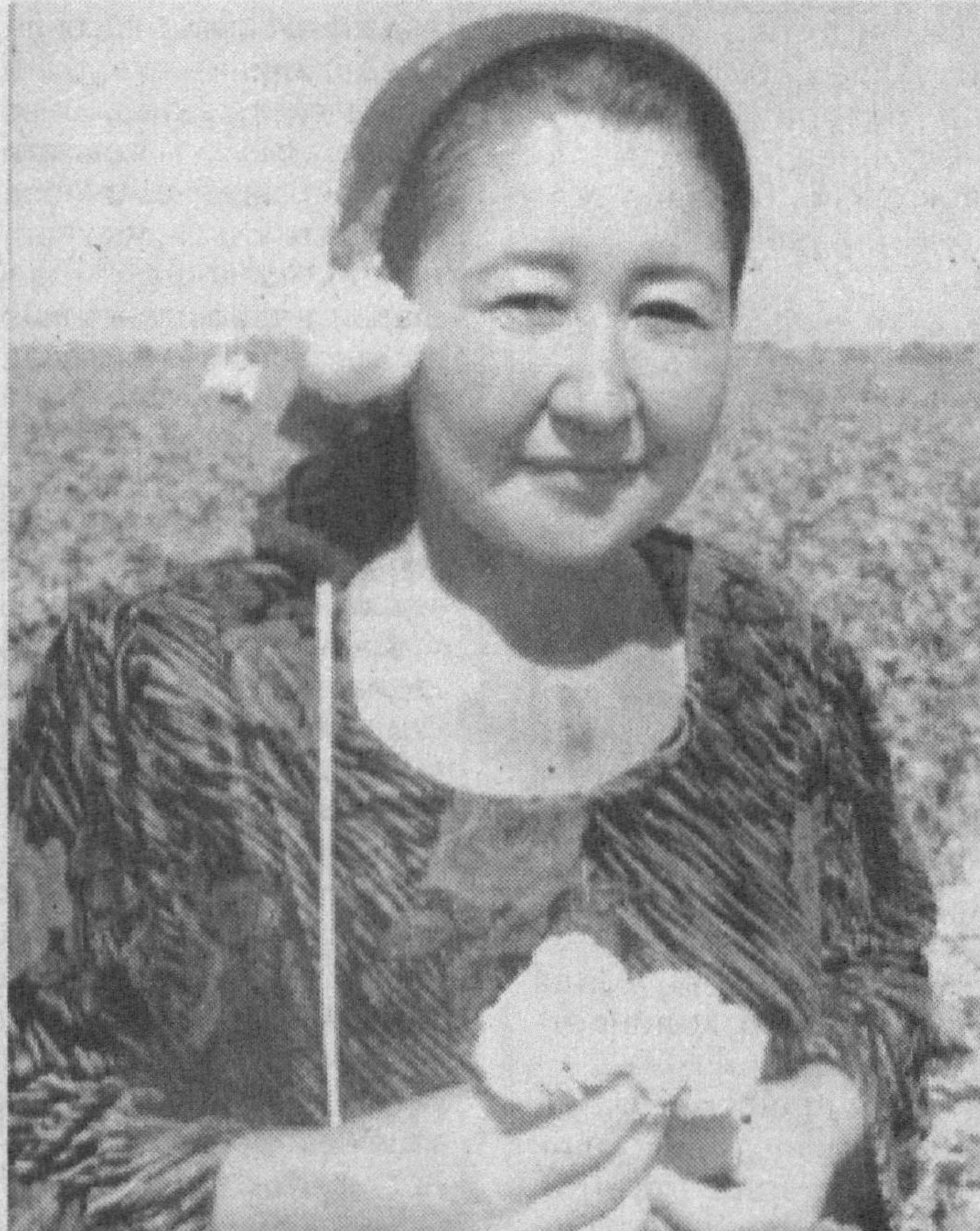
Бугунги кунда Қашқадарё вилоятида пахта йиғим-терими кизгин тус олган. Теримчилар ҳар бир дақиқани ганимат билиб, даладаги ҳосилни илоҳи борица қисқа фурсатда йиштириб олишга ҳаракат қилишаётир.