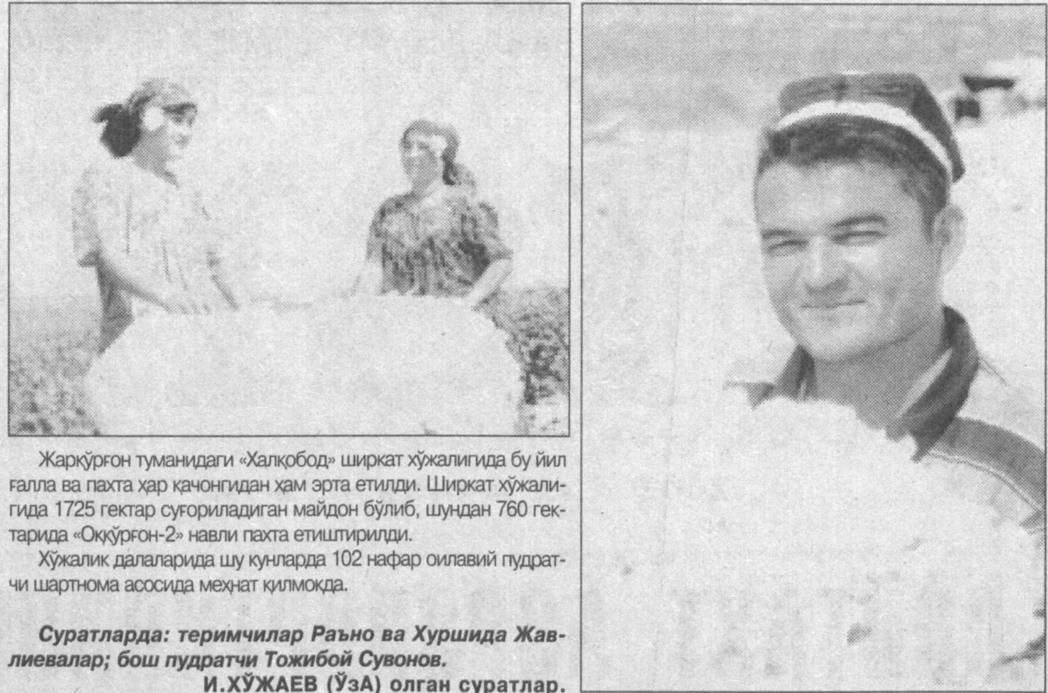
Жарқўрган туманидаги «Халқобод» ширкат ҳўжалигида бу йил галла ва пахта ҳар қанонгидан ҳам эрта етилди. Ширкат ҳўжалигида 1725 гектар сўғорилмаган майдон бўлиб, шундан 760 гектарда «Оқўрғон-2» наъли пахта етилтирилди. Ҳўжалик далавларида шу кўнларда 102 нафар оилавий пудратчи шартнома асосида меҳнат қилмоқда.

Умуман олганда, жаҳон амалиоти ва Ўзбекистоннинг ўзига хос шарт-шароитлари бандлик масаласини ҳал қилишдек масъулиятли вазифани кичик ва ўрта бизнеснинг (КЎБ) ривожланиш истиқболлари билан чамбарчас