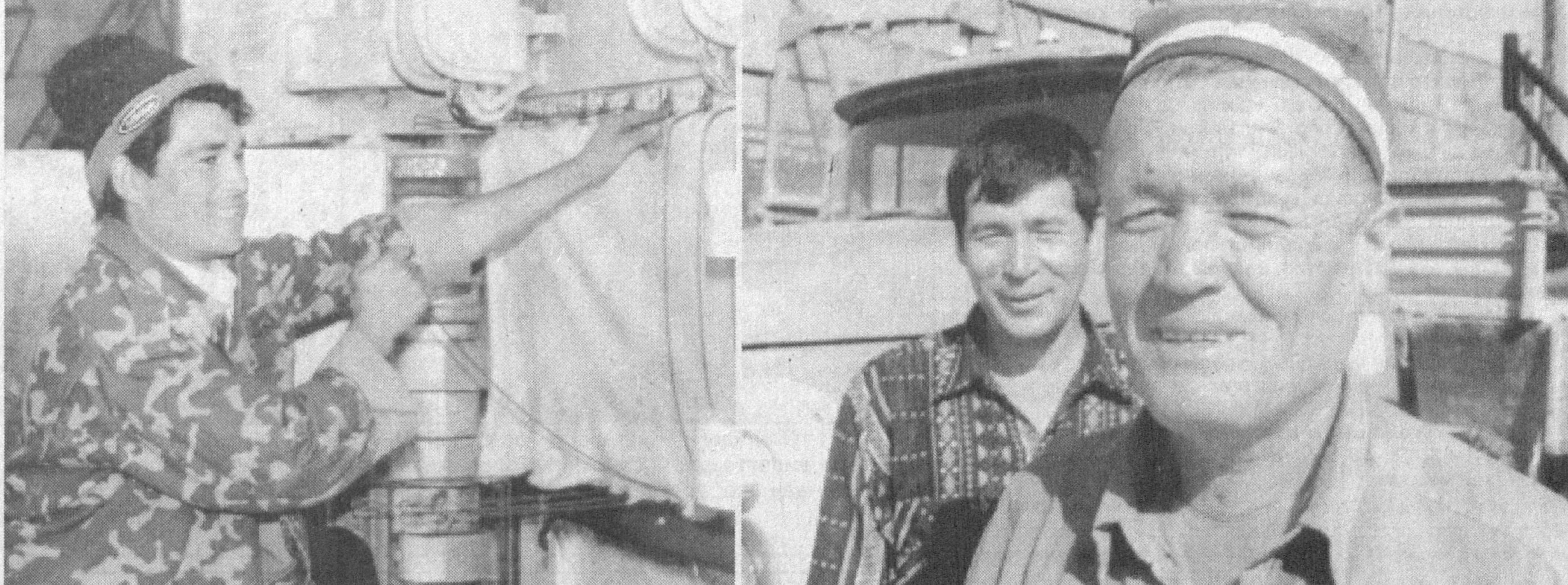
Пайриқ туманидаги «Челак пахта тозалаш» ОАЖда 522 нафар ишчи уч сменада меҳнат қиладилар. Уларнинг умумий меҳнат қилиб, мазмунли ҳордиқ чиқаришлари учун барча қўлайликлар яратилган. Хусусан, хизматчилар махсус кийим-бош, бепул дори-дармонлар билан таъминланган. Шунингдек, улар учун сут маҳсулотлари ва бир маҳал иссиқ овқат ташкил этилган.

ба уюшмалари кенгаши ва тармок кўмиталари арасида бўлиб қолган зарар учун ҳодимларга жами 2,5 миллион сўм ундириб берилди. Иш ҳақини вақтида тўлаш, янги иш ўринларини вужудга келтириш бугунги куннинг муҳим масалаларидан бири бўлиб турибди. Шунингдек, улар учун сут маҳсулотлари ва бир маҳал иссиқ овқат ташкил этилган.