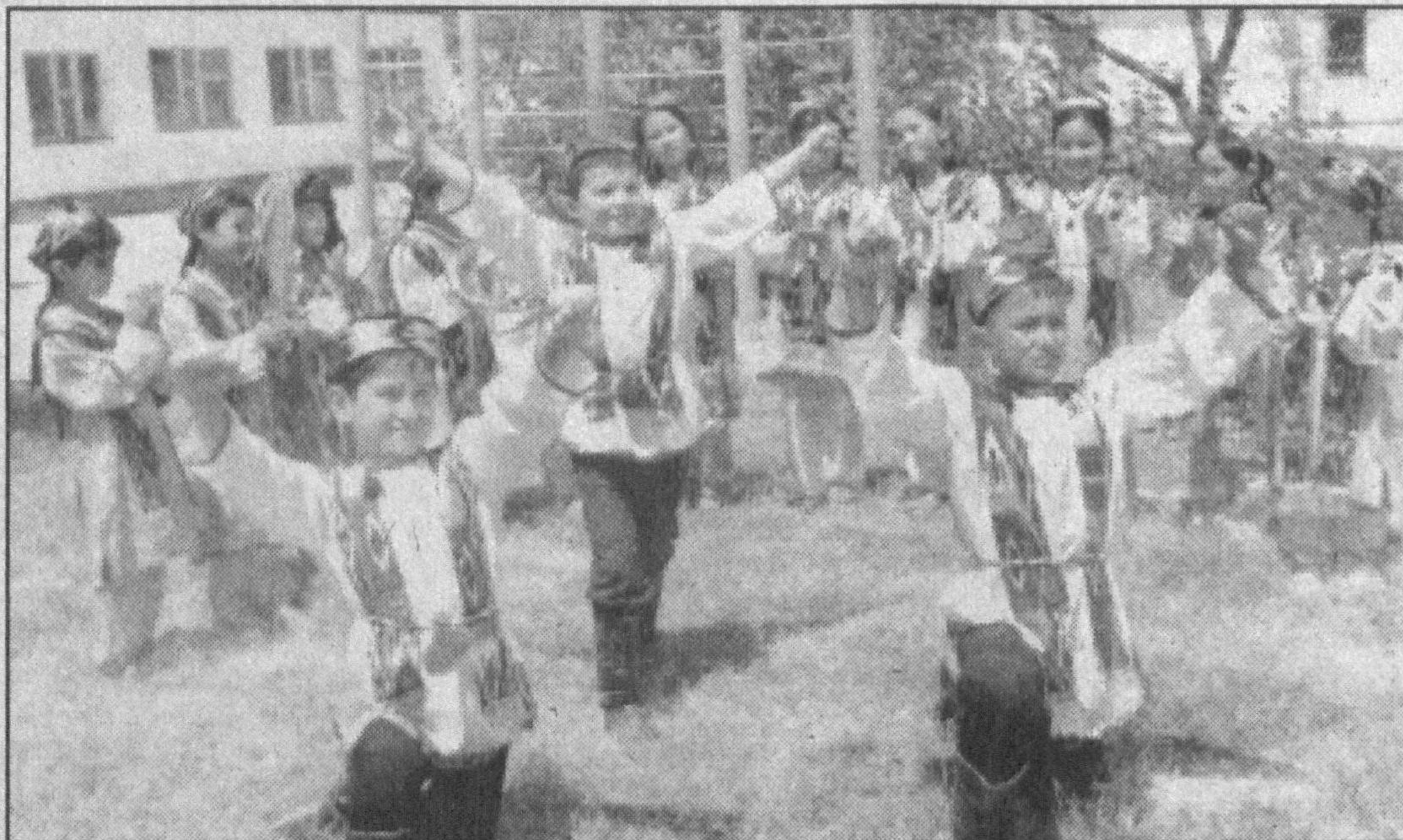
Қамаши туманидаги «Қизғалдоқ» фольклор этнографик жамоаси нафақат туманда, балки вилоятда ҳам таниқли. Болалар жамоасидан ташкил топган бу гуруҳ репертуаридан асосан миллий рақс ва ўйинлар ўрин олган.

Марказий Осиё ва Хиндистонда этнографик ва тилшунослик масалалари бўйича илмий кузатиш ишлари олиб бориб, шарқшунос олим сифатида танилган йирик фан арбоби Юрий Рерих таваллуд тоғлига юз йил бўлди. Лондон университетининг шарқ тиллари