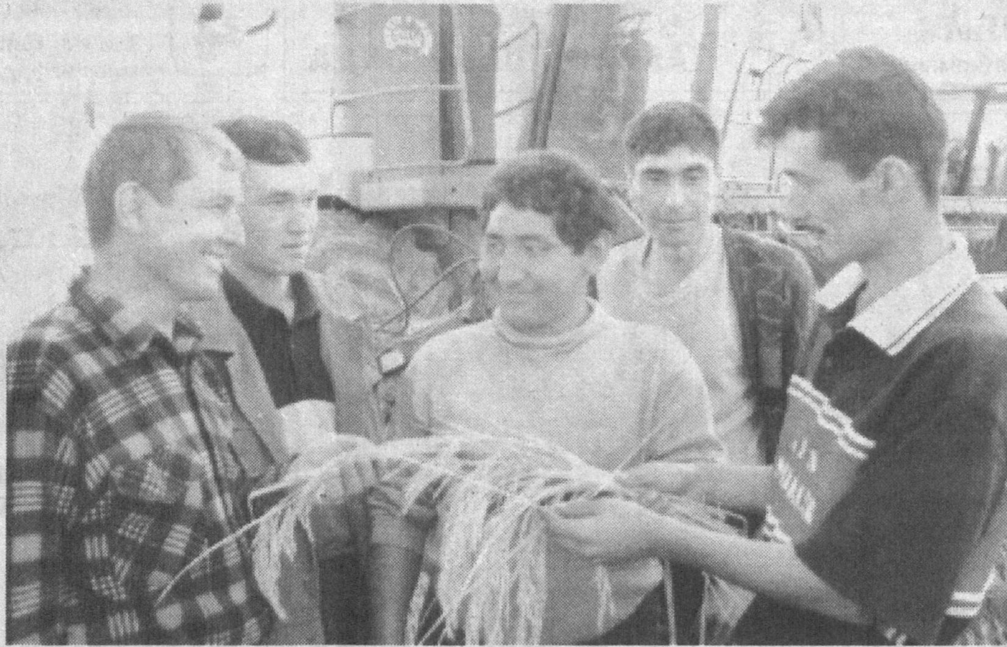
Сирдарё туманидаги «Шоликор» ширкатлар уюшмасида шולי ўрими уюшқоқлик билан бошлаб юборилди. Жорий йил уюшмада 7468 тонна ҳосил олиш кўзланган. Мавсумда шолидан режадаги 32 центнер ўрнига гектардан 40 центнердан ҳосил олинапти.

Ҳозир ўримида 14 та «Кейс» комбайнидан унумли фойдаланилмоқда. Кунига ҳар