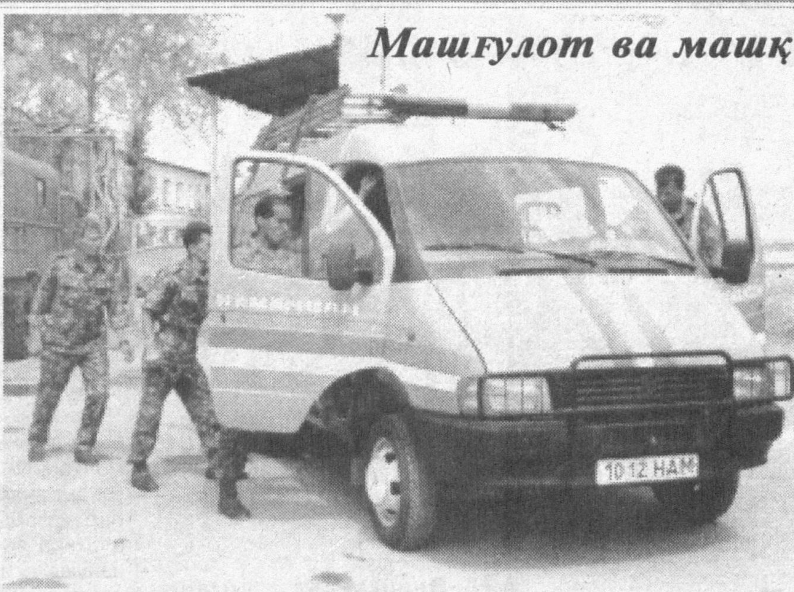
Машғулот ва машқ